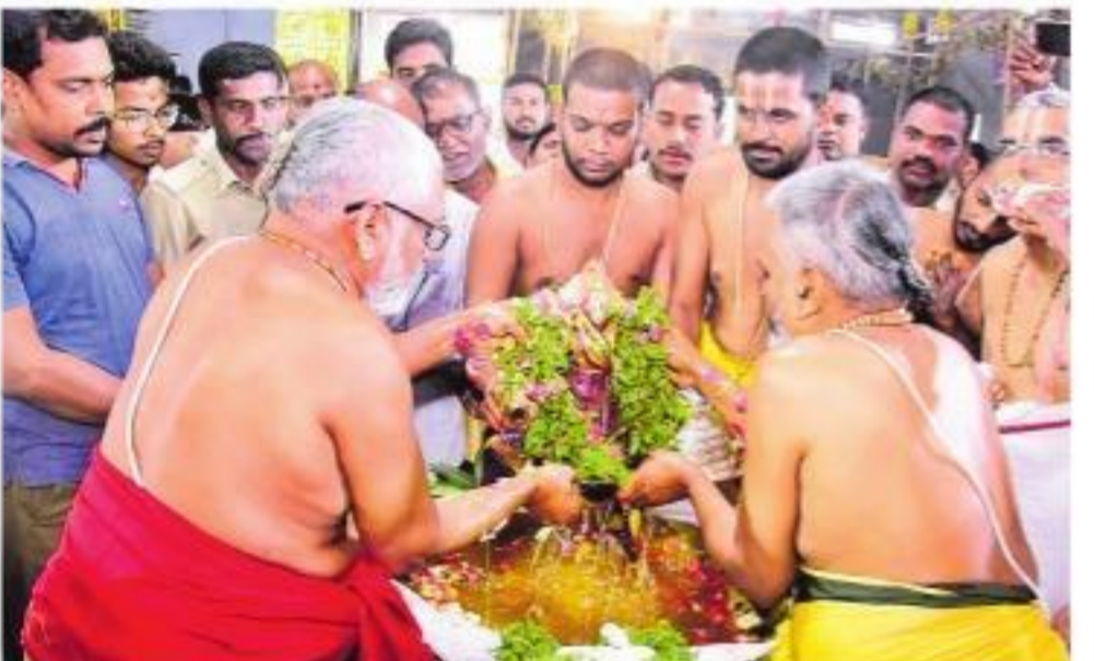
పాతగుట్టలో శ్రీచక్ర తీర్థ స్నానం నిర్వహిస్తున్న అర్చకులు