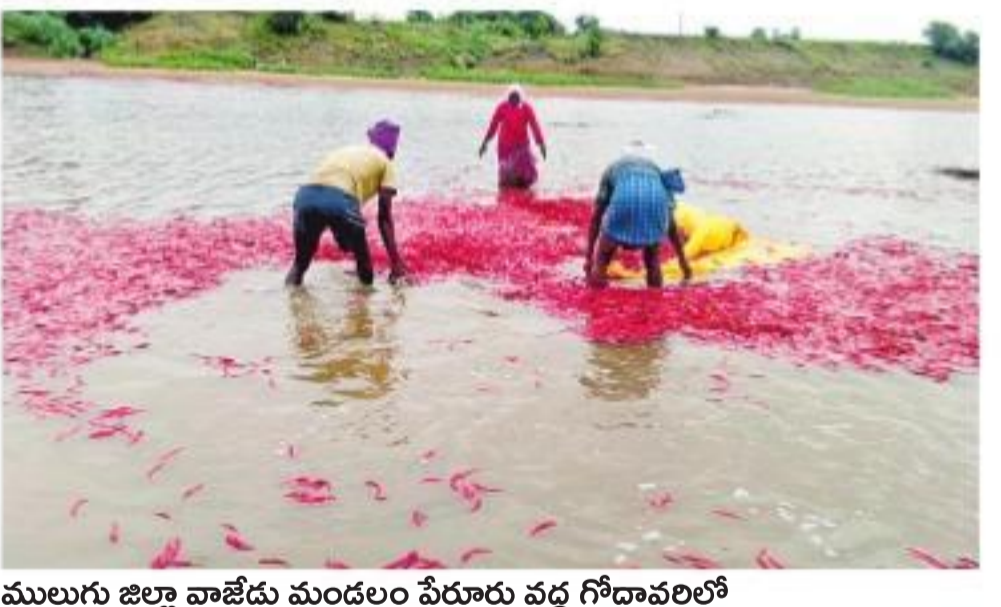
ములుగు జిల్లా వాజేడు మండలం పేరుకు వద్ద గోదావరిలో కొట్టుకుపోతున్న మిల్లిన పరదా ద్వారా సేకరిస్తున్న రైతులు

యాదగిరిగుట్ట: యాదాద్రి పాతగుట్ట శ్రీలక్ష్మీనరసింహస్వామి ఆలయ వార్షిక బ్రహ్మోత్సవ భాగంగా ఆరోజు ఆదివారం శ్రీ చక్రతీర్థ స్నానం కార్యక్రమాన్ని వేడుకగా జరిపారు. వర్షం కారణంగా శ్రీచక్ర ఆస్థానం సేవను ఉదయం ఆగమకార్య ప్రకారం ఆలయంలోనే నిర్వహించి, అనంతరం ప్రత్యేక పాత్రలో శుద్ధమైన జలానికి పూజలు జరిపించి, ఆలయ ప్రధాన మండపంలోనే శ్రీ చక్రతీర్థ స్నానం వేడుకను జరిపారు. అంతకుముందు ఆలయంలో పూజాహారాని నిర్వహించారు. సాయంత్రం శ్రీపుష్పయ గం, దేవత ఉద్యానన, డోలారోహణం చేపట్టారు. సోమవారం శ్రీస్వామి వారికి శత ఘటాభిషేకం నిర్వహించనున్నారు. ఈ ఘట్టంతో బ్రహ్మోత్సవాల పరిసమాప్తం కానున్నాయి. కాగా, యాదాద్రి శ్రీలక్ష్మీనరసింహస్వామి ఆలయంలో ఆదివారం భక్తుల రద్దీ నెలకొంది. హైదరాబాద్లో పాటు మేడారంలో జరిగిన సమృక్క-సారలమ్మ జాతరకు వెళ్లిన భక్తులు తిరుగు ప్రయాణంలో యాదాద్రిపడి దర్శనానికి వచ్చారు. సుమారు 25 వేలకు పైగా భక్తులు స్వామి, అమ్మవారిని దర్శించుకున్నారు. ధర్మదర్శనానికి 2 గంటల సమయం, శీఘ్ర, అతి శీఘ్ర దర్శనానికి 45 నిమిషాల సమయం పట్టిందని భక్తులు తెలిపారు.