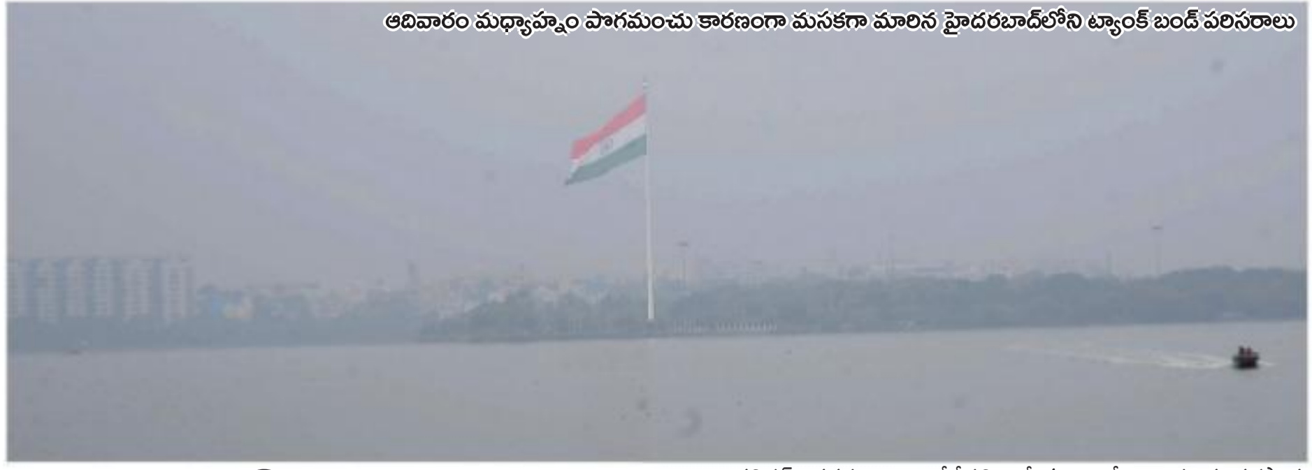
ఆదివారం మధ్యాహ్నం పొగమంచు కారణంగా మసకగా మారిన హైదరాబాద్లోని ట్యాంక్ బండ్ పరిసరాలు

నిజాం కలిగిన ముద్రించారు. 2000 సంవత్సరం వరకు పలు విదేశీ కంపెనీలు ఈ ముద్రణ వ్యవహారాలను చూసేవి. మేక్ ఇన్ ఇండియా సూత్రంతో భారత త్రవ నాణేల దిగుమతికి స్పష్టం చెప్పింది. ఈ టంకశాల ఆత్మాధునిక భద్ర తా లక్షణాలతో నాణ్యతను ముద్రిస్తోంది. తిరుపతి, సి. నాయ సంస్థాన్ (ట్రస్ట్), హాలిగమ్మ అలయం, శ్రీ కాళహస్తి దేవస్థానం వంటి ప్రముఖ అలయాల నుంచి వచ్చే బంగారం, వెండిని కుద్ది చేసి కొత్త రూపం ఇస్తారు. అలాగే కష్టమైన అధికారులు స్వాధీనం చేసుకున్న బంగారాన్ని కడ్డీలుగా మార్చే బాధ్యత కూడా దీనిదే. ఎన్నో మైలురాళ్లను తన ప్రస్థానంలో అధిరోపించిన ఈ టంకశాల త్వరలోనే రూ.20 నాణేలను ముద్రించబోతోంది.