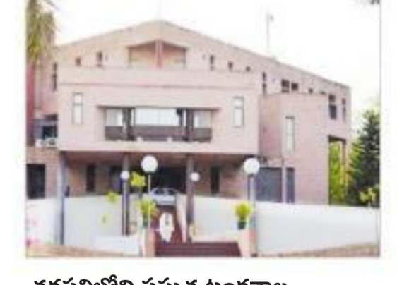
సుల్తాన్ షాహు రాజుసౌభంద్యంలోని టంకశాల చర్యపల్లించిన ప్రస్తుత టంకశాల

నిజాం కలిగిన ముద్రించారు. 2000 సంవత్సరం వరకు పలు విదేశీ కంపెనీలు ఈ ముద్రణ వ్యవహారాలను చూసేవి. మేక్ ఇన్ ఇండియా సూత్రంతో భారత త్రవ నాణేల దిగుమతికి స్పష్టం చెప్పింది. ఈ టంకశాల ఆత్మాధునిక భద్ర తా లక్షణాలతో నాణ్యతను ముద్రిస్తోంది. తిరుపతి, సి. నాయ సంస్థాన్ (ట్రస్ట్), హాలిగమ్మ అలయం, శ్రీ కాళహస్తి దేవస్థానం వంటి ప్రముఖ అలయాల నుంచి వచ్చే బంగారం, వెండిని కుద్ది చేసి కొత్త రూపం ఇస్తారు. అలాగే కష్టమైన అధికారులు స్వాధీనం చేసుకున్న బంగారాన్ని కడ్డీలుగా మార్చే బాధ్యత కూడా దీనిదే. ఎన్నో మైలురాళ్లను తన ప్రస్థానంలో అధిరోపించిన ఈ టంకశాల త్వరలోనే రూ.20 నాణేలను ముద్రించబోతోంది.