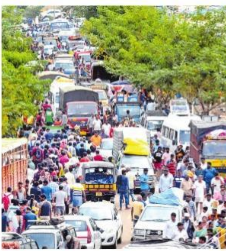
జంపన్న వారు నుంచి గద్దెల వద్దకు వెళ్లే దారిలో స్తంభంపై లాభి