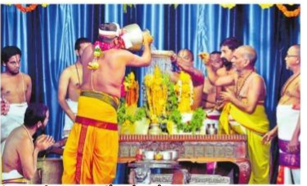
స్వామివారికి సహస్రధారలతో అభిషేకం చేస్తున్న అర్చకులు