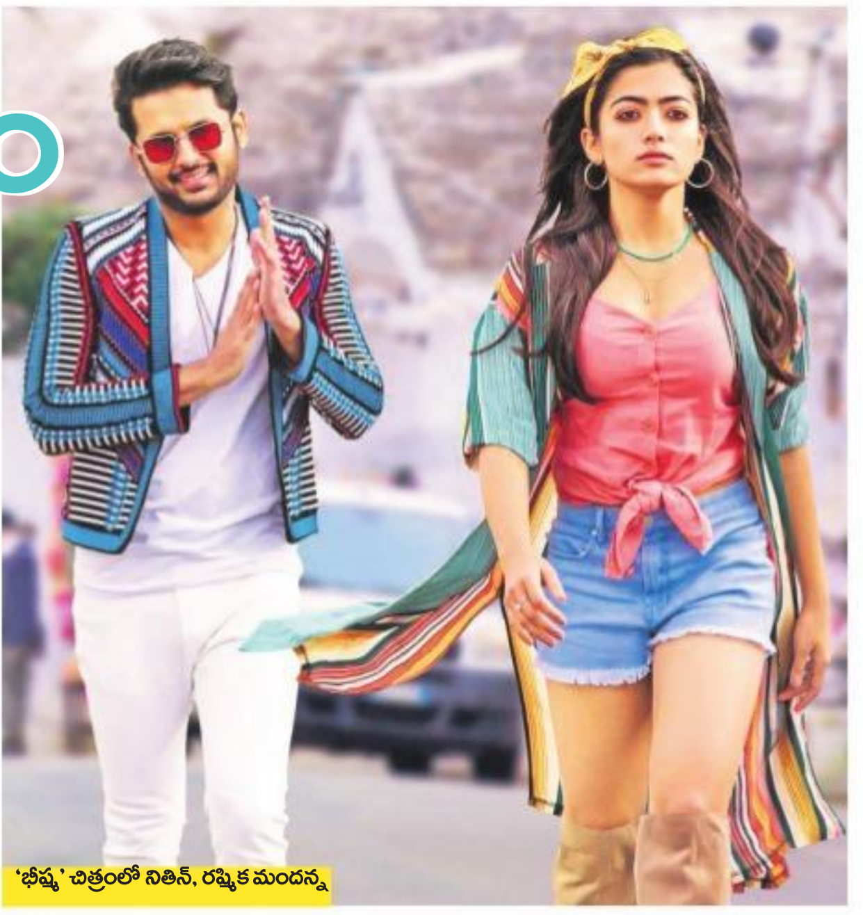
'భీష్మ' చిత్రంలో నితిన్, రష్మిక మందన్న

మిల్కీబ్యూటీ తమన్నా కబడ్డీ.. కబడ్డీ.. అంటూ తన జట్టుకు శిక్షణనిస్తూ కబడ్డీ కోచ్ గా అందరిచేత 'సీటీమార్' అని ప్రశంసలు అందుకోవడానికి రెడీ అవుతోంది. గోపీవంధి కథానాయకుడిగా సంపత్ నంది దర్శకత్వంలో రూపొందుతున్న చిత్రం 'సీటీమార్'. శ్రీనివాస్ చిట్టూరి నిర్వహిస్తున్న ఈ చిత్రంలో తమన్నా కబడ్డీ కోచ్ జ్వాలరెడ్డిగా ఓ విభిన్నమైన పాత్రలో కనిపించబోతుంది. ఇటీవల ఆమె లుక్ కు సంబంధించిన ఓ ఫోటోను విడుదల చేశారు. ఈ సందర్భంగా తమన్నా మాట్లాడుతూ 'స్పార్టివ్ లాగా సాగుతూ సహజంగా కూడిన పాత్ర ఇది. గోపీవంధి కలిసి తొలిసారి నటిస్తున్నా. జ్వాల రెడ్డి పాత్ర నా కెరీర్ లో ప్రత్యేకంగా నిలిచిపోవడనే నమ్మకం ఉంది' అని చెప్పింది. 'ఇటీవలే హైదరాబాద్ లో కొత్త షెడ్యూల్ మొదలుపెట్టాం. ఇందులో తమన్నా జాయిన్ అయ్యారు. నిర్మాత మం ఈ షెడ్యూల్ ను జరిపి వేసవిలో చిత్రాన్ని విడుదల చేసేందుకు సన్నాహాలు చేస్తున్నాం' అని నిర్మాత తెలిపారు. దిగంగన సూర్యవర్ణి, తరుణ్ అలౌరా, భూమిక పోసాని కృష్ణమూర్తి, రాధికామేధ తదితరులు నటిస్తున్న ఈ చిత్రానికి సినిమాటోగ్రఫీ: సాందరరాజన్, సంగీతం: మణిశర్మ, కథ, మాటలు, స్క్రీన్ ప్లే, దర్శకత్వం: సంపత్ నంది.