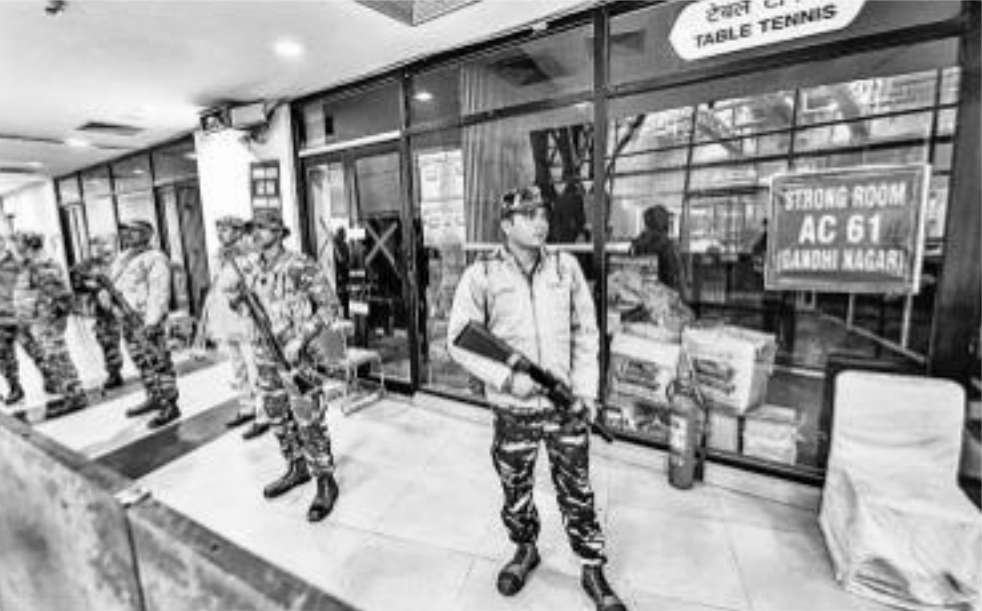
డిప్యూటీ ఈవీఎల భద్రవారిని స్టాంక్ రూం వద్ద పహారా కాస్తున్న భద్రవారిని బిల్లింది