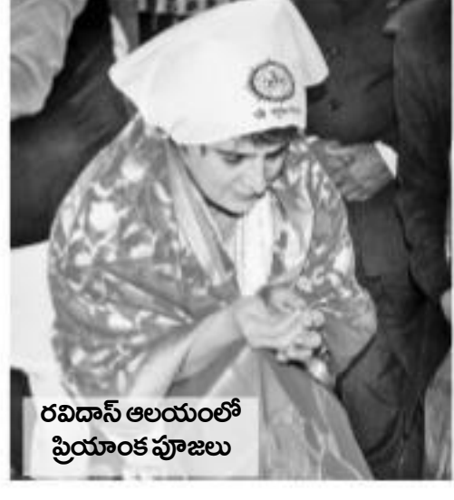
రవిదాస్ అలయంలో పూజలు

లక్నో: పద్మాలుగ్ శతాబ్ది సాగుపు, కవి గురు రవిదాస్.. మత, కుల వివక్ష లేని సమాజం కోసం కలలు కన్నారని, దాని సాకారానికి ప్రతి ఒక్కరూ కృషి చేయాలని కాంగ్రెస్ ప్రధాన కార్యదర్శి ప్రియాంకాగాంధీ కోరారు. రవిదాస్ జయంతి సందర్భంగా ఉత్తరప్రదేశ్ లోని వారణాసిలో జరిగిన కార్యక్రమంలో ఆమె మాట్లాడుతూ.. రవిదాస్ బోధనలను ప్రజల్లోకి తీసుకెళ్లాలని సూచించారు. రామ్, రజో.. ఒక్కరేనని రవిదాస్ బోధించారని.. హింస, విద్వేషం నెలకొన్న ప్రస్తుత సమాజంలో ఆయన బోధనలు తక్షణావసరమన్నారు. ఆయన బోధనల నుంచి మనం నేర్చుకోవాల్సిన అవసరం ఉన్నదన్నారు. సర్కుల రవిదాస్ జన్మస్థలంలో పూజలు చేయడం అర్హులైన వాళ్ళు వ్యాప్తిచేసారని ఉపరాష్ట్రపతి ట్వీట్ చేశారు. సమాజంలో సానుకూల మార్పుకు ముందు ఆమె గురు రవిదాస్ జన్మస్థానం మందిరంలో ప్రత్యేక పూజలు నిర్వహించి, సహచర్య బోధనలు చేశారు.