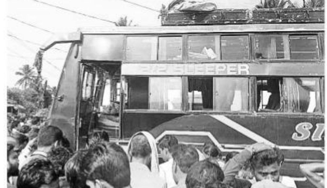
ఒడిశాలోని మందరాజపూర్ సమీపంలో బస్సుకు కరెంట్ తీగలు తగిలి 10 మృత్యు..

దీంతో ప్రాణనష్టం పెరిగింది. ఈ దుర్ఘటనపై ముఖ్యమంత్రి నవీన్ పట్నాయక్ దిగ్భ్రాంతి వ్యక్తం చేశారు. మృతుల కుటుంబాలకు రూ.2 లక్షల ఎక్స్ గ్రేషియా ప్రకటించారు. అలాగే గాయపడినవారికి ఉచిత వైద్యం అందించనున్నట్లు తెలిపారు. దుర్ఘటనపై సమగ్ర దర్యాప్తు జరిపిస్తామని, బాధ్యులపై కఠిన చర్యలు తీసుకుంటామని రాష్ట్ర రవాణా శాఖ మంత్రి కేంద్ర వెల్లడించారు. ఘటనపై కేంద్ర వెల్లడించిన శాఖ మంత్రి ఘోషం ప్రధాని తీసుకోవాలని రాష్ట్ర ప్రభుత్వం కోరారు. ప్రమాదం జరిగిన వెంటనే స్థానిక ప్రజలు, అగ్నిమాపక సిబ్బంది, పోలీసులు రంగంలోకి దిగారు. మంటలు ఆగ్ని వేసి, బస్సులో ఉన్నవారిని సుమం దవాఖానుకు తరలించినట్లు టీవీ ఛానెల్ సుకంత్