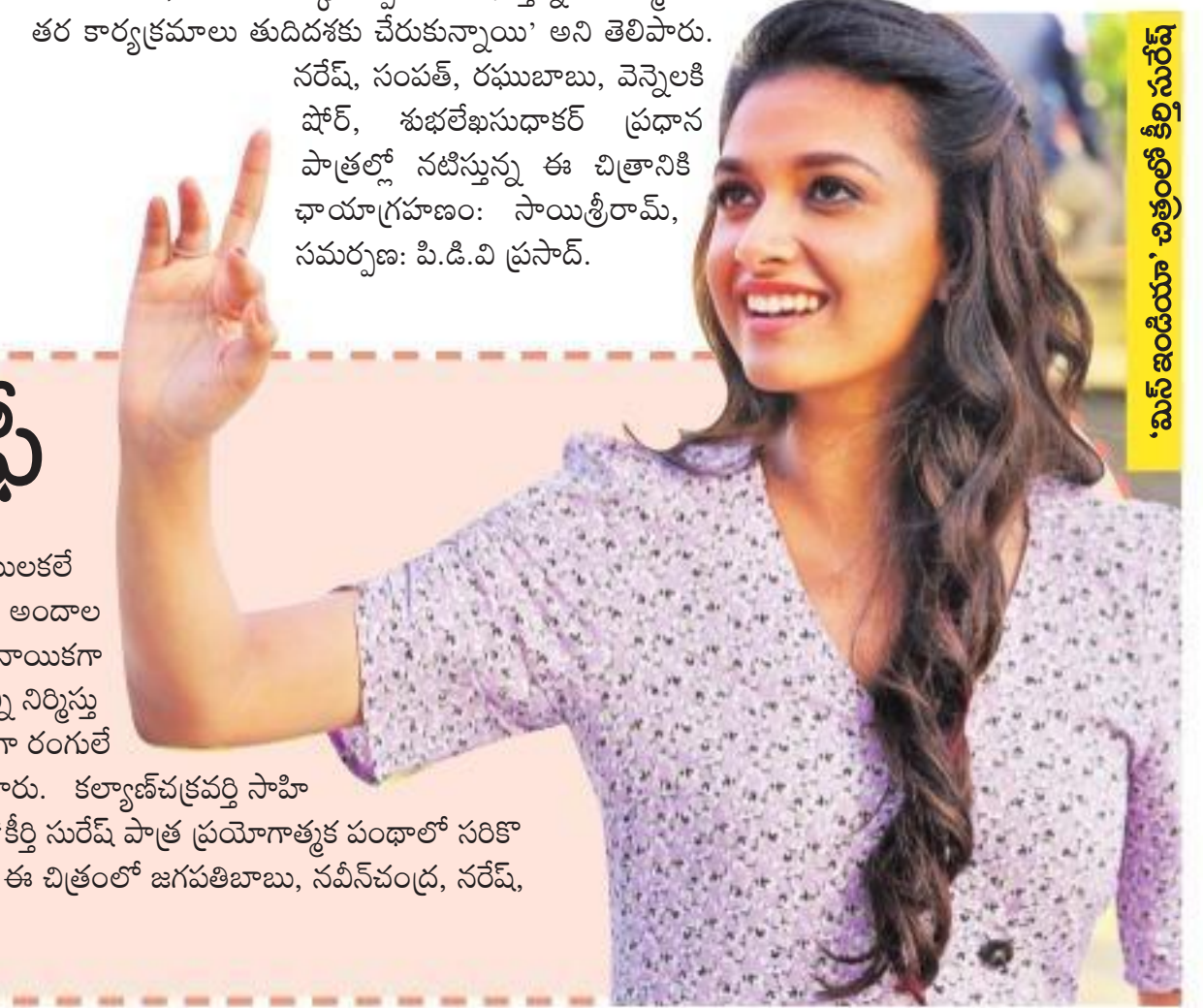
'మిస్ ఇండియా' చిత్రంలో కీర్తి సురేష్

నితిన్, రష్మిక మందన్న జంటగా నటిస్తున్న చిత్రం 'భీష్మ'. వెంకీ కుడుముల దర్శకుడు. సితార ఎంటర్ టైన్ మెంట్స్ పతాకంపై సూర్యదేవర నాగవంశీ నిర్వహిస్తున్నారు. ఈ చిత్రంలోని 'నా కలలే నీ రూపంలో ఎదురయ్యే నిజమా చూయి.. ఏవేవో ఊహలు నాలో మొదలయ్యాయి.. సరాసరి గుండెల్లో దించావే, మరి మరి మైకంలో ముంచావే' అనే గీతాన్ని ఆదివారం చిత్రబృందం విడుదలచేసింది. నితిన్, రష్మిక మందన్నలపై రాజమండ్రి పరసర ప్రాంతాల్లో ఈ పాటను చిత్రీకరించారు. శేఖర్ మూర్తి స్వతంత్రంగా అందించారు. శ్రీమణి సాహిత్యాన్ని అందించిన ఈ గీతాన్ని అనురాగ్ కులకర్ణి అలపించారు. మహతి స్వరసాగర్ సంగీతాన్ని అందించారు. ఈ నెల 21న చిత్రం విడుదలకానుంది. దర్శకుడు మాట్లాడుతూ 'రొమాంటిక్ లవ్ ఎంటర్ టైన్ మెంట్ నమ్మకం ఉంది. భీష్మ ఎవరు? తన ప్రేమప్రయాణంలో ఎదురైన అపరోధాల్ని ఎలా అధిగమించాడన్నది నమ్మకంపై ఆధారపడి ఉంటుంది. ఇటీవల విడుదలచేసిన పాటలు, టీజర్ కు చక్కటి స్పందన లభిస్తున్నది. నిర్మాణాంతర కార్యక్రమాలు తుదిదశకు చేరుకున్నాయి' అని తెలిపారు.