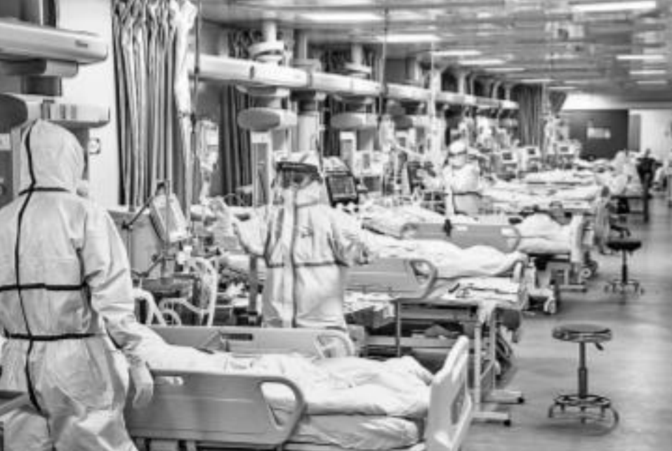
పునెలోని ఒక దవాఖానలో చికిత్స పొందుతున్న కరోనా బాధితులు

సంఖ్య కూడా క్రమంగా పెరుగుతున్నది. శనివారం దాదాపు 600 మంది వైరస్ నుంచి విముక్తి పొందినట్లు అధికారులు వేర్కొన్నారు. కాగా 2002-2003 మధ్య ప్రపంచ దేశాల్లో వణికించిన సార్స్ వైరస్ దాదాపు 774 మందిని బలిగొన్న విషయం తెలిసిందే. భారత్ కు కరోనా ముప్పు కరోనా వైరస్ విస్తరించే అవకాశం గల దేశాల్లో భారత్ ఉండటం ఆందోళన కలిగిస్తున్నది. కరోనా సోకిన బాధితులు చైనా నుంచి అదివరకే వివిధ దేశాలకు చేరుకొని ఉండచ్చని, ఆ పల శనివారానికి వైరస్ బారిస్ పడ్డ వారి సంఖ్య 509గా ఉన్నది. గత సోమవారంతో పోలిస్తే (890 మంది) గాఢీతుల సంఖ్య కొంత మేర తగ్గినట్లు చైనా కేంద్ర ఆరోగ్య కమిషన్ తెలిపింది. దీని నుంచి కోలుకుంటున్న వారి