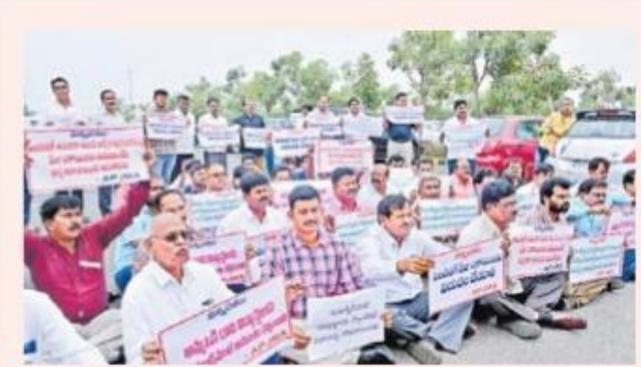
సచివాలయం వద్ద ధర్నా చేస్తున్న ప్రైవేటు జూనియర్ కాలేజీల యాజమాన్య ప్రతినిధులు

డాక్యుమెంటుల్ ప్రైవేటు వ్యక్తులు, కాంట్రాక్టు ఉద్యోగులు, కన్న లైబ్రరీ ఉద్యోగులు పేర్లను కానీ, వారి పోస్ట్ నెంబర్లు కానీ ఎక్కడా పొందుపరచకూడదు. కానీ జనరల్ మేనేజర్ పేర్లను, పోస్ట్ నెంబర్లను టెండర్ డాక్యుమెంటుల్లో పొందుపరచుతున్నారు. దీని వెనుక భారీ అవకాశాలకు జరుగుతున్నట్లు సమాచారం.