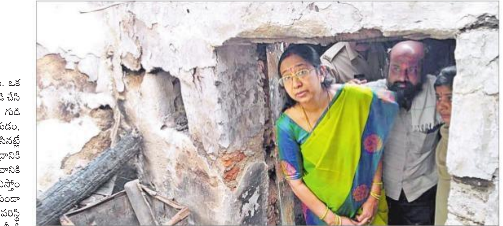
సోమవారం నిర్వే జిల్లా భైంసాలోని కోర్గల్లో ఇటీవల అల్లరి మూకలు దహనం చేసిన బలదీని పరిశీలిస్తున్న జాతీయ బాలల హక్కుల కమిషన్ సభ్యుల ప్రజ్ఞా పరాంధి

పోలీసులు అరెస్ట్ చేయడం బాధాకరమన్నారు. ఒక వర్గం వాళ్ళ మరో వర్గం వారిపై కావాలనే దాడి చేసి నష్టం కలిపిస్తోందని ఆరోపించారు. పూర్ గుడి సెలు, పెంకుటిక్కల్ పెట్రోబొంబులు వేయడం, రాళ్ళు వేయడం చూస్తుంటే పథకం ప్రకారం చేసినట్లే కనిపిస్తోందన్నారు. భైంసా ఘటనపై కేంద్రానికి నీవేదిక ఇస్తానన్నారు. భైంసా గురించి ప్రపంచానికి తెలియకుండా చేయాలని రాష్ట్రప్రభుత్వం భావిస్తోందని.. అందుకే అక్కడకు ఎవరినీ వెళ్ళనియకుండా ఆంధ్రులు విడిచిపెట్టడం ఆరోపించారు. అక్కడి పరిస్థితులను దాటిపెట్టి ప్రస్తుతం చేయడానికి మీడియాపై ఆంధ్రులు విధించినా, సోషల్ మీడియా ద్వారా ప్రపంచానికి తెలుస్తుందన్నారు.