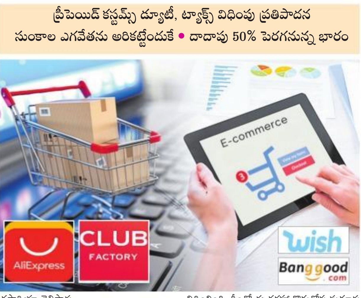
ప్రీపెయిడ్ కస్టమ్స్ ద్యూటీ, ట్యాక్స్ విధింపు ప్రతిపాదన సుంకాల ఎగవేతను అరికట్టేందుకే • దాదాపు 50% పెరగనున్న భారం

హ్యూడ్డిల్లి: విదేశీ ఈ-కామర్స్ సైట్లలో జరిపే కొనుగోళ్లు ఇక్కడ భారం కానున్నాయి. ఈ షాపింగ్ పోర్టల్లో లావాదేవీల్లో సుంకాలు, పన్నులు ఎగవేత ఉదంతాలు చోటు చేసుకుంటుండటంపై కేంద్రం మరింతగా దృష్టి సారించడమే ఇందుకు కారణం. సీమంతర లావాదేవీలపై ప్రీ-పెయిడ్ విధానంలో కస్టమ్స్ సుంకాలు, పన్నులను వడ్డించే అంశాన్ని ప్రభుత్వం పరిశీలిస్తోంది. ఈ విధానం అమల్లోకి వచ్చిన పక్షంలో విదేశీ ఆన్లైన్ షాపింగ్ సైట్ల ద్వారా జరిపే కొనుగోళ్లు దాదాపు 50% మేర భారం కాగలవని పరిశ్రమ వర్గాలు తెలిపాయి.