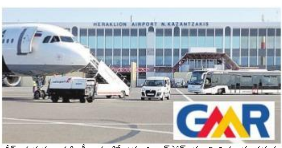
గ్రీన్ ప్రభుత్వం ఈక్విటీ, ఇన్ఫ్రాస్ట్రక్చర్ కన్సల్టెంట్ కంపెనీ నిధులను సమకూరుస్తుంది. హెరాక్లియాస్ గ్రీన్లోన్ రెండో అతిపెద్ద విమానాశ్రయం. గత మూడేళ్లుగా 10 శాతం ట్రాఫిక్ వృద్ధిని నమోదు చేస్తుంది. ప్రపంచంలోని ఉత్తమ పర్యాటక ప్రాంతాల్లో గ్రీన్ ఒకటి. ఏటా 35 మిలియన్ల మంది పర్యాటకులు వస్తుంటారు. క్రీల్ అత్యధిక పర్యాటకులను ఆకర్షించే ద్వీపం.

హైదరాబాద్, బిజినెస్ బ్యూరో: జీఎంఆర్ ఇన్ఫ్రాస్ట్రక్చర్ అనుబంధ కంపెనీ జీఎంఆర్ ఎయిర్పోర్ట్ (జీఎఎల్) గ్రీన్ ట్రీల్లోన్ హెరాక్లియాస్ అంతర్జాతీయ విమానాశ్రయం డిజైన్, నిర్మాణం, హెరాక్లియాస్, ఆపరేషన్, నిర్వహణ బిడ్డును దక్కించుకుంది. దీంతో యూఎస్ఎస్ఎస్ ఎయిర్పోర్ట్ నిర్వహణ బిడ్డు గెలిచి తొలి భారతీయ ఎయిర్పోర్ట్ ఆపరేటర్గా జీఎంఆర్ నిలిచింది. జీఎఎల్, దాని గ్రీన్ భాగస్వామి జీఎల్ డిర్ల్యా కన్సల్టెంట్ గతేడాది ఫిబ్రవరిలో కన్సెప్షన్ అగ్రిమెంట్ మీద సంతకాలు చేసి విషయం తెలిసింది. విమానాశ్రయ అభివృద్ధికి ఈ కన్సల్టెంట్ యొక్క 500 మిలియన్ యూరోలకు పైగా పెట్టుబడులు పెట్టనుంది. ఎయిర్పోర్ట్ ప్రాజెక్ట్ నిర్మాణానికి గ్రీన్ ప్రధాన మంత్రి కిరయోకోస్ మిట్సోటాకిస్ పునాది రాయి చేశారు. ఈ సందర్భంగా జీఎంఆర్ గ్రూప్ ఎన్ఆర్ఐ అండ్ ఇంటర్నేషనల్ ఎయిర్పోర్ట్స్ చైర్మన్ శ్రీనివాస్ బొమ్మిడాల మాట్లాడుతూ... హెరాక్లియాస్ విమానాశ్రయం బిడ్డు జీఎంఆర్ గ్రూప్ ఈయన రిజియన్లకు మంట్ల ఇన్ఫ్రాస్ట్రక్చర్ యిడెన్టీఫై చేశారు. ప్రతిష్టాత్మక ఎయిర్పోర్ట్ ప్రాజెక్ట్ భాగస్వామ్యం కావటం ఆనందంగా ఉందని తెలిపారు. అంతర్జాతీయ ప్రమాణాలతో ఎయిర్పోర్ట్ను నిర్మిస్తామని చెప్పారు. ప్రాజెక్ట్ కన్సెప్షన్ పీరియడ్ 35 ఏళ్లు. ఈ ప్రాజెక్టుకు స్థానిక