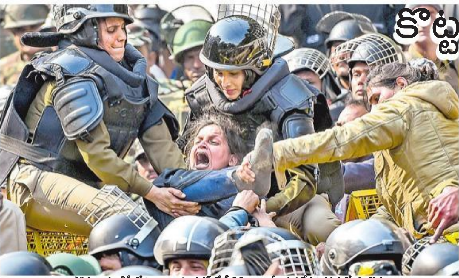
సోమవారం ఢిల్లీలోని జామియా నగర్లో సీపిఐ, ఎన్డీఎస్ వ్యతిరేక నిరసనలో పాల్గొన్న ఓ మహిళను బ్యారీకేడ్ నుంచి పక్కకు నెట్టేస్తున్న మహిళా పోలీసులు