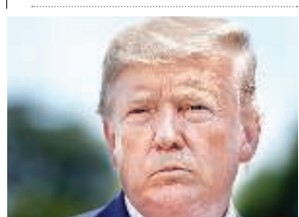
डोनाल्ड ट्रंप फाइल फोटो सचिव स्टेफनी ग्रिशम ने कहा, 'पिछले सप्ताहांत मोदी-ट्रंप के बीच टेलीफोन पर बात हुई थी जिसमें भारत दौरे पर अंतिम सहमति बनी थी। यह यात्रा रणनीतिक रिश्तों को और प्रगाढ़ करेगी।' ट्रंप कार्यकाल के अखिरी साल में भारत आ रहे हैं। वैसे मोदी-ट्रंप की कई बार भेंट हो चुकी है। जून, 2017 में वाशिंगटन में मोदी पहली बार ट्रंप से मिले थे। मोदी ने उन्हें भारत यात्रा का न्यौता दिया था। 2019 में उन्हें गणतंत्र दिवस पर बुलाने की कोशिश की गई थी, लेकिन इच्छा के बावजूद ट्रंप नहीं आ सके थे। वर्ष 2000 के बाद हर अमेरिकी राष्ट्रपति ने की भारत की यात्रा पेज>>3