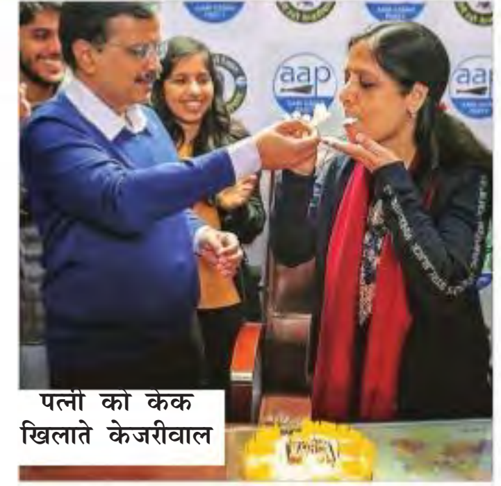
पत्नी को केक खिलाते केजरीवाल