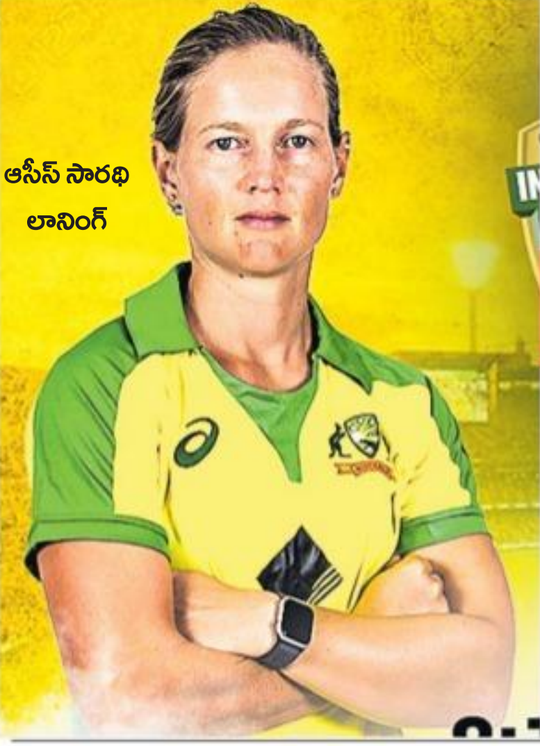
ఆసిస్ సారథి లానింగ్