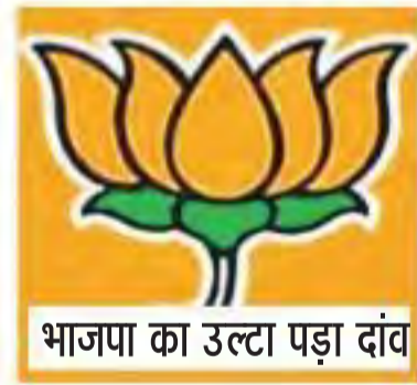
भाजपा का उल्टा पड़ा दांव

सकारात्मक पहल थी। पार्टी इस बार चुनाव अधिनियम में जनता को यह भरोसा दिलाने में भी कामयाब रही कि आने वाले पांच साल में इस हालात में सुधार होगा। भाजपा के पूरे अधिनियम की सफलता आम आदमी पार्टी के विकास मॉडल की असफलता पर फंसी थी।