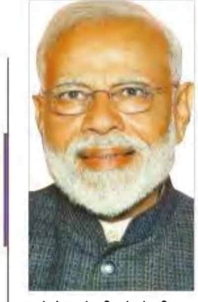
ने फैंसलों की जो संघुरी बनाई, भारत ने तेजी से फैंसले लिए।

जनसत्ता ब्यूरो नई दिल्ली, 12 फरवरी। प्रधानमंत्री नरेंद्र मोदी ने बुधवार को कहा कि देश में बहुत सारे लोगों द्वारा कर नहीं देने का भार ईमानदार करदाताओं पर पड़ता है। लिहाजा, हर भारतीय को आत्ममंथन कर ईमानदारी से कर देना चाहिए। समाचार चैनल 'टाइम्स नाउ' के एक कार्यक्रम में उन्होंने कहा, 'जब बहुत सारे लोग कर नहीं देने के तरीके खोज लेंगे, तो इसका भार उन लोगों पर पड़ता है, जो ईमानदारी से कर चुकाते हैं।' उन्होंने कहा कि पिछले पांच साल में देश में 1.5 करोड़ से ज्यादा कारों की बिक्री हुई है। तीन करोड़ से ज्यादा भारतीय कारोबार के काम से या घूमने बाकी पेज 8 पर