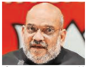
अमित शाह फाइल फोटो

कहा, जीत-हार के लिए चुनाव नहीं लड़ती भाजपा, विचारधारा के बिस्तार के लिए मैदान में उतरती है पार्टी