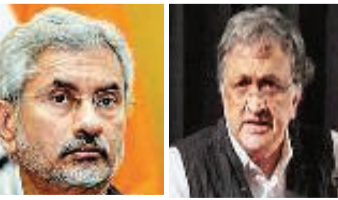
जयशंकर रामचंद्र गुहा (फाइल)