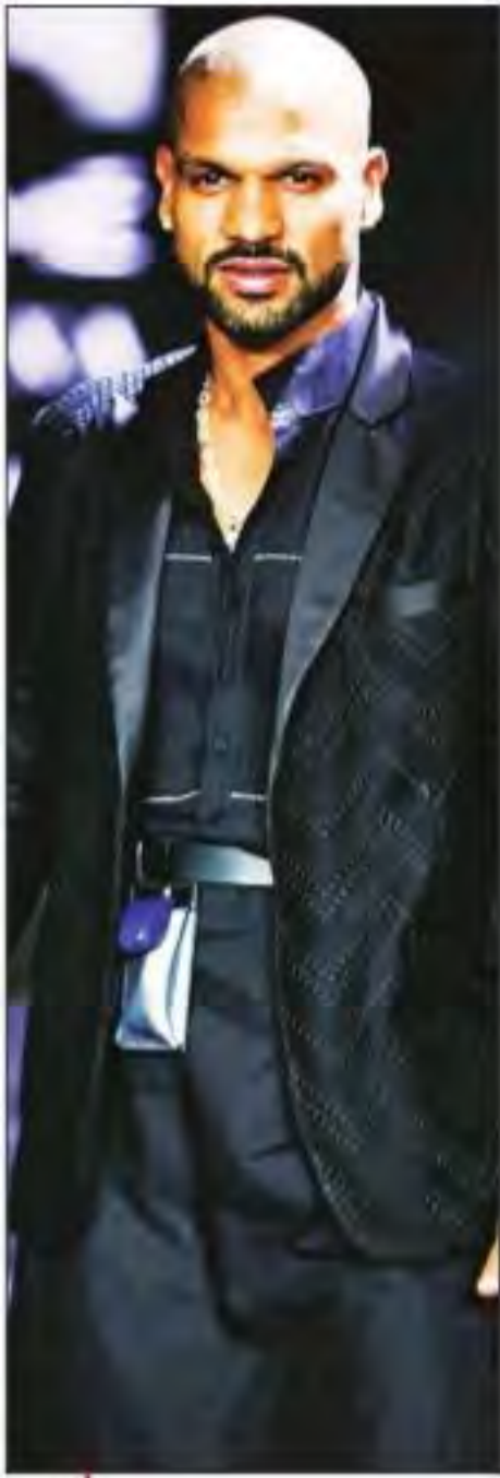
मुंबई में एक कार्यक्रम के दौरान रैंप पर क्रिकेटर शिखर धवन।