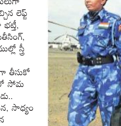
బానా విధుల్లో భారత మహిళా జవాన్లు