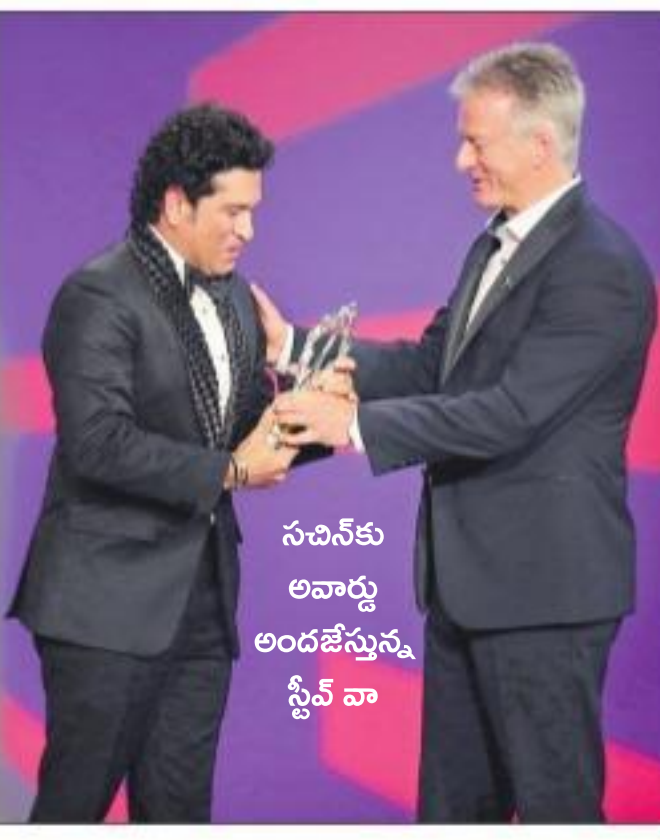
సచిన్ కు అవార్డు అందజేస్తున్న స్టీవ్ వా

గత ఇరవై ఏళ్లలో (2000-2020) ఇరవై అత్యుత్తమ క్రీడా ఘట్టాలను 'లారియన్' ముందుగా ఎంపిక చేసింది. మూడు రౌండ్ల ద్వారా విజేతను తేల్చారు. జనవరి 10 నుంచి ఫిబ్రవరి 16 మధ్య ప్రపంచ వ్యాప్తంగా అతి మానులకు దీనికి ఓటింగ్ చేసే అవకాశం కల్పించగా... జాబితాను ముందుగా టాప్-10కు, ఆ తర్వాత టాప్-5కు కుదించి చివరకు అత్యుత్తమ క్షణాన్ని ప్రకటించారు. ఫైనల్ రౌండ్ లో మిగిలిన నాలుగు నామినేషన్లను వెనక్కి నెట్టిన 'క్యాబ్లీడ్ ఆన్ ద షోర్ట్స్ ఆఫ్ ఎ నేషన్'కు అవార్డు దక్కింది. ఈ అవార్డుకు సాధారణ మ్యాచ్ ల ఫలితాలు, స్కోర్లు తదితర అంశాలతో సంబంధం లేకుండా ఎక్కువగా భావోద్వేగాలకు సంబంధించిన ఘట్టాలనే ఎంపిక చేసి నామినేషన్ చేశారు.