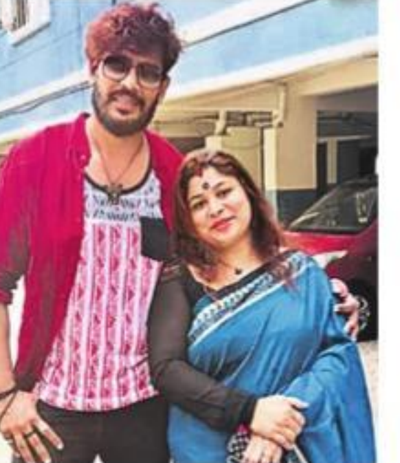
● భర్త ఇండ్రస్ట్రీలో...

బీబీని అంచనా వేయడం చేపలం మీకు కనిపిస్తున్న లక్షణాలతో ఆ సమస్య ఉందని అనుకోవడం సరికాదు. మనలో రక్తపోటు పెరగడం వల్ల ఎండే అధ్వాల్తో ముఖమెండైన మెడలోని రక్తనాళాల వివరల్లో రక్తం ఒత్తిడి పెరగడం వల్ల తలవొప్పి రావచ్చు. అలాగే మన భంగిమ (పోస్చర్)ను ఆకస్మాత్తుగా మార్చడం వల్ల ఒకే సారి మనలో రక్తపోటు తగ్గవచ్చు. దీన్ని 'ఆరోస్టాటిక్ హైపోటెన్షన్' అంటారు. అలాంటి సమయాల్లోనూ మీరు చెప్పినట్లుగా ముందుకు చదివోతానేమో లాంటి ఫీలింగ్, గిడ్డెనే కలగవచ్చు. బీబీతో మూర్చలు కోలు చేసుకోవడం వల్ల మీరు చెప్పిన లక్షణాలు కనిపించినప్పటికీ, అవి బీబీ వల్లనే అని చెప్పలేం. సాధారణంగా బీబీ వల్ల ఉదయం వేళ్లలో తలవొప్పి వచ్చినప్పటికీ, ఇతర చాలా ఆరోగ్య సమస్యలలోనూ తలవొప్పి ఒక లక్షణంగా ఉంటుంది. అలాగే మీరు చెప్పిన గిడ్డెనే సమస్యకు వల్లగా, సింకోపి లాంటి మరెన్నో సమస్యలు కాకపోవచ్చు. అందుకు కేవలం లక్షణాల ఆధారంగానే బీబీ నిర్ధారణ చేయడం సరికాదు. అందుకే మీరు నిర్ణయంగా ఒకసారి డాక్టర్ ను కలవండి. వారు కూడా కేవలం ఒక్కో పరీక్షలోనే బీబీ నిర్ధారణ చేయరు. అనేక మాట్ల, అనేక సందర్భాల్లో బీబీని కొలిచిచూస్తారు. ఒకవేళ నిజంగానే సమస్య ఉంటే అప్పుడు మాత్రమే దాన్ని కచ్చితంగా నిర్ధారణ చేసి చికిత్స సూచిస్తారు. డాక్టర్ ఎమ్. గోవర్ధన్, గీనియర్ ఫిజిషియన్, కేరీ హాస్పిటల్, నాంపల్లి, హైదరాబాద్