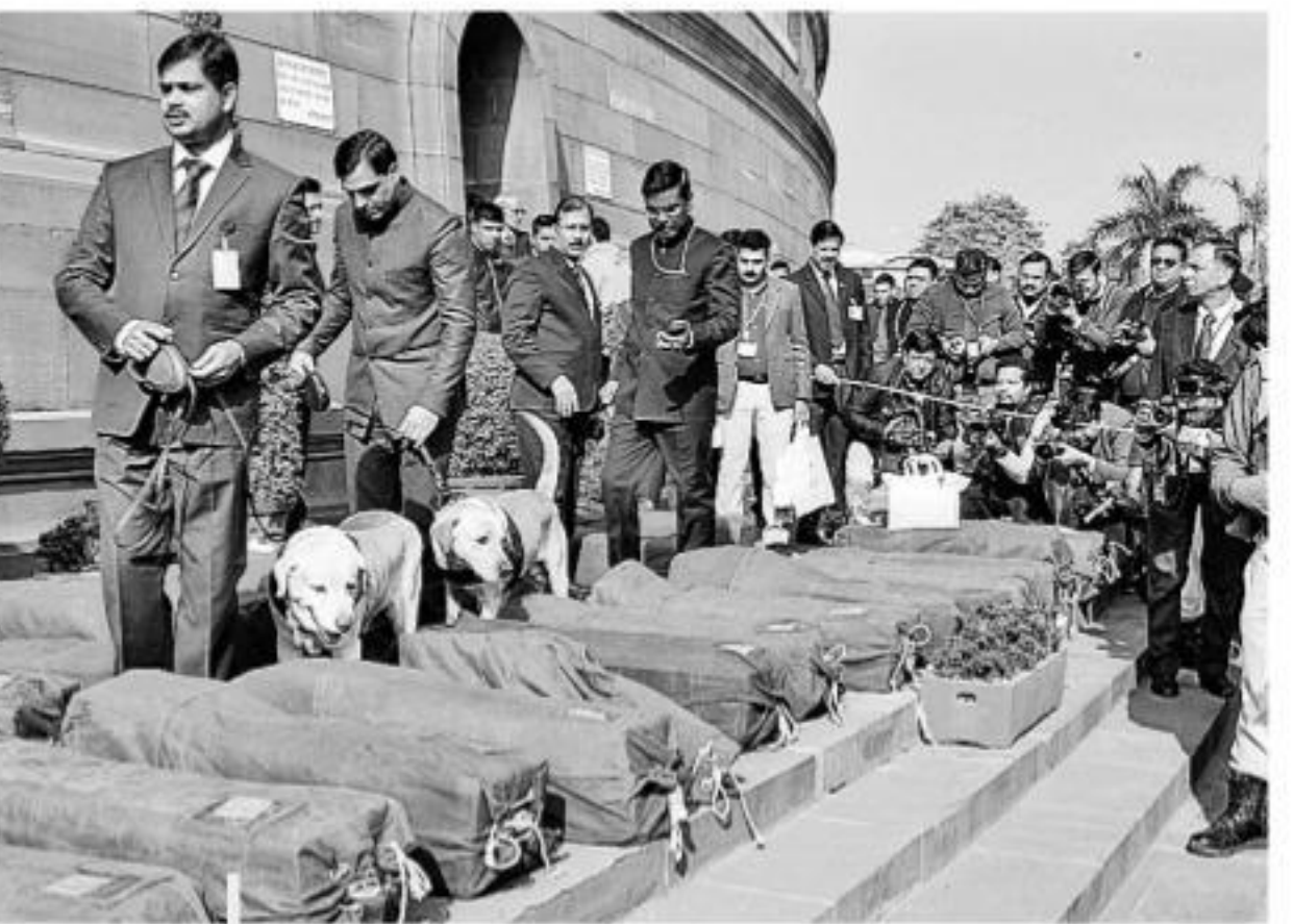
కేంద్ర బడ్జెట్ ప్రవేశపెట్టిన సందర్భంగా.. శనివారం పార్లమెంట్ అవరణలో ఉంచిన బడ్జెట్ పత్రాలు కలిగిన బ్యాగ్లను జాగ్రత్తగా తనిఖీ చేస్తున్న భద్రతా సిబ్బంది