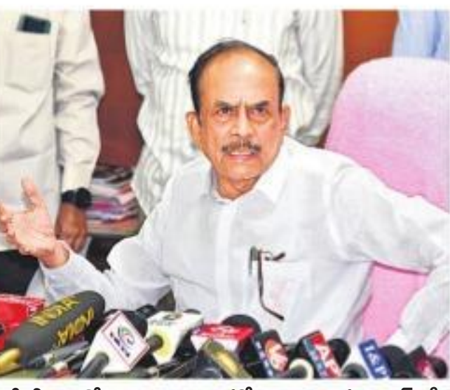
మీడియాతో మాట్లాడుతున్న హాంకం మంత్రి మహమూద్ అలీ

ఆధారాలంటే చూపండి.. లేదంటే రూ. వెయ్యికోట్లకు పరువునష్టం దావావేస్తాం దేశంలోనే తెలంగాణ పోలీస్ నంబర్ వన్.. ప్రతిష్ట దిగజార్చేందుకే కుట్రపూరిత కథనం ఈనాడు 'దొంగలతో డోస్టీ' కథనంపై హాంకం మంత్రి మహమూద్ అలీ సీరియస్ న్యాయపరమైన చర్యలకు సిద్ధంగా ఉండాలి: ఈనాడుకు డీజీపీ హెచ్చరిక ఈనాడు కథనంపై పోలీసు అధికారుల సీరియస్ తీవ్రంగా ఖండించిన కమిషనర్లు, పోలీసు అధికారుల సంఘం