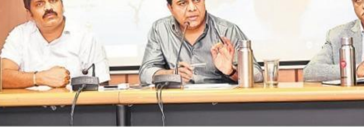
శనివారం ఎంసీపీఎస్ లో జీహెచ్ఎంసీ అధికారులతో సమీక్షిస్తున్న రాష్ట్ర పురపాలక, ఐటీశాఖ మంత్రి కే.ఆర్.కామారావు. చిత్రంలో జీహెచ్ఎంసీ మేయర్ బొంతు రామోజి, మున్సిపల్ శాఖ ముఖ్య కార్యదర్శి అరవింద్ కుమార్ ఉన్నారు.

జీహెచ్ఎంసీ అధికారులకు పురపాలకశాఖ మంత్రి కేటీఆర్ ఆదేశం