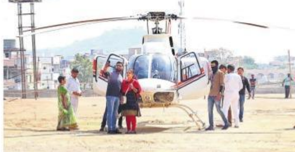
శనివారం వేములవాడలో హెలికాప్టర్ వద్ద సీట్ల దిగుతున్న ఔట్ సాహెబులు

రూ. మూడువేలు చెల్లిస్తే హెలికాప్టర్ మేడారం, వేములవాడకు రూ. 30 వేలు సేవలు విస్తరించే యోచనలో ప్రభుత్వం