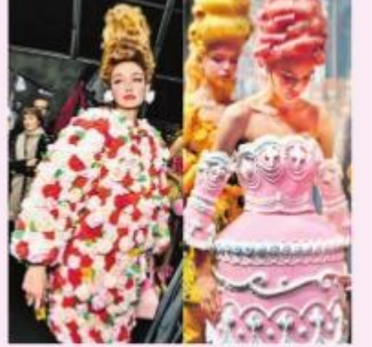
బెనా ప్రింట్స్, బోక్ షోర్ట్స్ తో 'మ్యాస్కో' వారి మోడల్ గర్ల

ఇటలీలోని మిలాన్ నగరంలో జరుగుతున్న 'మిలాన్ ఫ్యాషన్ వీక్ -2020' ఈ రోజుతో ముగుస్తోంది. శరత్ కళాకాలాల్లో ఏటా ఫిట్రె వరి, మార్ని నెలల్లో, వసంతమేసవి కాలాల్లో ఏటా సెప్టెంబర్, అక్టోబర్ నెలల్లో, రెండు విడతలుగా జరిగే ఈ దుస్తుల వాణిజ్య ప్రదర్శనకు మోడల్స్ ప్రాణాధారం. ఫిట్రెవరి 18