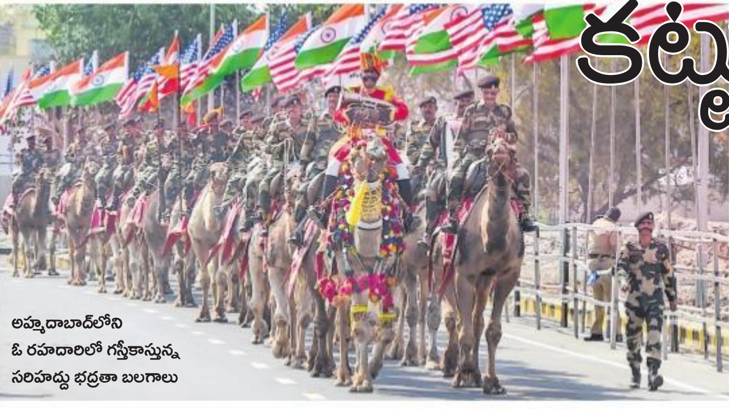
అహ్మదాబాద్లోని ఓ రహదారిలో గస్తీకాస్తున్న సరిహద్దు భద్రతా బలగాలు

అమెరికా అధ్యక్షుడితోపాటు ఆయన కుటుంబం రక్షణ బాధ్యతలను చూసుకునే బాధ్యత అమెరికా సీక్రెట్ సర్వీస్ ఏజెన్సీదే. ప్రధమ పౌరుడి రక్షణకు సంబంధించిన ప్రతి విషయాన్ని ఈ విభాగమే పర్యవేక్షిస్తుంది. అధ్యక్షుడు ప్రయాణించే మార్గాన్ని శుభ్రంగా ఉంచుకోవడం అనుకోని ఆపద ఎదురైతే తప్పించుకునే మార్గాలు, ప్రణాళికలు సిద్ధంగా ఉంచుతుంది. ప్రమాదం సంభవించినప్పుడు అవసరమైన రక్షణను కూడా సిద్ధంగా ఉంచుతుంది. అధ్యక్షుడిని ఎల్లప్పుడూ అనుసరించి ఉండే వారికి ఈ విభాగం రక్షణ కల్పిస్తుంది. అధ్యక్షునితో పాటు ఎల్లప్పుడూ ఉండేవారిలో 20 కిలోల బరువంటే జీవో హాబిట్లన్న నల్లటి డ్రెస్ లో కూడా ఒకటి. ఇందులో అమెరికా అణు క్షిపణుల రహస్య కోడ్ భద్రపరిచి ఉంటుంది. అధ్యక్షుడు విశ్రాంతి తీసుకునే గది వరకు సీక్రెట్ సర్వీస్ ఏజెంట్ల అనుసరిస్తూనే ఉంటారు. చట్టం ప్రకారం.. తనను ఒంటరిగా వదిలి వేయాలని అధ్యక్షుడు సైకిల్ ఆ అధికారిని ఆడినప్పుడు.. 1865లో ఏర్పాటైన ఈ విభాగంలో 1901 నుండి అధ్యక్షుడి రక్షణగా నిలుస్తోంది. సుమారు 7 వేల మందితో కూడిన ఈ విభాగంలో 25% మహిళ లుంటారు. ప్రపంచంలోని ఏ దేశ సైన్యం కంటే కూడా అత్యంత కఠినమైన శిక్షణ వీరికి ఉన్నాయి. సీక్రెట్ సర్వీస్ కోసం అందిన ప్రతి 100 దరఖాస్తుల్లో ఒకటి కంటే తక్కువగానే ఎంపిక ప్రకటించారు.. అధ్యక్షుడి కోసం ప్రాణాల్పనా అర్పిస్తామంటూ హాబిట్లలో సినిమాల్లో చూపేస్తున్న విధంగా ప్రమాణం చేయటం!