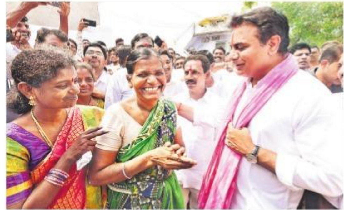
పట్టణప్రగతి కార్యక్రమం సందర్భంగా మంగళవారం నల్లగొండ జిల్లా దేవరకొండ 10వ వార్డులో మహిళలను అవ్వాయంగా పలుకరిస్తున్న మంత్రి కేటీఆర్. చిత్రంలో ఎమ్మెల్యే రవీంద్రకుమార్