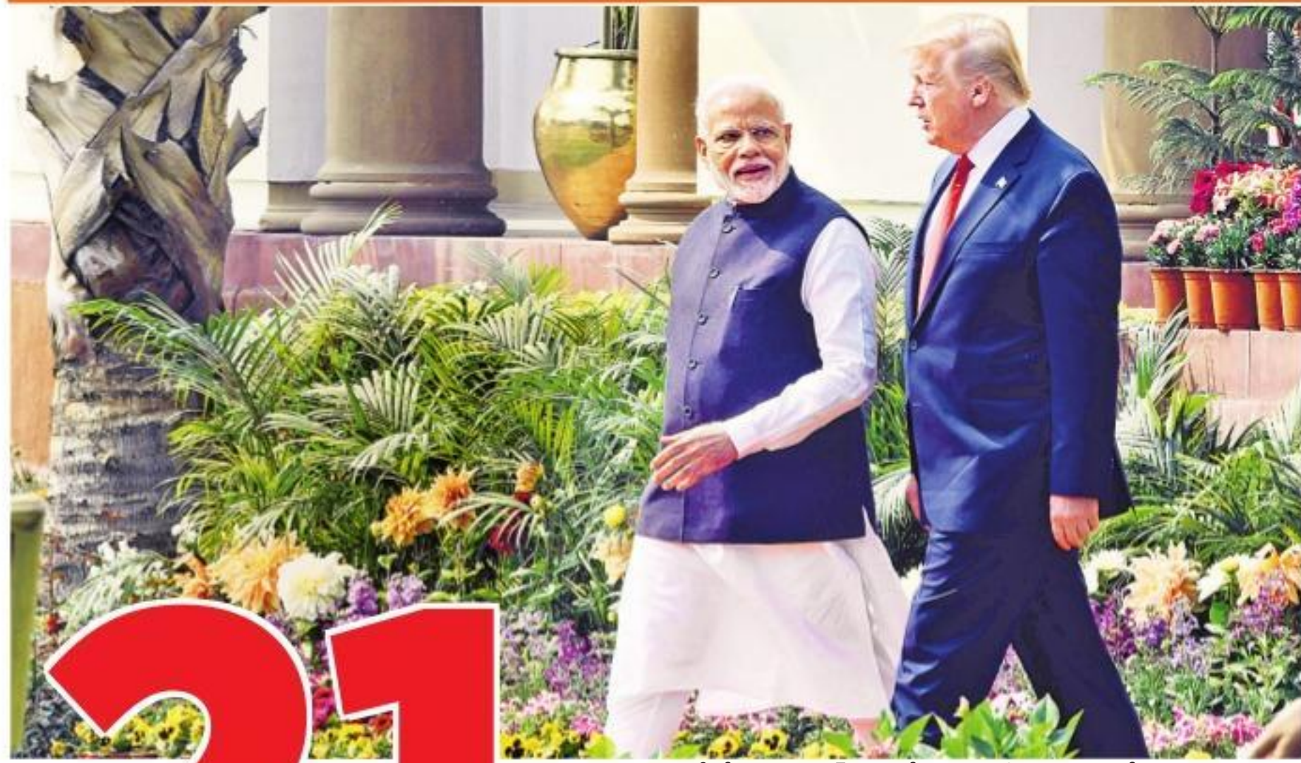
మంగళవారం ఢిల్లీలోని హైదరాబాద్ హోటల్లో సంయుక్త మీడియా సమావేశం అనంతరం అమెరికా అధ్యక్షుడు ట్రంప్ భ్రాతృమోద్రా మోదీ

భారత్లో సమగ్ర వాణిజ్య ఒప్పందంపై రెండు దేశాల ప్రతినిధుల బృందం పురోగతి సాధిస్తున్నది. ఇరు దేశాలకు సమ ప్రాధాన్యం ఉండేలా త్వరలో మంచి ఒప్పందం కుదురుతుంది. అమెరికా ఉత్పత్తులపై భారత్ అధిక సుంకాలను విధిస్తున్నది. ఈ విషయంలో భారత్ పునరాలోచించాలి. భారత్-అమెరికా మధ్య గతంలోకన్నా ఇప్పుడు దృఢమైన బంధం ఉన్నది. ఇరు దేశాల మధ్య అద్భుతమైన ఒప్పందాలు కుదిరాయి.