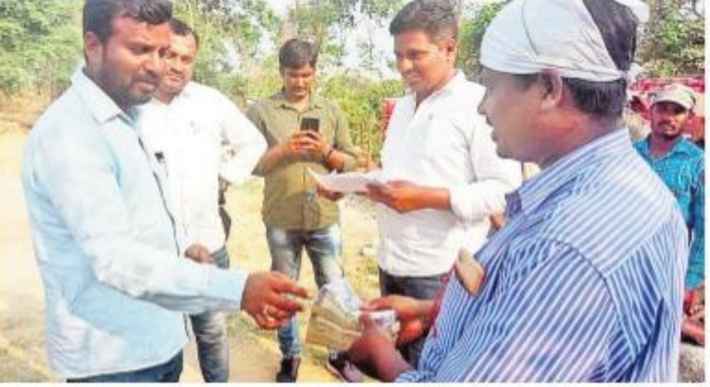
ముంపు బాధితులకు ఆర్థిక సాయాన్ని అందజేస్తున్న డాన్ లిల్లార్ రాజరెడ్డి

లోకి వీటిని తరలించేందుకు అధికారులు క్షేత్రస్థాయిలో అన్ని ఏర్పాట్లుచేస్తున్నారు. అందులో భాగంగా ముంపు బాధితులకు ఇండ్లను ఖాళీచేయాలని విజ్ఞప్తిచేశారు. ఇదే విషయమై ఎమ్మెల్యే రేసముయ్య, ఆర్టీవో శ్రీనివాసరావు వారితో చర్చలు జరుపడం, అవి సఫలం కావడం తెలిసింది. ప్రస్తుతం ముంపునకు గురవుతున్న 118 ఇండ్లను ఖాళీచేసేందుకు బాధితులు సమ్మతించారు. మంగళవారం 40 కుటుంబాలు తమ ఇండ్లను ఖాళీచేశాయి. గురువారం సాయంత్రంలోగా అందరూ ఖాళీచేసేందుకు సిద్ధంగా ఉన్నారు. ఆరేండ్లలో కాలనీల్ ఇంకా పలువురికి కేటాయింబిన ఇండ్ల పూర్తికాకపోవడంతో వారికి ఒక్కో కుటుంబానికి ప్రభుత్వం తరఫున అధికారులు రూ.50 వేలు ఆర్థికసాయాన్ని అందజేశారు. నివాసాలు పూర్తయ్యే వరకూ ఆ మొత్తాన్ని ఆర్థిక