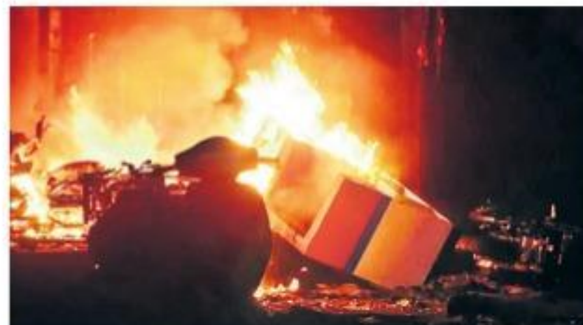
మంగళవారం న్యూఢిల్లీలోని చాంద్ బాగ్ లో తగులబడుతున్న దుకాణం