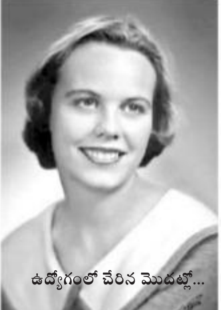
ఉద్యోగంలో చేరిన మొదట్లో...