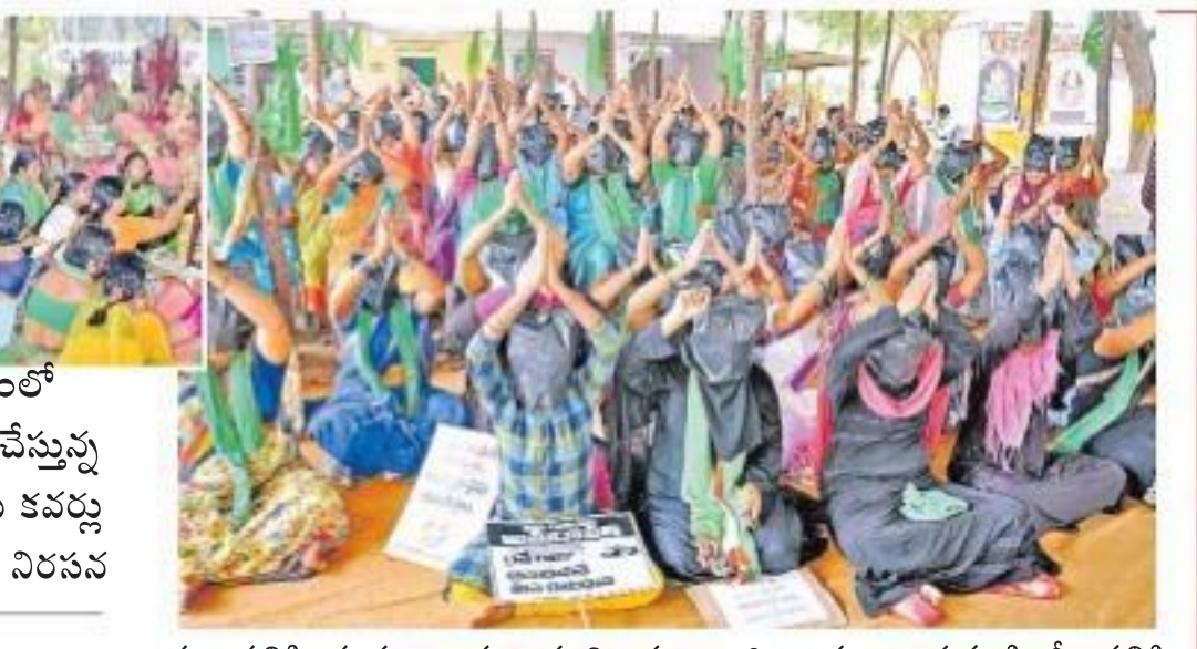
వెలగపూడి దీక్షా శిబిరంలో సాయుధానికి పూజల చేస్తున్న మహిళలు, ముఖాలకు కవర్లు కప్పుకొని తుళ్లూరులో నిరసన

ముఖానికి నల్ల కవర్లతో మహిళల నిరసన 72వ రోజు కొనసాగిన రైతుల ఆందోళనలు గుంటూరు, పిల్లవారి 27(ఆంధ్రజ్యోతి): పోలీసు వ్యాపార ఎటువంటి కార్యకర్తలను అరెస్టు చేయడానికి కృషిచేస్తున్నారని అన్నారు. లాఠీ దెబ్బలు తిన్నాం. ఒక్కొక్క రోజు రెండు, మూడో కేసులు వస్తున్నాయి. భూములు ఇచ్చి న్యాయమండలంపై మేం చేస్తున్న నేరం. అక్రమ ఆస్తుల లో ఉద్దేశాన్ని ఆపలేరు. అమరావతి ఏకైక రాజధానిగా ప్రభుత్వం నుంచి స్వచ్ఛమైన ప్రకటన వచ్చేవరకు ఉద్దేశం ఆగదు' అని అమరావతి గ్రామాల రైతుల అసోసియేషన్ వెలుతున్నాయి. మూడు రాజధానుల నిర్ణయాన్ని వ్యతిరేకిస్తూ రైతులు చేపట్టిన ఆందోళనలు గురువారం 72వ రోజుకు చేరాయి. తుళ్లూరు, మండలంలో మహారాష్ట్రాలు కొనసాగింపారు. వెలగపూడి, రామపూడి, కృష్ణానగరం, యర్రబాచి, గుంటూరు కలెక్టరేట్ ఎదుట, తాడికొండ అడ్రోల్స్, పెదపరిమి తదితర ప్రాంతాల్లో రిలే నిరాహార దీక్షలు, నిరసన ప్రదర్శనలు కొనసాగింపారు. 'మా ముఖాలు చూడటం ఇష్టం లేదన్నట్లుగా ఎమ్మెల్యేలు, మంత్రులు వ్యవహరిస్తున్నారు. చేతులు జోడించి అడుగుతున్నాం. మా మొర అలరించడం అంటూ రాయపూడికి చెందిన రైతులు, మహిళలు ముఖానికి నల్ల కార్డులు తొడుక్కొని నిరసన తెలిపారు. ఎంపీ నందిగం సురేశ్ ఎస్సీ, ఎస్టీ చట్టాన్ని దుర్వినియోగం చేస్తున్నారని మందలం శిబిరంలో దళిత మహిళలు ఆవేదన వ్యక్తం చేశారు. ఒకరోజు తరగతి చదువుతున్న పదానీ నవీన్ తుళ్లూరు దర్గా శిబిరంలో 12గంటల నిరాహార దీక్ష చేశారు. రాజధాని కోసం దర్గాలు, డిక్షలు చేస్తున్న రైతులు, మహిళలకు మద్దతుగా రాష్ట్ర బీజేపీ అధ్యక్షుడు కన్నా లక్ష్మీనారాయణ నేతృత్వంలో మార్చి 1న మందలంలో సమీకావన సభ నిర్వహించనున్నట్లు ఆ