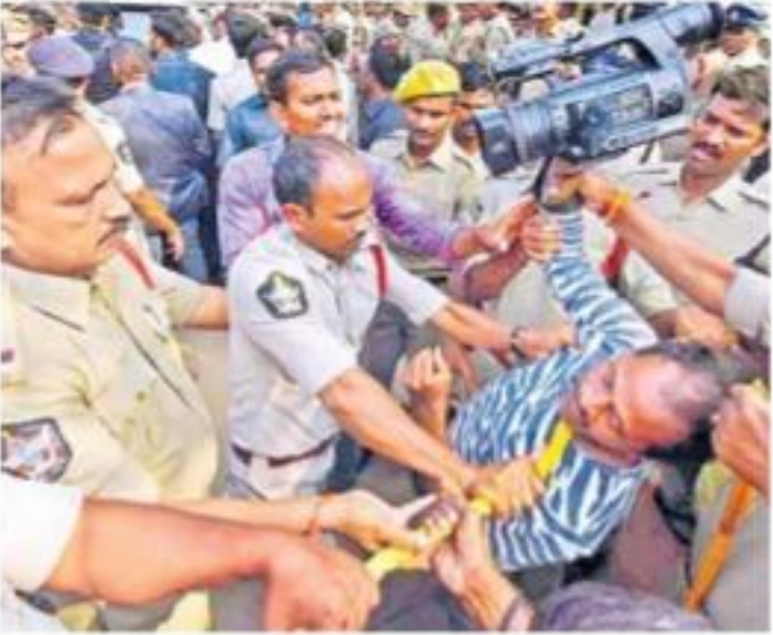
నాయుడి మెడను తాడుతో నొక్కుతున్న పోలీసులు