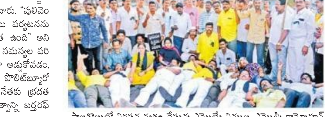
పాలకొల్లులో నిరసన వ్యక్తం చేస్తున్న ఎమ్మెల్యే నిమ్మల, ఎమ్మెల్యే రామ్మోహన్