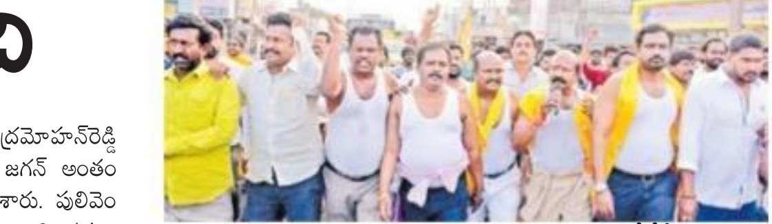
రాజమహేంద్రవరంలో అర్జీపేర్లు ప్రదర్శించే వైసీపీ నేతలు