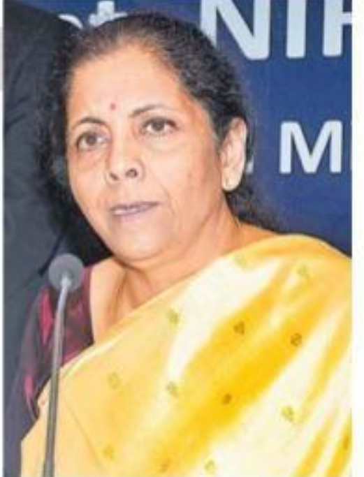
ప్రపంచ జీడిపీ 0.3% డౌన్

చైనాలోపాటు ప్రపంచ దేశాలను గడగడ లాడిస్తున్న కోవిడ్-19 వైరస్ భారత ఆర్థిక వనరులద్రవణకు అడ్డంకిగా మారవచ్చని డన్ అండ్ బ్రాడ్స్ట్రీట్ హెచ్చరించింది. చైనా దిగుమతి అలాంటి అడ్డంకిగా మారవచ్చని సరఫరా అధికారులు ఎదుర్కొన్నారని రావచ్చని, ఈ పరిణామంతో వస్తు ధరలు ఎగబాకవచ్చని అంటుంది. వైరస్ ను అదుపులోకి తెవడం జాప్యమై, చైనా నుంచి సరఫరా మళ్లీ సాధారణ స్థితికి చేరుకోని వకలో భారత తయారీ రంగానికి చెందిన చాలా కంపెనీల్లో ఉత్పత్తి నిలిచిపోవచ్చని తాజా సమావేశంలో సీతారామన్ తెలిపారు.