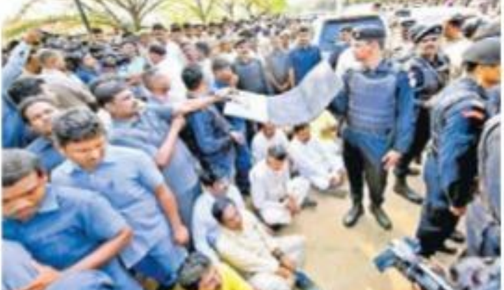
చంద్రబాబుకు రక్షణగా బుల్డోజ్ పూస్ ఛాకిట్ ను ఉంచిన భద్రతా సిబ్బంది

విశాఖపట్నం, ఫిబ్రవరి 27(ఆంధ్రజ్యోతి): ‘ఏం చేస్తారయ్యా మీరు? చంపేస్తారా? అయితే మాట్ చేయండి...ఎన్ కౌంటర్ చేయండి... అంటూ పోలీసుల తీరుపై టీడీపీ అధినేత చంద్రబాబు తీవ్ర ఆక్షేపం వ్యక్తం చేశారు. గురువారం విశాఖ విమానాశ్రయం వద్ద వైసీపీ శ్రేణుల అడ్డంకితో సుమారు నాలుగు గంటల పాటు వాహనంలో కూర్చున్న ఆయన.. మధ్యాహ్నం మూడు గంటలకు కిందికి దిగి పార్టీ నేతలతో కలిసి రోడ్డుపై బైరాయించారు. ఆయన్ను లేచి వెనక్కి పంపి ఉద్దేశంతో పోలీసులు ముట్టుకున్నారు. వారి తీరుపై చంద్రబాబు తీవ్ర ఆగ్రహం వ్యక్తం చేశారు. ఈ సమయంలో సహనం సరిపెట్టిన ఆయన ‘చంపేస్తారా... మాట్ చేయండి’ అంటూ పోలీసులపై ధ్వజమెత్తారు. గురువారం ఆయన విశాఖ విమానాశ్రయం వెలుపల, ప్రాంగణంలో వివిధ సందర్భాల్లో విలేజరులతో మాట్లాడారు. ముందున్న అనుమతి తీసుకుని విశాఖపట్నం పర్యటనకు వచ్చే.. వైసీపీ శ్రేణుల అడ్డుకోవడంపై మండిపడ్డారు. పోలీసులు తనకు సరైన రక్షణ కల్పించలేకపోయారన్నారు. ఆవగంబు ఆగితే కాన్వాయ్ వెళ్లడానికి క్షయించే సైన్యమని