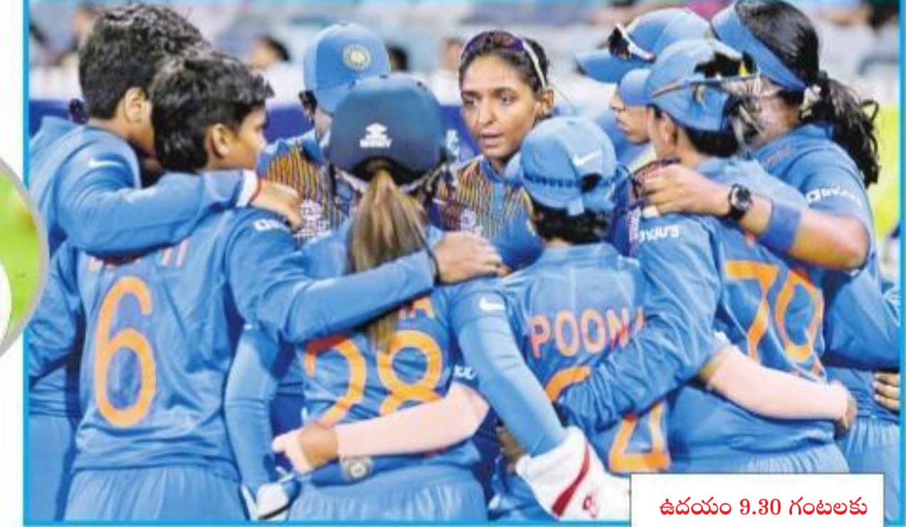
ఉదయం 9.30 గంటలకు మొదలయ్యే మ్యాచ్ ను స్టాఫ్ సెక్యూరిటీ-2 చానెల్ ప్రత్యక్ష ప్రసారం చేస్తుంది.