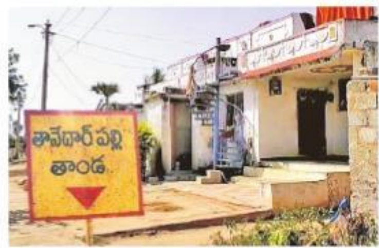
ముంపు బాధితులు ఆర్ఆండ్ఆర్ కాలనీకి తరలిపోవడంతో నిర్మాణమధ్యంగా తానేదారపల్లి తండా