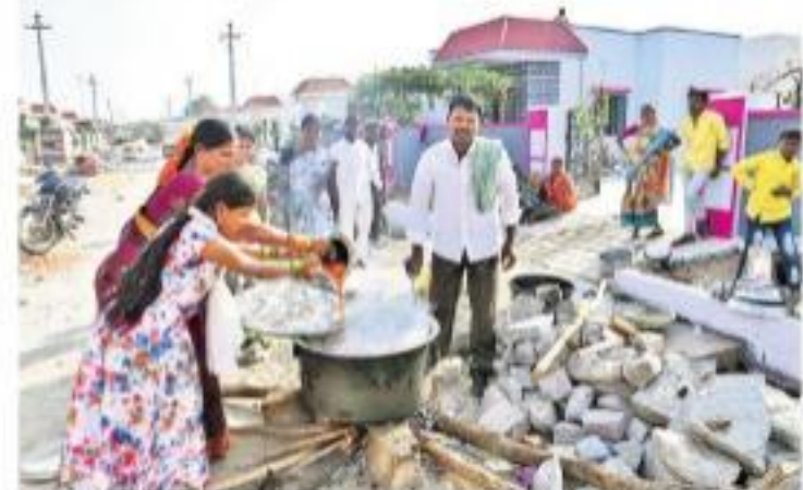
కొత్తగా నిర్మించిన ఆర్ఆండ్ఆర్ కాలనీలో గృహప్రవేశం సందర్భంగా వంటచేసుకుంటున్న కుటుంబం