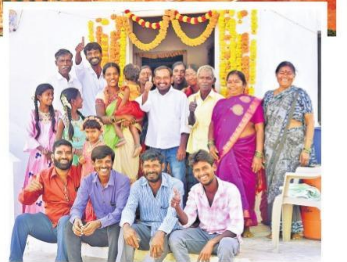
శుక్రవారం సిద్దిపేట జిల్లా ములుగు మండలం తునికిబొల్లారంలోని ఆర్ఆండ్ఆర్ కాలనీలో సామూహిక గృహప్రవేశాల అనంతరం ఆనందం వ్యక్తంచేస్తున్న కొండపోచమ్మ రిజర్వాయర్ నిర్మాణ కుటుంబం