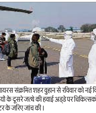
चीन के कोरोना वायरस संक्रमित शहर वुहान से रविवार को नई दिल्ली पहुंचे 323 भारतीयों के दूसरे जत्थे की हवाई अड्डे पर चिकित्सकों ने इन्फरेंड थर्मामीटर के जरिए जांच की।

केरल के स्वास्थ्य मंत्री केके शैलजा ने बताया कि वुहान से लौटे एक छात्र की जांच रिपोर्ट पॉजिटिव आई है। पुणे स्थित भारतीय विज्ञान संस्थान (एनआइवी) ने टेलीफोन पर यह जानकारी दी। हालांकि, अभी जांच रिपोर्ट का इंतजार है। लेकिन दूसरे मामले की संभावना जताई गई है, इसलिए सरकार पूरी सतर्कता बरत रही है। 24 जनवरी को लौटे छात्र को अल्पप्पा के मेडिकल कॉलेज अस्पताल के आइसोलेशन