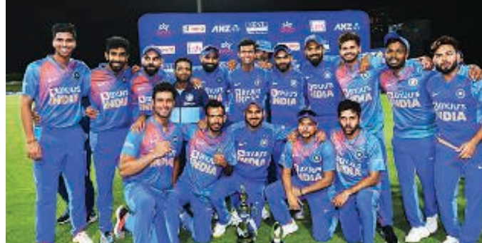
न्यूजीलैंड को टी-20 में सीरीज में हाराने के बाद ट्राफी के साथ भारतीय टीम।

थी, तब उसने भारत का 5-0 से वनडे सीरीज में सूपड़ा साफ किया था। टीक वेसा ही भारतीय टीम ने 2019 विश्व कप सेमीफाइनल हारने के बाद न्यूजीलैंड के साथ किया