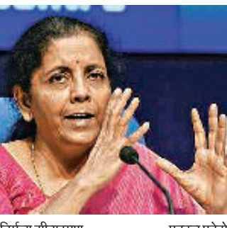
निर्मला सीतारमण फाइल फोटो

होगा। सरकार की मंशा ऐसी व्यवस्था भी करने की है जिससे आयकर नियम उल्लंघन के सामान्य मामलों में करदाताओं को व्यक्तिगत तौर पर उपस्थित नहीं होना पड़े। वित्त मंत्री के स्तर पर पहली बार यह स्वीकार किया गया है कि आयकर विभाग के अधिकारी अपने स्तर पर करदाताओं का उत्पीड़न कर रहे हैं। हाल के महीनों में कई बड़े उद्योगियों ने भी परोक्ष या प्रत्यक्ष तौर पर ऐसी शिकायत की है। वित्त मंत्री ने कहा कि स्थिति को सुधारने के लिए वह लगतार कोशिश करती रही हैं। पिछले दिनों आयकर नोटिस में डॉक्यूमेंट नोटिफिकेशन नंबर (डीआइएन) जारी करने के आदेश के पीछे उद्देश्य यही था। सीतारमण ने कहा, 'अगर किसी आयकर दाता को ऐसा नोटिस मिला है जिसमें डीआइएन नहीं है तो मैं उसे कह रही हूँ कि वह उसे रद्दी के टोकरी में फेंक दे। आयकर अधिकारी पुछें तो साफ बता दें कि डीआइएन नहीं था इसलिए रद्दी में फेंक दिया है।' वित्त मंत्री के मुताबिक, पीएम की भी यही भावना है कि सामान्य करदाता जिस सम्मान