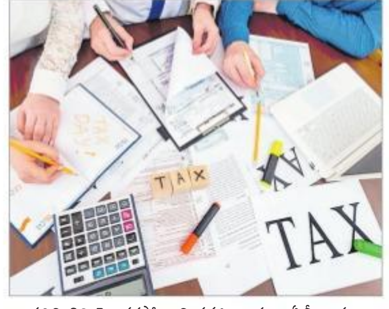
● పరిమితిని పెంచుకోగా మినహాయంపులు ఏమీ ఇవ్వం అంటుండటం మరో విషయం.

విశేషాలోకి వెళితే.. ● కొత్త క్లాసులు, రేట్లు ఇచ్చినా.. ● ఇది ఉద్యోగిగలవలసి, వ్యాపారస్తులకు అందరికీ వర్తిస్తుంది. ● అన్ని వర్గాల వారికి అందుబాటులో ఉన్న వంద మినహాయంపై 70 వాటికి మంగళం పాడారు. ● ఒక గొడవ పెట్టు లాంటి సెక్యూరైజేషన్ ప్రతిపాదించి ముఖ్యమైన లీమ్ ట్రావెల్ అండ్ సెర్వీస్, స్టాండ్ డిజైన్, పుత్తి పన్ను, సెల్ అక్యూమింట్ ఇంటి రుణంపై వడ్డీ, ఫ్యామిలీ పెన్షన్, 80కే కింద లభ్యమయ్యే మినహాయంపులను ఎత్తివేసే ప్రయత్నం చేశారు. ● ఎందరో ఆర్థిక వేత్తలు సాపేక్షంగా మేరకు సెక్యూరిటీ 80 మినహాయంపుల పరిమితిని పెంచుతారన్న సామాన్యత చిన్న చిన్న ఆశలను చిన్నాల్సిన్నం చేశారు. దీనితో వ్యక్తిగత పన్నులకు సంబంధించి వారు నిరాశకు గురయ్యారు.