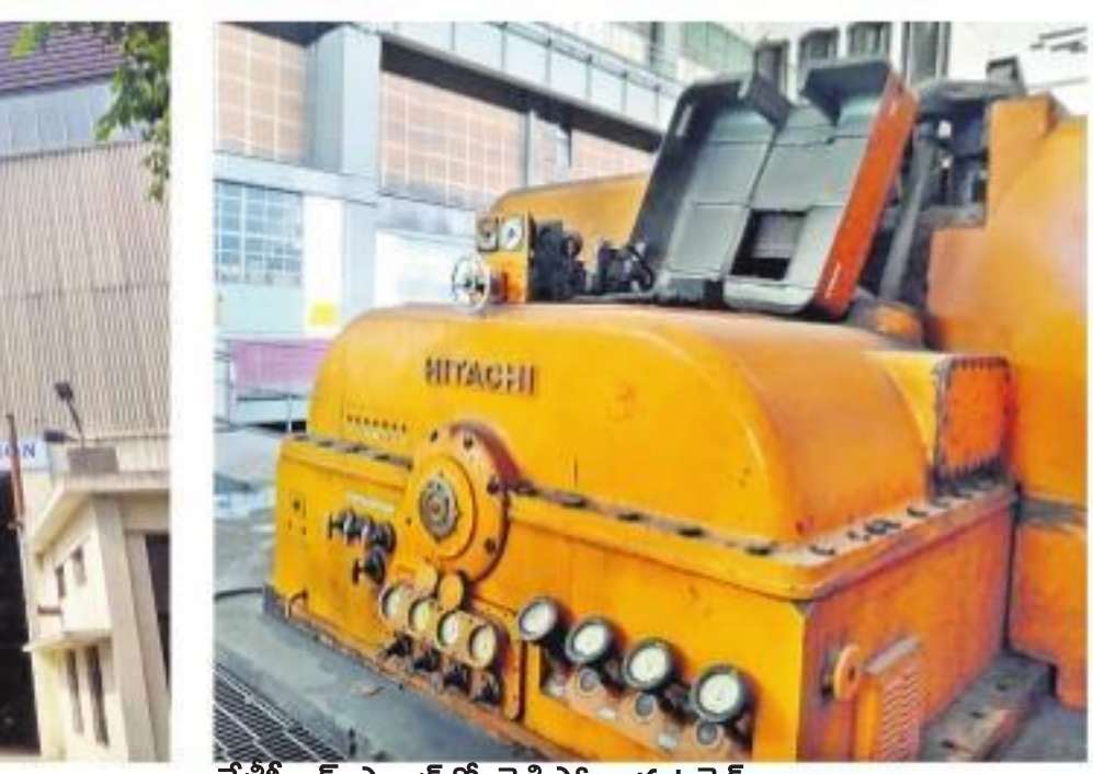
కేటీపీఎస్ ప్లాంట్లో చెడిపోయిన బర్నెస్

వాట్ల ఉత్పత్తిని ప్రారంభించారు. వాటి నుంచి 2020 ఫిబ్రవరి 2వ తేదీ వరకు 53 సంవత్సరాల 2 నెలల పాటు నిరంతరాయంగా ఈ యూనిట్ ఉత్పత్తిని సాధించడం గమనార్వం. ఇప్పటికే 3, 6, 8 యూనిట్లతో కేటీపీఎస్ ఏ, టీ, టీ స్టేషన్లలో కలిపి మొత్తం 8 యూనిట్ల ద్వారా 720 మెగావాట్ల విద్యుత్ ఉత్పత్తి జరుగుతోంది. ఇందులో ఈఎస్సీఎం యంత్రంలో సమస్య కారణంగా తీవ్ర కాలుష్యూస్ వేదజల్లుతున్న 60 మెగావాట్ల 3వ యూనిట్ను 2017 మే 20న మూసివేశారు. 120 మెగావాట్ల సామర్థ్యం గల 6వ యూనిట్ను 2019 జనవరి 3న, మరో 120 మెగావాట్ల ఉత్పత్తి