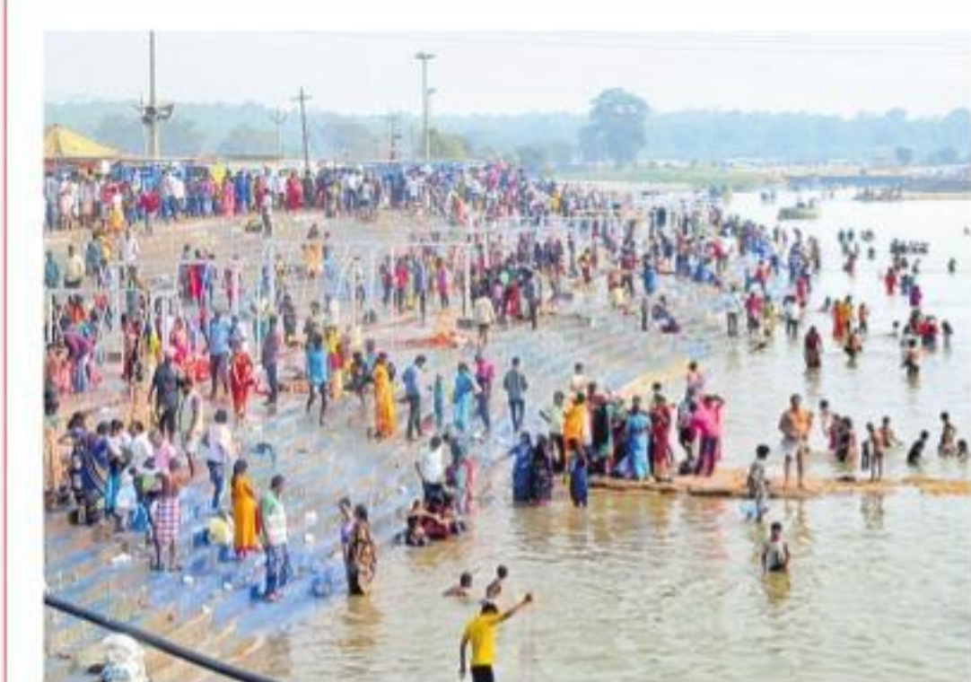
మేడారం వద్ద జంపన్నవారులో స్నానాలు చేస్తున్న భక్తులు