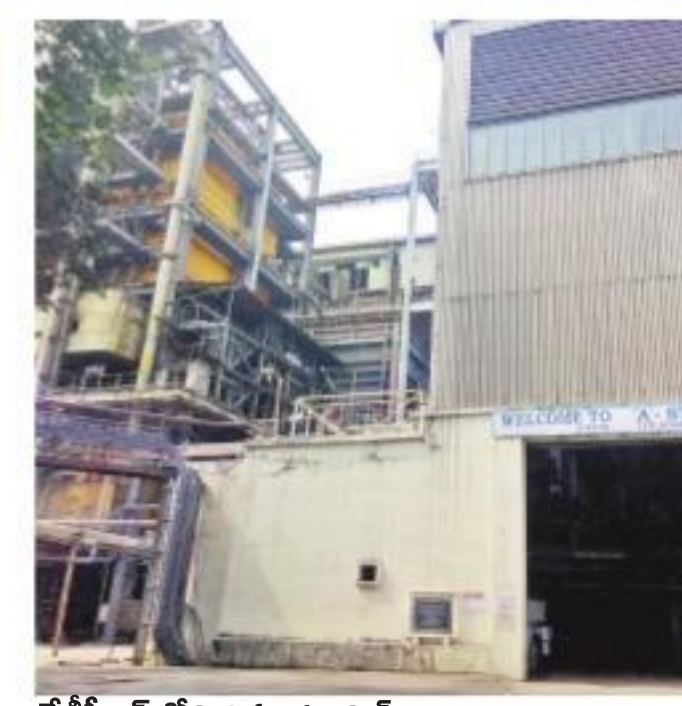
కేటీపీఎస్లోని 2వ యూనిట్

పాలవం: మూసివేయబడిన కేటీపీఎస్ ఓ.అండ్ఎం కర్మాగారాన్ని మార్చి 31 వరకు నడిపించాలని నిర్ణయం తీసుకున్నారు. సాంకేతిక సమస్యలతో ముందస్తుగా.. కాలం చెల్లిన ఓ.అండ్ఎం కర్మాగారాన్ని మూసివేయాలి ఉండడంతో జెన్కో యాజమాన్యం ముందస్తుగా స్పెర్ట్ పార్ట్స్ (మరమ్మత్తులకు అవసరమైన విడి భాగాలు) తెప్పించడాన్ని నిలిపివేస్తూ టీఎం జెన్కో యాజమాన్యం ఆదివారం నిర్ణయం తీసుకుంది. పర్యావరణ అనుకులకు దృష్ట్యా మార్చి 31 తర్వాత ఫైవల్ మొత్తం మూసివేయాలి ఉండగా సాంకేతిక కారణాల నేపథ్యంలో రెండు నెలల ముందే 2వ యూనిట్ను మూసివేశారు. జెన్కో టెక్నాలజీతో 1986లో ప్రాంజెక్షన్లను అభివృద్ధి చేసింది జెన్కో యాజమాన్యం. సాంకేతిక సమస్యలతో సాంకేతిక సమస్య ఏర్పడింది. దీంతో వచ్చే మార్చి 31 వరకు దీనిని నడిపించాలని ముందు అనుకున్నప్పటికీ భారీ ఖర్చుతో మరమ్మత్తు చేయడం కంటే మూసివేయడమే మేలని అధికారులు ఈ నిర్ణయం తీసుకున్నారు. ఈ క్రమంలో బంకర్లలోని బోగ్స్ మొత్తం ఉపయోగించి ఆదివారం మధ్యాహ్నం 3 గంటల నుంచి ఉత్పత్తిని నిలిపేశారు. 53 సంవత్సరాల 2 నెలల పాటు నిరంతరాయంగా.. జెన్కో టెక్నాలజీతో 1986 జూలై 4న కేటీపీఎస్ 'బట్టెన్'లో సమస్య జటిలంగా మారడంతో తిరిగి ఉత్పత్తి ప్రారంభం కావడానికి మార్చి వరకు సమయం పట్టి అవశాం ఉంది. ఈ క్రమంలో గత డిసెంబర్ 31న