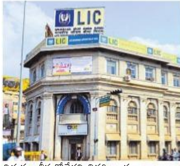
నిర్ణయం తీసుకోలేదని వివరించారు. 90,000 కోట్ల సమీకరణ!

న్యూఢిల్లీ: ఎల్ఎస్ఐ ఐపీడి(ఇసిఐఎల్) పబ్లిక్ ఆఫర్ ఈ ఏడాది అక్టోబర్ తర్వాత ఉండొచ్చని ఆర్థిక కార్యదర్శి రాజీవ్ కుమార్ పేర్కొన్నారు. ఎల్ఎస్ఐ సాఫ్ట్ మార్కెట్ లిస్టింగ్ చేయడానికి చాలా ప్రక్రియలు పూర్తి చేయాలి అంటూ, కొన్ని శాసనాత్మక మార్పులు కూడా అవసరమైనవి తెలిపారు.