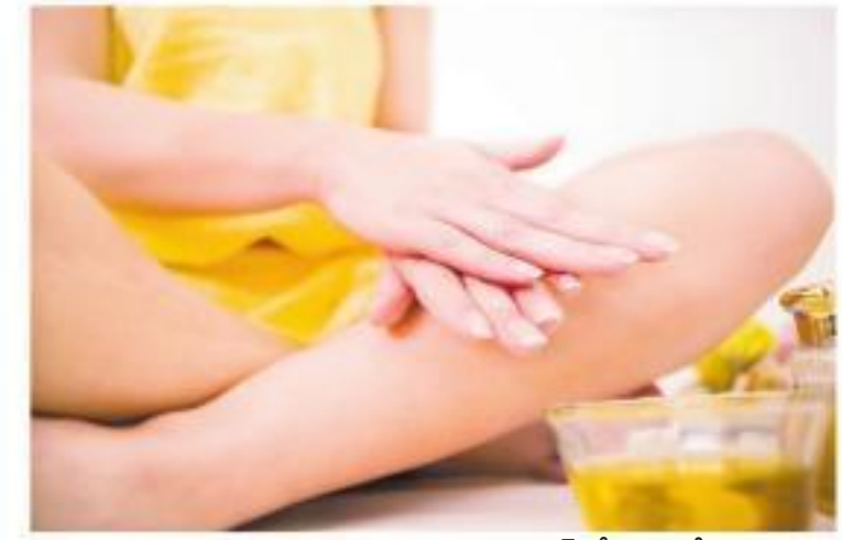
తుంది. ఈ ఆయిల్ దేహంలో గూడుకట్టుకుని పోయిన వ్యర్థాలను మూత్రం ద్వారా బయటకు పోయేలా చేస్తుంది.