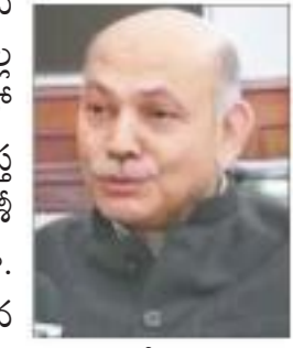
కొత్త ఖాతాలు ట్యాక్స్ పేయర్లకు ప్రయోజనకరమే: సీబీడీటీ చైర్మన్

న్యూఢిల్లీ: వివిధ ఆర్థిక అంశాల వాస్తవిక స్థితిగతులను ముదింపు చేసిన మీదట కేంద్ర బడ్జెట్లో ప్రత్యక్ష పన్ను వసూళ్ల లక్ష్యం దిగువనుకుండా రూ. 11.80 లక్షల కోట్లకు సవరించినట్లు సెంట్రల్ బోర్డ్ ఆఫ్ డైరెక్ట్ ట్యాక్స్(సీబీడీటీ) చైర్మన్ సీఎం వెల్లడించారు. 2019-20లో వ్యక్తిగత, కార్పొరేట్ ఆదాయ పన్ను మొదలైన ప్రత్యక్ష పన్నుల వసూళ్లు రూ. 13.85 లక్షల కోట్లకు ముందుగా నిర్దేశించబడ్డాయి. అయితే, భారీగా రీపండెంట్, కార్పొరేట్ ట్యాక్స్ వసూళ్లపై వల్ల గణనీయంగా రెవెన్యూలో కొరత పడింది.