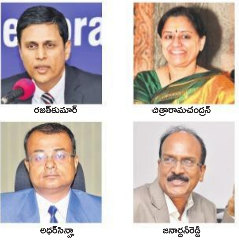
హైదరాబాద్, నమస్తే తెలంగాణ: