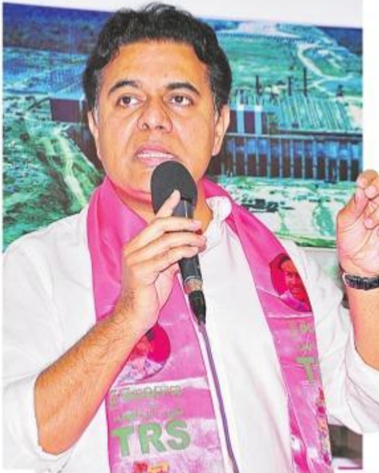
హైదరాబాద్, నమస్తే తెలంగాణ:

‘కేంద్రంలో ఆరేండ్ల పాలనలోని ఆరుబడ్డెట్లలో తెలంగాణకు చట్టప్రకారం, రాజ్యాంగం ప్రకారం రావాల్సిన దానికంటే అరపైసా అదనంగా ఇచ్చారా? అని బీజేపీ ప్రభుత్వాన్ని టీఆర్ఎస్ చర్చింగ్ ప్రసిడెంట్, ఐటీ, చరిత్రను లక్ష్యాలు మంత్రి శ్రీ తారకరామారావు ప్రశ్నించారు. రంగారెడ్డి జిల్లాలో ఏర్పాటుచేస్తున్న ప్రపంచంలోనే అతిపెద్ద ఫార్మాసిటీకి రూ.3-4వేల కోట్లు కావాలని ఆడిగితే, మూడు పైసలు కూడా ఇవ్వలేదని, హైదరాబాద్ నుంచి వరంగల్, నాగార్జున, బెంగళూరుకు మూడు పారిశ్రామిక కారిడార్ల ఏర్పాటుకు సాయపడిగితే మొండిచేయి చూపారని ధ్వజమెత్తారు. మిషన్ కేరళ, మిషన్ కాశీ యకు రూ. 24వేల కోట్లు ఇవ్వాలని కేంద్రప్రభుత్వమే ఏర్పాటుచేసిన నీతి ఆయోగ్ సిఫారసు చేస్తే, 24 పైసలైనా బీజేపీ ప్రభుత్వం ఇచ్చిందా? అని నిలదీ