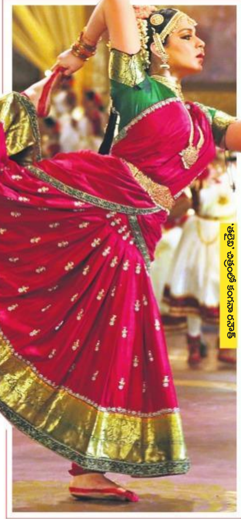
కృష్ణారాజు పాత్రలో శివ