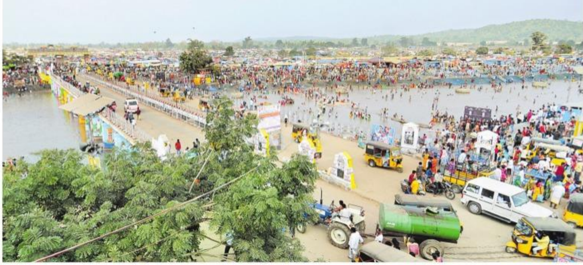
మంగళవారం ఉదయం మేడారంలోని జంపన్న వారు వద్ద పుణ్యస్నానాలు ఆచరిస్తున్న భక్తులు