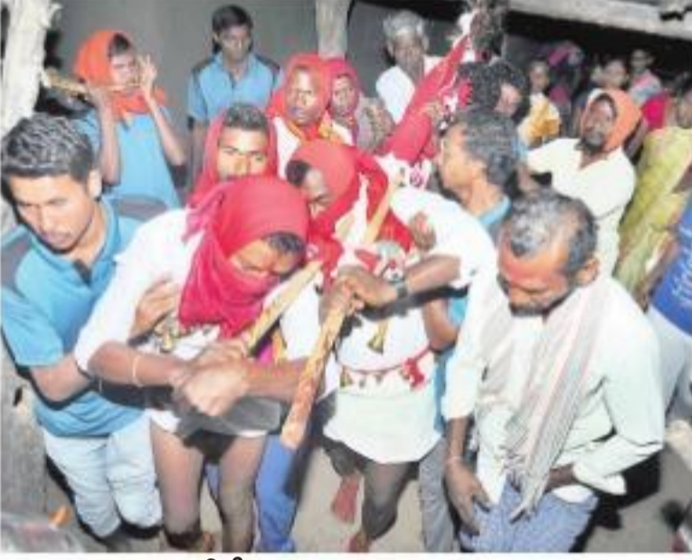
జంపన్నను గణ్డెలైకి తీసుకొస్తున్న పూజారులు