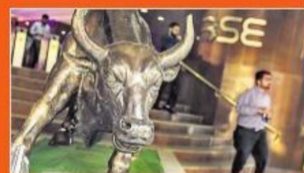
బుద్ధిజీవీ నష్టాలు భర్తీ.. 40వేల పొయింట్ల పైకి సెన్సెక్స్, నిఫ్టీ 272 పొయింట్లు అవ్.. -జజిఎస్లో