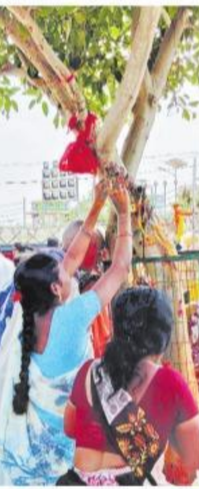
గణ్డెల వద్ద చెట్టుకు ఊయల కడుతున్న భక్తులు