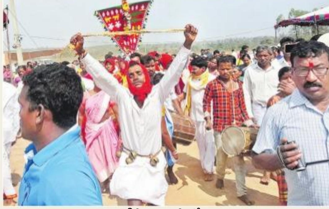
శివసత్తుల పూసకాల నడుమ పగిడిద్దరాజు పడిగెతో పూజారులు

దుల గుండా ఆలయానికి చేరుకున్నారు. ఆలయం వద్ద మేకపోతును బలిచ్చి పగిడిద్దరాజుకు నైవేద్యం సమర్పించారు. దేవాలయంలో ఉన్న పడిగెను తీసి దేవుని గుట్టనుంచి తీసుకువచ్చిన వెదురు కర్ర కట్టి పుణ్యం చేశారు. అనంతరం పడిగెతో దేవాలయం చుట్టూ ప్రదక్షిణలు చేశారు. గ్రామం దాటి వరకు ఆదివాసీ సంప్రదాయాల నడుమ, దోలు, డప్పులు వాయిద్యాలతో వైభవంగా ఊరేగింపు నిర్వహించారు. ఈ ఊరేగింపులో శివసత్తుల పూసకాలు, వద్దెలై రాణి నిర్వహించారు. పగిడిద్దరాజు పడిగె వస్తుండగా.. పూజారుల కాళ్ళ తడిమీ తరించేందుకు గ్రామ మహిళలు బిందెలతో నీళ్ళు అరబోశారు. పగిడిద్దరాజు వెళ్లితూ వున్న అధిక సంఖ్యలో భక్తులు కాలి నడకన బయలుదేరి వెళ్లారు. కాలినడకనే బయలుదేరిన పగిడిద్దరాజు పగిడిద్దరాజు పడిగెతో పూజారులు పూనుగొండ నుంచి ఆదివీ మార్గం గుండా 80 కిలోమీటర్ల దూరం కాలినడకనే సమీపంలోని లక్ష్మీపూరికి మంగళవారం రాత్రి చేరుకుంటారు. గ్రామంలోని పెనక