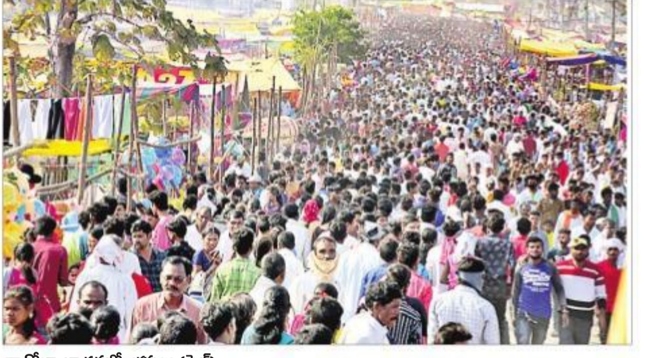
నాగోబా జాతరలో భక్తులు (ఫైల్)

దు కు ముగ్గురు అన్నదమ్ములు పగిడిద్దరాజు, పాణియ, బీరమయ్యులను దేవతలుగా కొలుస్తారు. ఈ జాతర ప్రధాన ప్రత్యేకం నాగోబా వాసీలకు ఇది ప్రధాన జాతర. మూడు రోజుల పాటు (ఇటీవలే జరిగింది) నిర్వహిస్తారు. నాగోబా జాతరను మెప్పించే వంశీయులు, గోండు ఆదివాసీలు జరుపుతారు. పుణ్యమాసంలో నెలవంక పండుగ సందర్భంగా గండిలో, పాం బోయికి ప్రభుత్వం నాగోబా జాతరను రాష్ట్ర ధింపిన వేడుక కావడంతో ఇది కనులపండుగా సాగుతుంది. నిర్వహిస్తారు. అక్కడ పెద్దలు చెబుతారు. హర్షిబిల్ జాతర తర్వాత జనవరిలో మణిపూర్లో డీసిన ఫణితి జాతరకు ప్రత్యేక గుర్తింపు ఉంది. సప్తాల్ ఆదివాసీల జనాభా ఎక్కువగా ఉన్న జాల్గొండ రాష్ట్రంలో సప్తాల్ జాతర జరుగుతుంది. ఈ జాతరలో భాగంగా ప్రత్యేకంగా పూజిస్తారు. ఇక్కడ ఉండే సారె అనే చెట్టుకు ప్రత్యేక పూజలు జరుపుతారు. ధర్మ మాతగా సీతాదేవి ఇక్కడ కొలుస్తారు. ప్రత్యేక వస్తులు ఇతర కష్టాల నుంచి తమను కాపాడుతారని ఇక్కడి గిరిజనుల విశ్వాసం.