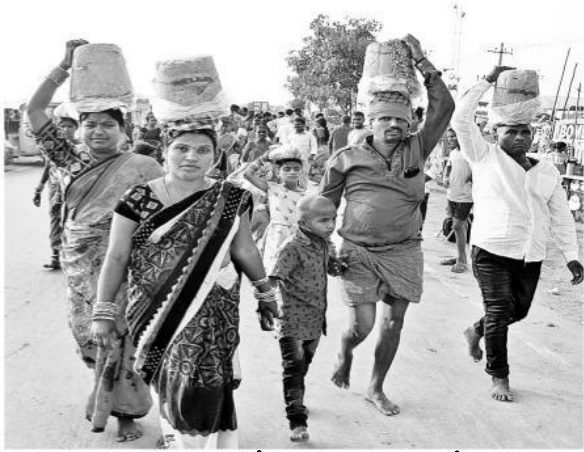
మొక్కలు చెల్లించుకునేందుకు నిలువెత్తు బంగారం(బెల్లం)తో సమ్మక్క-సారలమ్మ గద్దెల వద్దకు తరలివస్తున్న భక్తులు