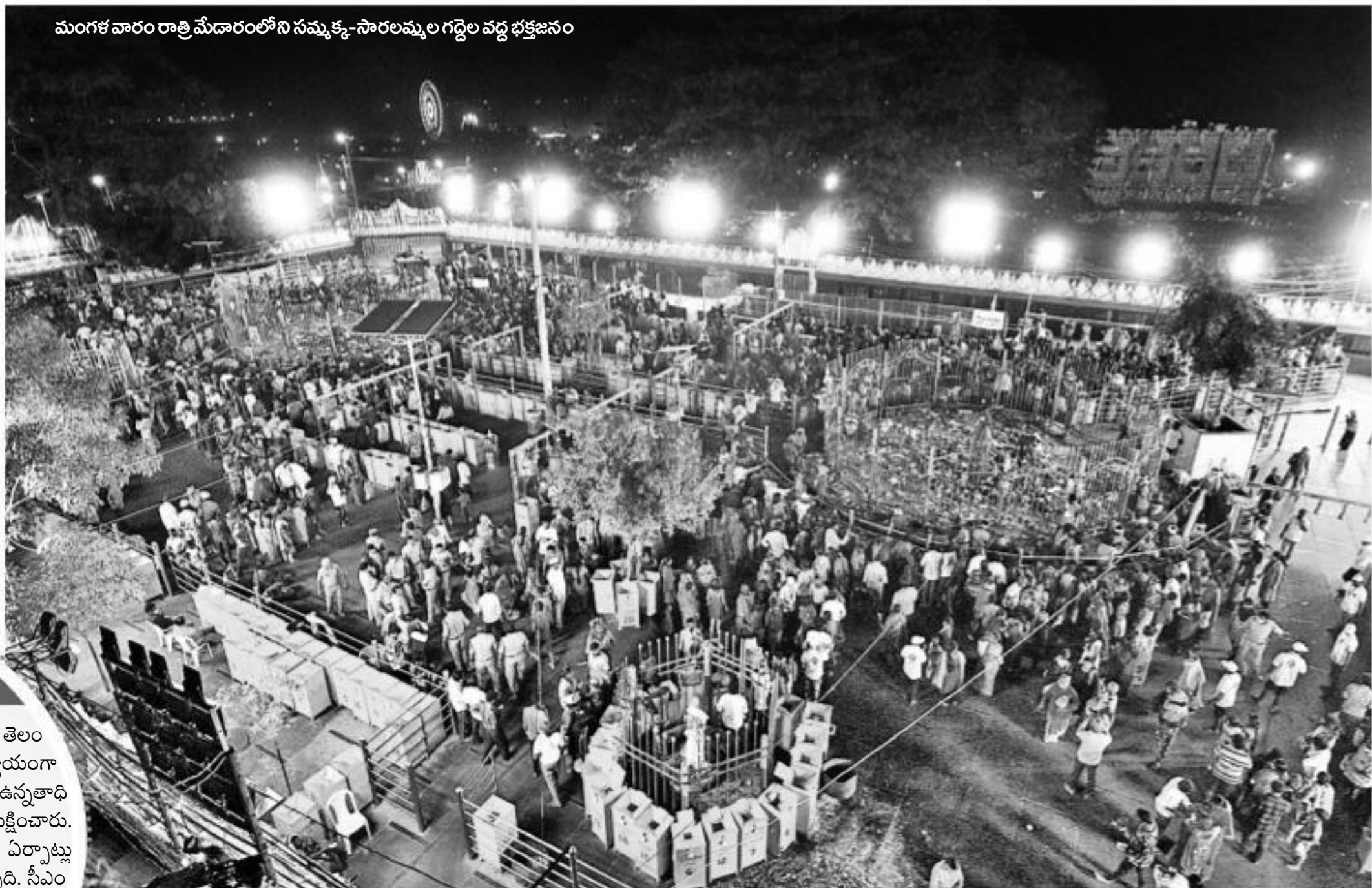
మంగళవారం రాత్రి మేడారంలోని సమ్మక్క-సారలమ్మల గద్దెల వద్ద భక్తజనం