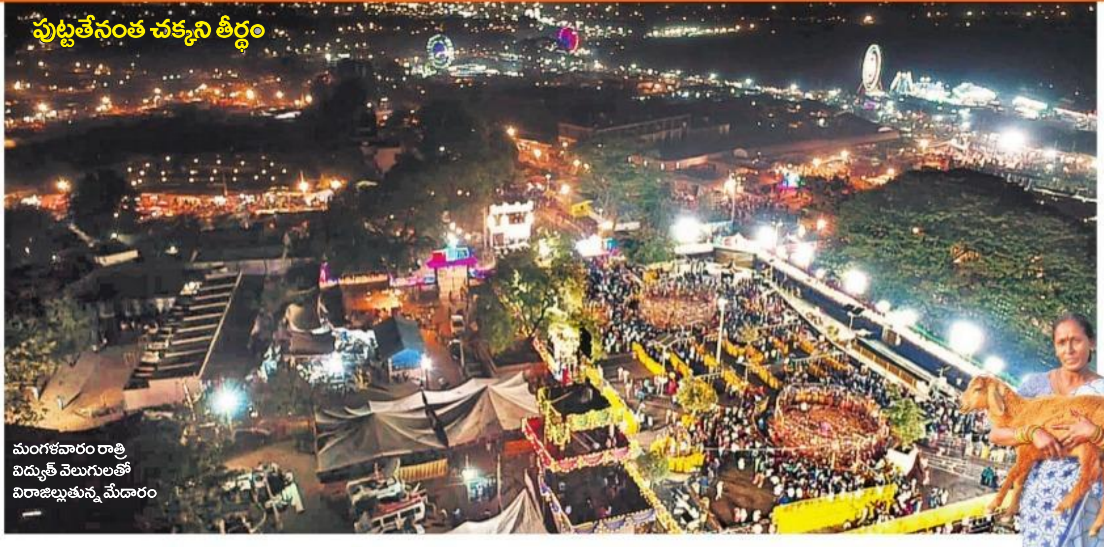
పుట్టతేనెంత చక్కని తీర్థం మంగళవారం రాత్రి విద్యుత్ వెలుగులతో విరాజిల్లుతున్న మేడారం