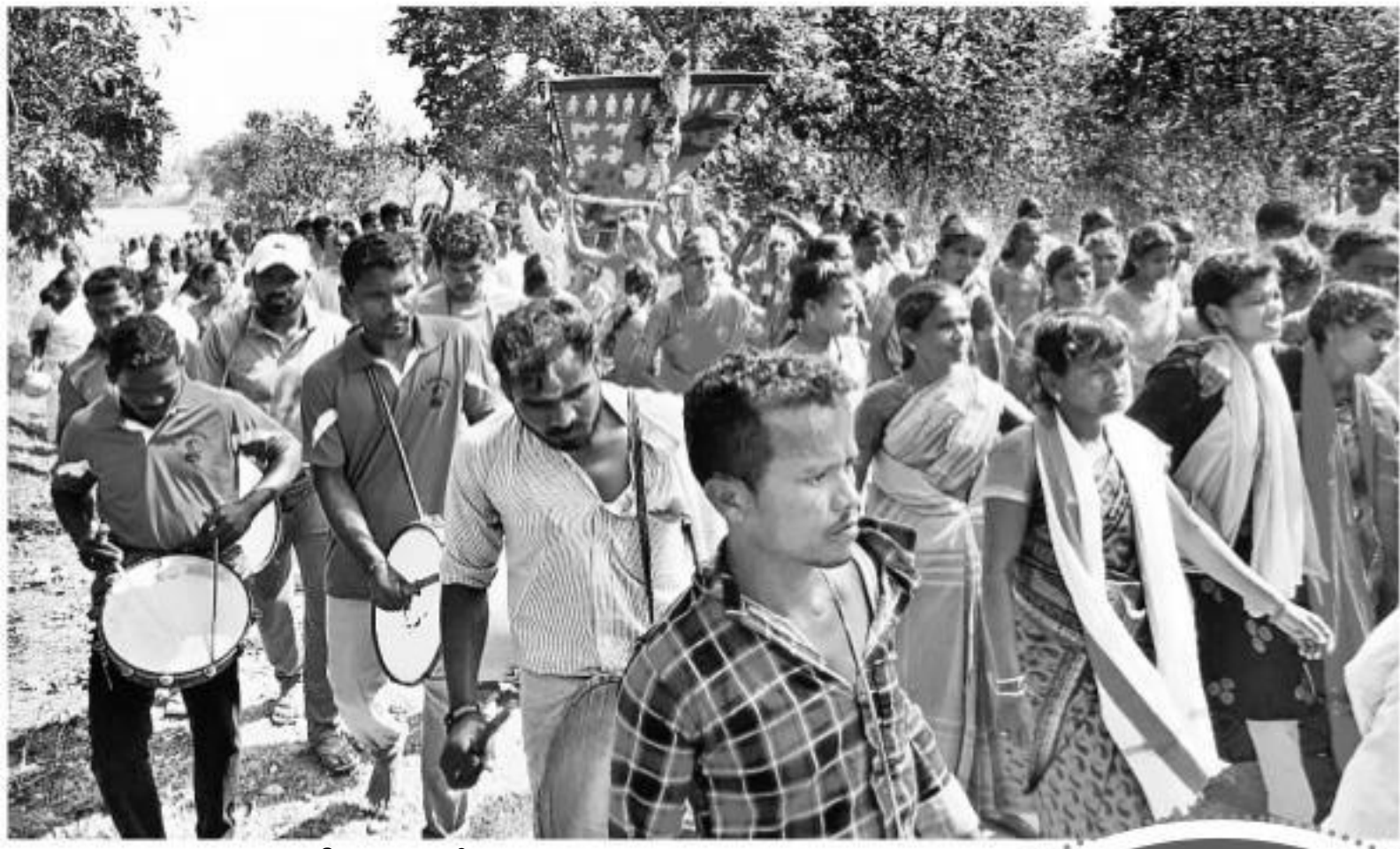
పూనుగొండ నుంచి పగిడిద్దరాజును తీసుకెళ్తున్న పూజారులు, భక్తులు