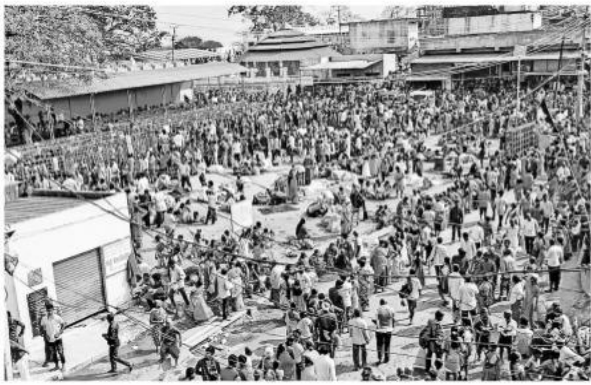
జగిత్యాల జిల్లాలోని కొండగట్టు ఆంజనేయ స్వామి ఆలయం మంగళవారం భక్తులతో కిటకిటలాడింది. వేకువజాము నుంచే భక్తులు ఆలయ పుష్కరిణిలో పూజాస్వామిని ఆచరించి స్వామివారి దర్శనం కోసం క్యూలైన్లో బారులు తీరారు. మేడారం జాతర దృష్ట్యా ఇక్కడ రద్దీ బాగా పెరిగింది. స్వామి వారిని దాదాపు 30 వేల మంది భక్తులు దర్శించుకోగా, ఆలయానికి రూ.5 లక్షలకుపైగా ఆదాయం సమకూరిందని ఈవో కృష్ణ ప్రసాద్ తెలిపారు. - మూలం