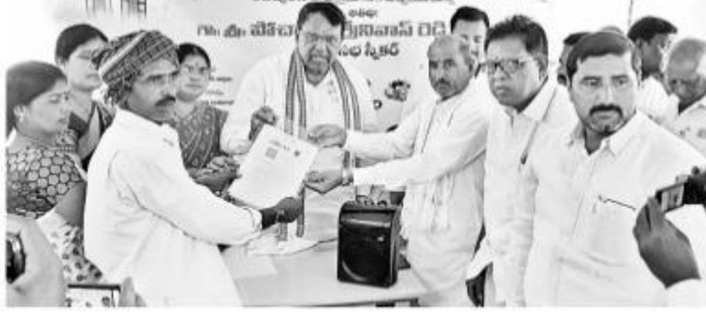
బాన్సువాడలో చిన్న రాంపూర్ రైతులకు పట్టాపాసిబుక్ పత్రాలను అందజేస్తున్న స్పీకర్ పోచారం