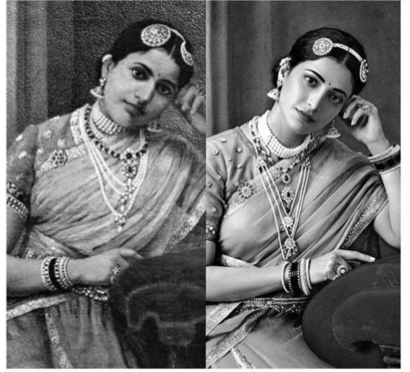
ప్రముఖ నటి సుహాసినీ మణిరత్నం స్టూడియోలలో 'నామ్' స్వచ్ఛంద సంస్థ క్యాంపెయిన్ ఫాటోలు ఇప్పుడు చాలామందిని ఆకట్టుకుంటున్నాయి. రవివర్మ చిత్రలేఖనాలను ప్రస్తుత సాత్ ఇండియా నటిమణులతో ఆ క్యాంపెయిన్ కోసం లెక్చియేషన్ ఫాటోగ్రాఫర్ చేశారు. ఆ ఫాటోలు తీసింది చెన్నైకి చెందిన ప్రముఖ ఫాటోగ్రాఫర్ 'వెంకట రామ్'.