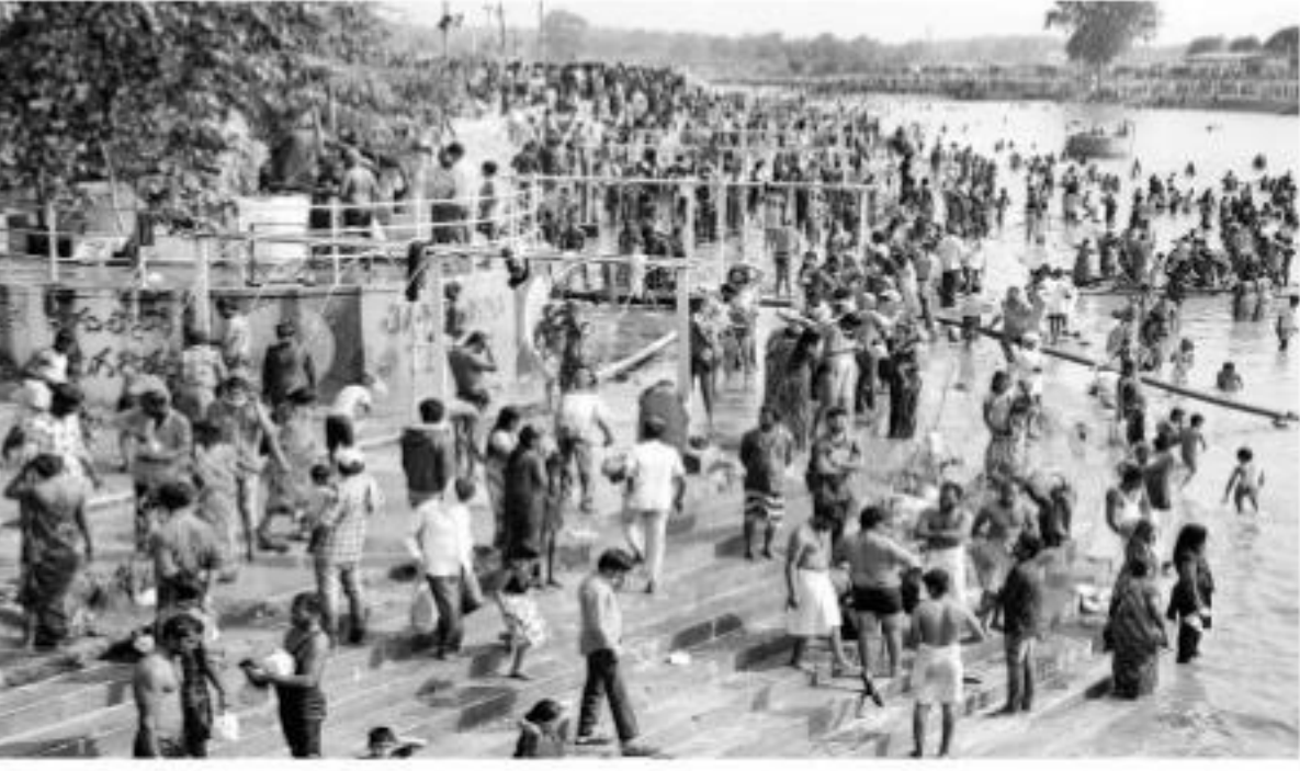
జంపన, నాగుల్లో సానుమాచరిస్తున్న భక్తులు