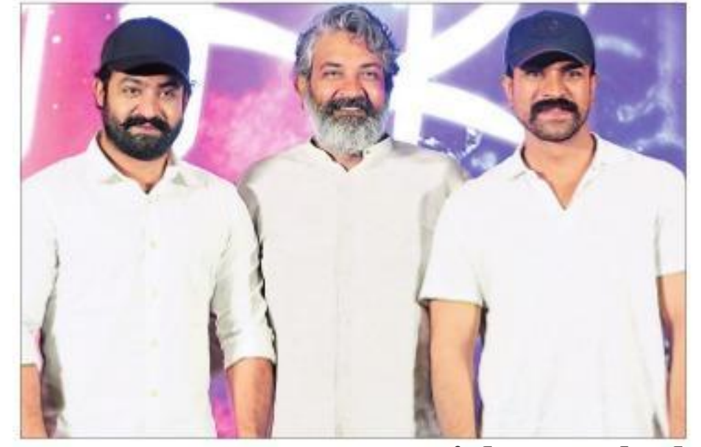
● ఎన్టీఆర్, రాజమౌళి, రామ్చరణ్

దర్శకుడు రాజమౌళి తన పంచెకోళ్ళను వచ్చే ఏడాది సంక్రాంతికి బాక్సాఫీస్ బరిలో దింపడానికి నిర్ణయించుకున్నారు. ఎన్టీఆర్, రామ్చరణ్ హీరోలుగా రాజమౌళి తెరకెక్కిస్తున్న పేరియాడికల్ చిత్రం 'అర్ఆర్ఆర్'. డీవీపీ దానయ్య నిర్మిస్తున్న ఈ చిత్రాన్ని ఈ ఏడాది జూలై 30న విడుదల చేయాలనుకుంటున్నట్లు ముందుగా ప్రకటించారు. ఆ తర్వాత సినిమా వాయిదా పడిందనే వార్తలు కూడా వినిపించాయి. తాజాగా ఈ సినిమాను జనవరి 8, 2021 విడుదల చేయనున్నట్లు ప్రకటించింది చిత్రబృందం. "ప్రేక్షకులకు మునుపెన్నడూ లేని అనుభవాన్ని అందించాలని మా టీమ్ అందరం కష్టపడుతున్నాం. వాయిదా పడటం నిరుత్సాహం కలిగించే వార్త కానీ మా బెస్ట్ ఇన్ఫర్మేషన్ ప్రయత్నిస్తూనే ఉంటాం" అని 'అర్ఆర్ఆర్' బృందం ట్వీట్లో పేర్కొంది.