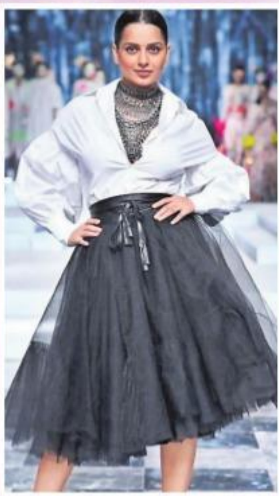
● బాలీవుడ్ నటి కంగనా రనౌత్ లోటస్ మేకప్ ఇండియన్ ఫ్యాషన్ వీక్-2020లో నలుపు రంగు టుటు స్టైల్, ఓవర్ సైజ్ బటన్ డౌన్ షర్ట్ ధరించి బోహో స్టైల్లో ర్యావ్ వాక్ చేశారు.

'జివర్ సైజ్ స్టైల్'కి దీపిక రాణి: తెల్లటి కోట్ నెక్ టాపిక్ లాజ్గా ఉండే స్లీవ్స్, నీలిరంగు బ్యాగ్ వైట్ లెగ్ జిన్స్ తో ఇటీవల మెరిసింది బాలీవుడ్ దీపిక పదుకోన్ మెరిసింది. దాని మీదకు ఫ్యాషన్ జ్యువెలర్, స్ట్రీకర్స్, హానీబ్రెత్ రూపాన్ని వెలిగిస్తూ మార్చింది.