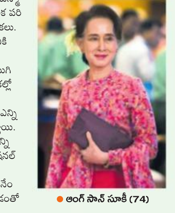
ఆంగ్ సాన్ సూకి (74)

విడుదలయ్యాక మయన్మార్ లో జరిగిన ఒక కీలక పరిణామం... ఉప ఎన్నికలు, వ్యక్తుల అక్కడి విభజనలు జాగ్రత్త పడుతున్నాయి. ఆమెకు దేశాధ్యక్షురాలు అయ్యే అవకాశాన్ని కల్పించడానికి ఉద్దేశించిన బుధవారం నాటి తాజా రాజ్యాంగ సవరణ బిల్లుకు సైకల్ మయన్మార్ పార్లమెంటులోని మెజారిటీ సభ్యుల ఆమోదం లభించలేదు. మయన్మార్ స్వేచ్ఛకోసం బంది అయిన యాదాని అంగ్ సాన్ సూకి. 1989 జూలై 20 నుంచి 2010 నవంబర్ 13 వరకు ఇరవయ్యే క్షేత్ర కాలంలో ఏడేళ్ల మధ్య స్వల్ప విరామాలతో దాదాపు 15 ఏళ్ల పాటు బర్మా సైనిక పాలకుల నిర్బంధంలో గడిపారు. నిర్బంధం నుంచి సూకి