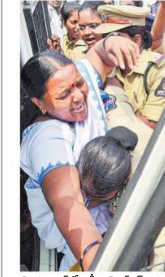
హైదరాబాద్ లోని డీఎంఈఎస్ వద్ద ఆశ వర్కర్లను అరెస్టు చేస్తున్న పోలీసులు

సాక్షి, హైదరాబాద్: రాష్ట్రంలో రాబోయే రెండు రోజులు పాడి వాతావరణం ఉంటుందని హైదరాబాద్ వాతావరణ కేంద్రం వెల్లడించింది. తూర్పు విదర్భ నుంచి తెలంగాణ, డక్షిణ ఇంటియర్ కర్ణాటక మీదుగా డక్షిణ తమిళనాడు వరకు 0.9 కి.మీ. ఎత్తు వరకు ఉపరితల డ్రోప్ కోనసాగుతుందని పేర్కొంది. గురువారం భద్రాచలంలో 37 డిగ్రీల సెంటీగ్రేడ్ ఉష్ణోగ్రత నమోదైంది. మహబూబ్ నగర్ లో 36, ఆదిలాబాద్, ఖమ్మంలో 35, నిజామాబాద్ లో 34, హైదరాబాద్, నల్గొండ, రామగుండంలో 33, హన్మంతపేటలో 32 డిగ్రీల ఉష్ణోగ్రత నమోదైంది.