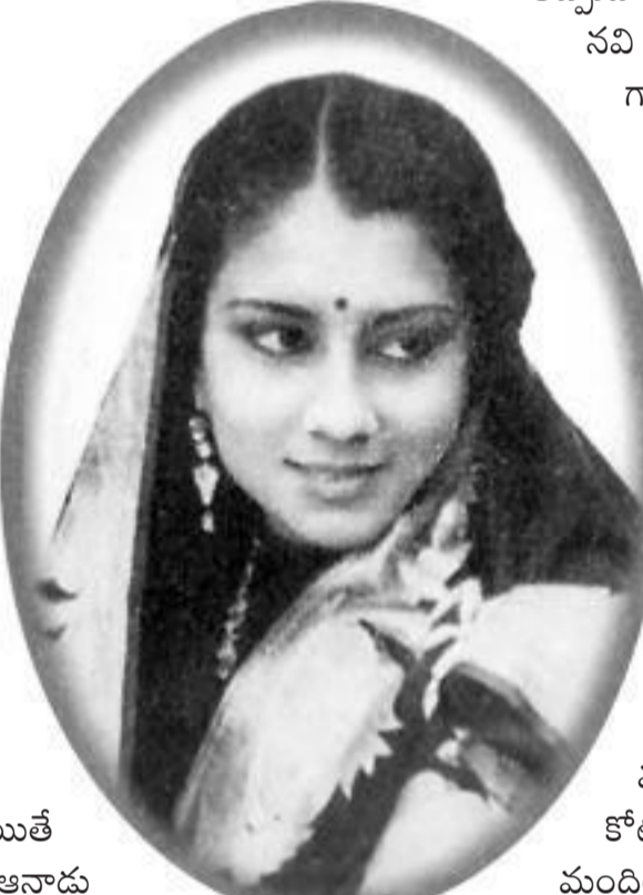
విజయ రాజే సింగ్ నిందియా (పాత ఫోటో)

పక్కన పెట్టి వ్యర్థ నేత కమలాధేవి సింగ్ ను చేసిన తప్పకుండా ఇప్పుడు కాంగ్రెస్ పార్టీ మూల్యం చెల్లించుకోవాలి. అయితే విజయ రాజే సింగ్ కు ఆనాడు చదువుల్ని ఆశించి పార్టీ నుంచి బయటికి వెళ్లిపోలేదు. ముఖ్యమంత్రి మిశ్రా తనను అతడి క్యాబ్లినీ బయలు రెండు గంటల పాటు వేచి ఉండేలా చేయడంతో ఆమె తీవ్రమైన ఆగ్రహానికి గురయ్యారు. కేవలం ఆ ఒక్క కారణంగానే పార్టీని వీడి, మిశ్రా దురుభిక్షానికి తగిన కాస్తా చేశారు. బీజేపీ నవ వ్యవస్థాపకులలో ఒకరైన విజయ రాజే 2001లో తన 81 యేట ఢిల్లీలో కన్నుమూశారు.