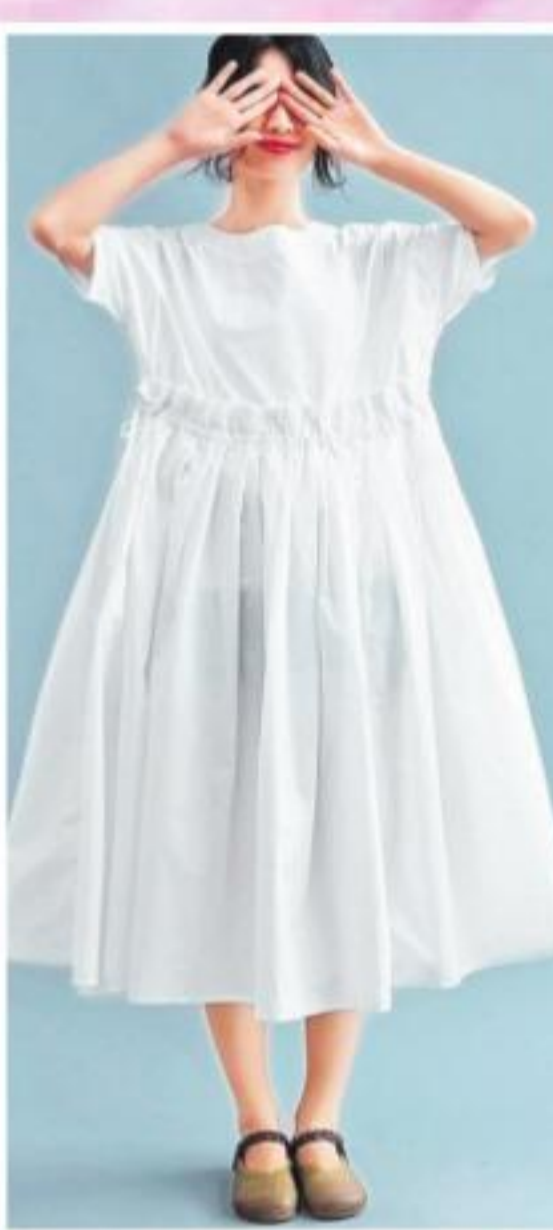
ఇది రెల్మో స్టైల్ నుంచి వచ్చింది. దాదాపు 70ల కాలంలో ఉండే ప్రాక్స్, బెల్ట్ ప్యాంట్స్, బెల్ట్ స్లీవ్స్ అలా అలా కొద్దిగా మార్పులు చేసుకుంటూ వదులైన డ్రెస్సులు రూపాంతరం చెందాయి.