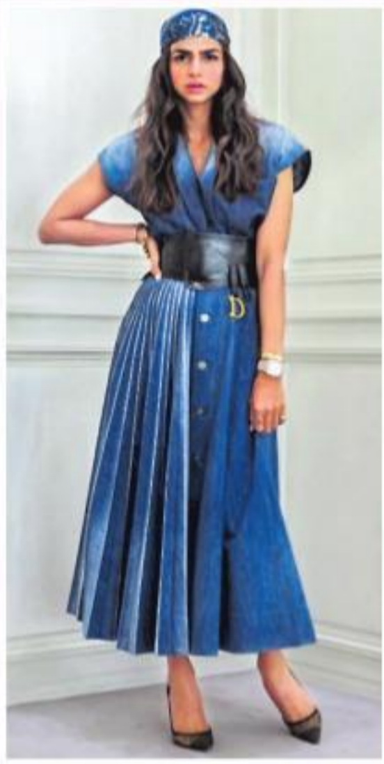
● 80ల కాలం డ్రెస్సింగ్ స్టైల్ ఇప్పుడు కొత్తగా ఆకట్టుకుంటోంది. దీనికా పలువురు సినీ కథానాయికలే రుజువు. డెనిమ్ షెర్ట్ బ్యాగ్ పాయింట్, ఓవర్ సైజ్ షర్ట్ కి, బెల్ట్ తో జత చేసే ఫైన బ్రాక్ షేజర్ లేదా జాకెట్ ను కూడా జత చేసుకోవచ్చు.