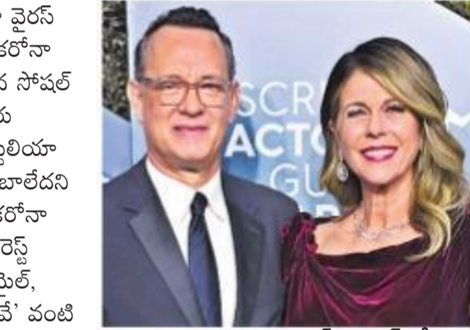
● టామ్ హ్యాంక్స్, రీటా విల్సన్

హాలీవుడ్ సీనియర్ నటుడు టామ్ హ్యాంక్స్ కరోనా వైరస్ సోకింది. ఆయనకు, ఆయన భార్య రీటా విల్సన్ కు కరోనా వైరస్ పాజిటివ్ వచ్చిందన్న విషయాన్ని తన సోషల్ మీడియా అకౌంట్ ద్వారా స్పష్టం చేశారు హ్యాంక్స్. మాటింగ్ నిమిత్తం ఆస్ట్రేలియా వెళ్లారు హ్యాంక్స్. ఆరోగ్యం బాలేదని డిస్ట్ చేయించుకుంటే కరోనా అని తేలింది. 'ఫారెన్ గండ్, గ్రీన్ మెల్, క్యాస్ట్ ఎవే' వంటి సినిమాల్లో విలక్షణ నటనతో ప్రపంచవ్యాప్తంగా అభిమానులను సంపాదించుకున్నారూ హ్యాంక్స్. "మం ఇద్దరం డాక్టర్లు చెప్పినవన్నీ పాటిస్తాం. అంతేకానీ కరోనా సోకిందని కంగారు పడటంలేదు" అని ఈ కవర్ పేర్కొన్నారు.