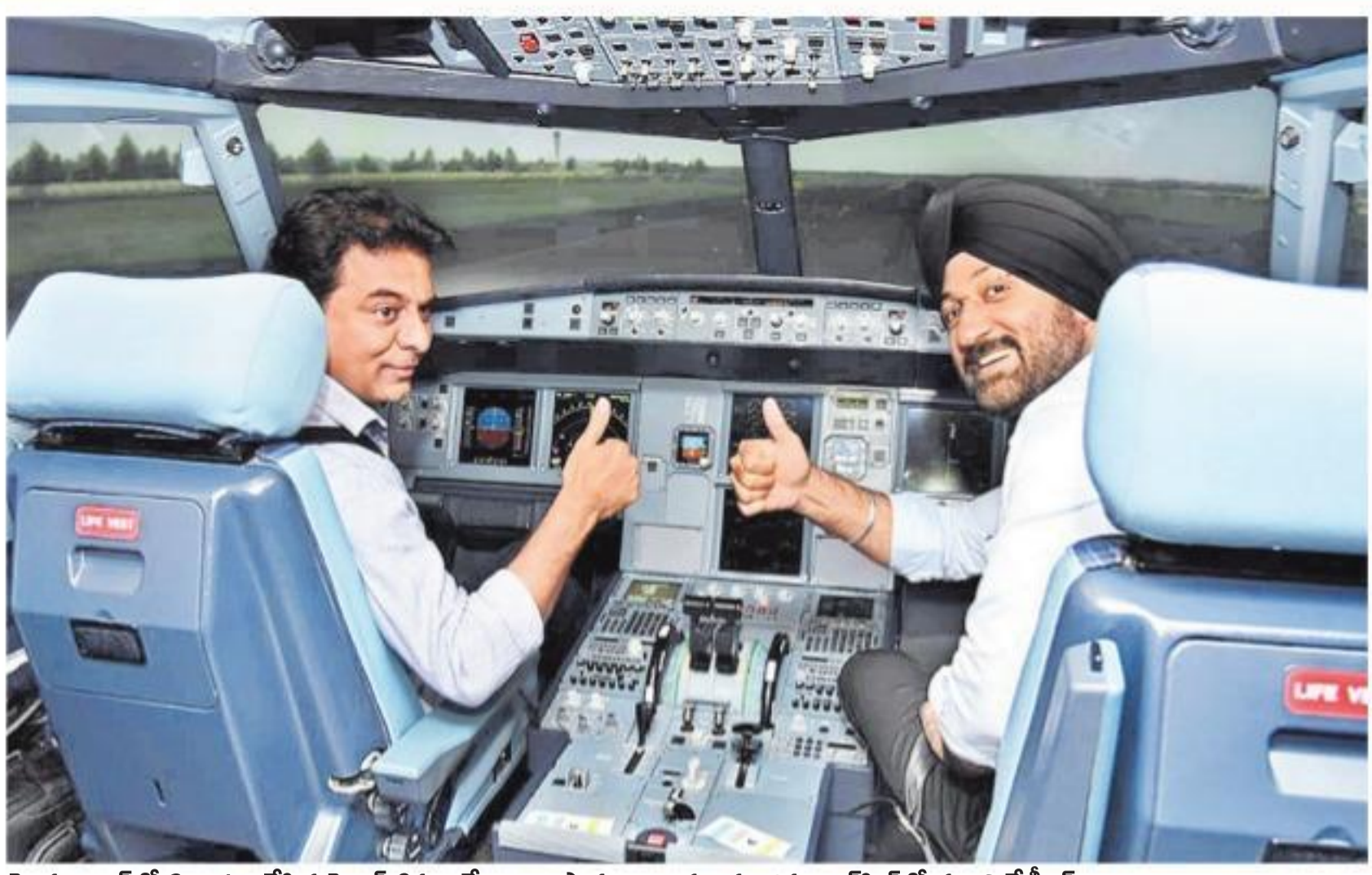
హైదరాబాద్ లో ఏర్పాటు చేసిన ఫైల్ట్ శిక్షణా కేంద్రాన్ని ప్రారంభించిన అనంతరం కాకిపేట్ లో మంత్రి కేటీఆర్

సాక్షి, హైదరాబాద్: బీజేపీ రాష్ట్ర అధ్యక్షుడిగా నియమితులైన కరీంనగర్ ఎంపీ బండి సంజయ్ ఈ సేవ 15వ బాధ్యతలు స్వీకరించనున్నారు. పార్టీ కార్యాలయంలో రాష్ట్ర పార్టీ నేతల సమక్షంలో బాధ్యతలు చేపట్టనున్నారు. ప్రస్తుతం ఢిల్లీలో ఉన్న ఆయన ఆదివారం హైదరాబాద్ చేరుకోనున్నారు. మధ్యాహ్నం 12 గంటలకు శంషాబాద్ విమానాశ్రయానికి చేరుకుంటారు. అనంతరం నాంపల్లిలోని బీజేపీ కార్యాలయానికి భారీ ర్యాలీలో రానున్నారు. అమితాబ్, నద్దాలను కలిసిన సంజయ్.. బండి సంజయ్ గురువారం పార్లమెంట్ లోని కేంద్ర హోం మంత్రి కార్యాలయంలో అమితాబ్, బీజేపీ జాతీయ అధ్యక్షుడు జేపీ నద్దాను మర్యాదపూర్వకంగా కలిశారు. ఈ సమావేశంలో కేంద్ర మంత్రి కిషన్ రెడ్డి ఉన్నారు. ఈ సందర్భంగా రాష్ట్రంలో బీజేపీ అధికారంలోకి తీసుకువచ్చేందుకు మరింతగా కష్టపడాలని అమితాబ్ రాష్ట్ర నేతలకు సూచించారు.