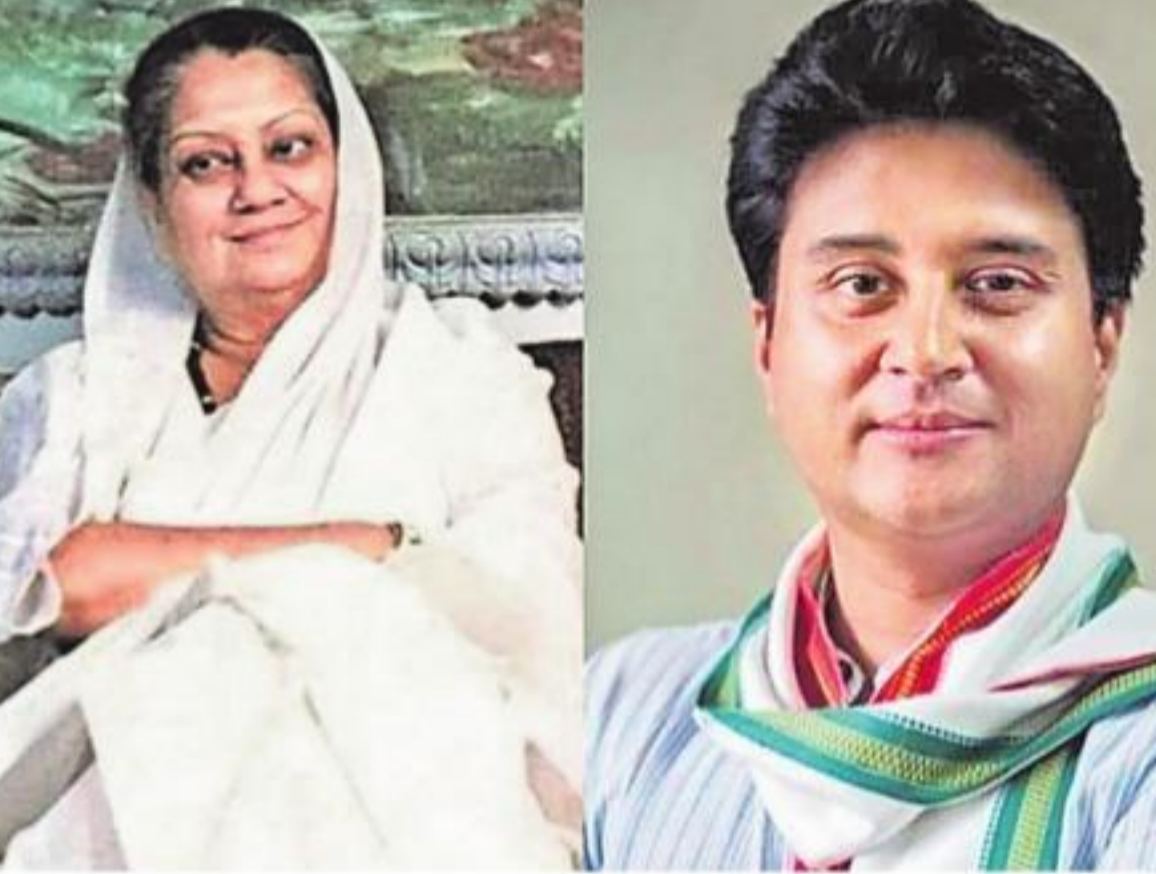
విజయ రాజే, జ్యోతిరాదిత్య సింగ్ నిందియా

కరోనా డిసెంబర్లో మొదలైంది. అప్పట్నుంచీ ఈ వధ్యం సోషల్ మీడియాలో వైరల్ అవుతూనే ఉంది. వధ్యంలో బ్రహ్మాంగారు వాడిన రెండు మాటలు 'ఈశాన్యం', 'కోరం కి' కరోనా వైరస్ ను సరిపోయాయి. వధ్యంలోనే 'కోటి మందికి తగిలి' అని మరో మాట ఉంది. కాలజ్ఞానాన్ని నమ్మేవారిని కలవర పెట్టే మాట ఇది. ఇప్పటికే లక్ష మందికి పైగా కరోనా.. కోటికి చేరుకున్నా కూడా.. ఆ కోటి మందిలో మనమో, మనవాళ్లే ఉండరు కదా! అని అనుమానం. అప్పటి దీనికీ నమ్మని వాళ్లు బ్రహ్మాంగారు వచ్చాల్సి కూడా నమ్మరు. బ్రహ్మాంగారు రిపై నమ్మకం లేకపోవడం కాదని. సోషల్ మీడియాను నమ్మలేకపోవడం. 'బ్రహ్మాంగారు ఆనాడే చెప్పారు' అని పేపర్లు రాస్తే ఉండే నమ్మకం.. అదే వార్త సోషల్ మీడియాలో వస్తే ఉండదు. ఎవరికీ ఇష్టం వచ్చినది వాళ్లు పెట్టేయడానికి అనుచుగా 'నేటి' ఉండటంతో 'ఫేక్ న్యూస్'లు ఎక్కువైపోయి క్రమంగా విశ్వసనీయతను కోల్పోతోంది సోషల్ మీడియా. అందుకే.. 'ఈశాన్యదిక్కున విష గాలి వుట్టేను.' అని వైరల్ అవుతున్న వచ్చాల్సి చూడ గానే.. నిజంగానే బ్రహ్మాంగారు రాశాశా, ఎవరైనా రాసి, పాతకాలపు ఆక్షరాల్లో చెప్పి బ్రహ్మాంగారు పేరు పెట్టేశారా అనే సందేహం వచ్చేస్తుంది.