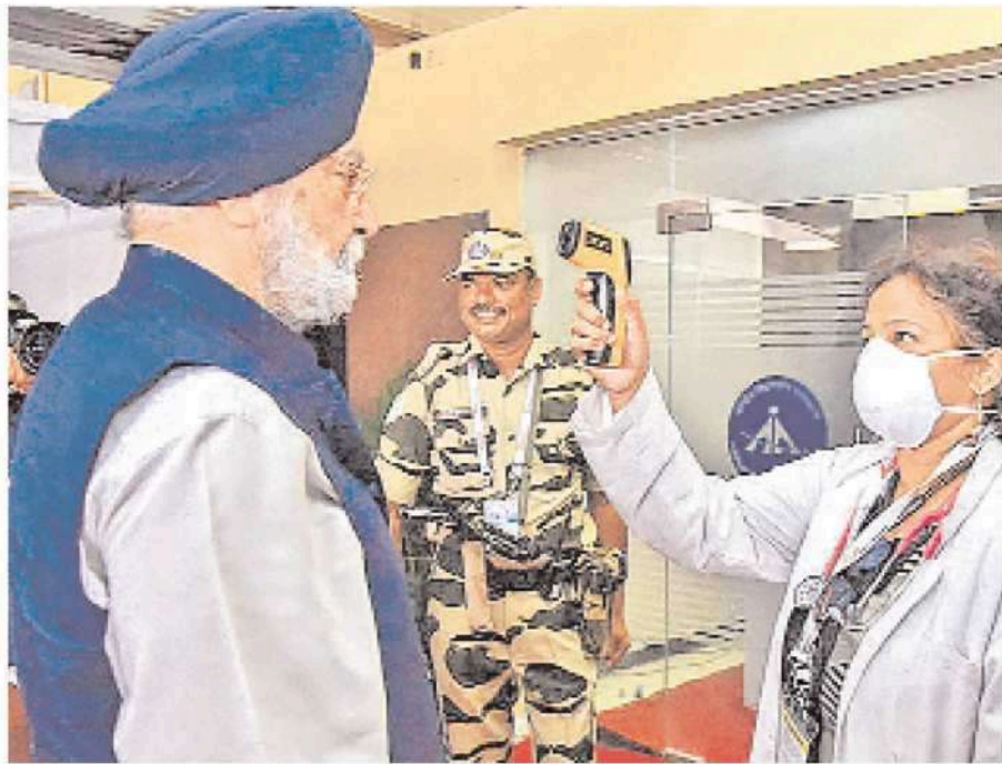
శనివారం శంషాబాద్ అంతర్జాతీయ విమానాశ్రయంలో పౌర విమానయాన శాఖ మంత్రి హరీష్ కుమార్ పూరికి కొబ్బరి - 19 ధర్మల్ స్ట్రీనింగ్ పరిశ్రమ నిర్వహిస్తున్న దృశ్యం

ఉమ్మడి రాష్ట్రంలో మనం మొదటి తరహా పరిపాలనను చూస్తే, తెలంగాణ రాష్ట్రంలో రెండో తరహా పరిపాలనను చూస్తున్నాం.