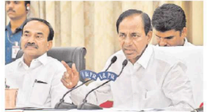
శనివారం రాత్రి ప్రతిభవన్ లో మంత్రివర్గ సమావేశం అనంతరం మీడియాతో మాట్లాడుతున్న ముఖ్యమంత్రి కే చంద్రశేఖర్ రావు. చిత్రిలో మంత్రి కుటుంబ రాజేందర్ కూడా ఉన్నారు.