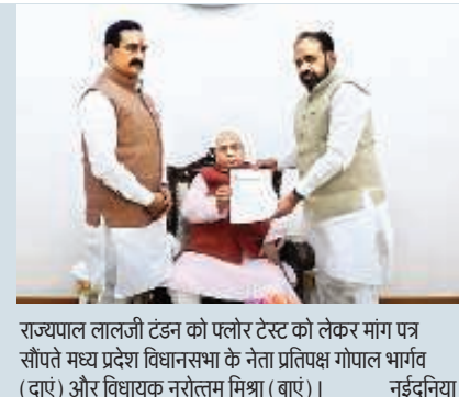
राज्यपाल लालजी टंडन को फ्लोर टेस्ट को लेकर मांग पत्र सौंपते मध्य प्रदेश विधानसभा के नेता प्रतिपक्ष गोपाल भांगव (दाएं) और विधायक नरोत्तम मिश्रा (बाएं)

मध्यप्रदेश विधानसभा के बजट सत्र के पहले दिन सोमवार को कमलनाथ सरकार फ्लोर टेस्ट नहीं कराएगी। रविवार रात जारी विधानसभा की कार्यसूची में इसका उल्लेख नहीं है। राज्यपाल लालजी टंडन ने शनिवार रात को मुख्यमंत्री कमलनाथ को पत्र लिखकर निर्देश दिए थे कि सोमवार को अभिभाषण के ठीक बाद सरकार विधानसभा में विश्वास मत हासिल करे। रविवार को पुनः राज्यपाल ने मुख्यमंत्री को आदेश दिया कि सदन में हाथ उठाकर मत विभाजन की कार्यवाही हो, विश्वास मत के लिए अन्य कोई तरीका न अपनाया जाए।