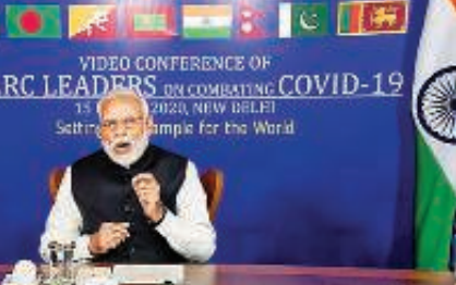
कोरोना वायरस के तेजी से फैलते संक्रमण को लेकर प्रधानमंत्री नरेंद्र मोदी ने रविवार को सार्क देशों के राष्ट्राध्यक्षों से वीडियो कांफ्रेंसिंग के जरिए बातचीत की और महामारी से उदक मुकाबला करने को कहा।

कोरोना वायरस के खिलाफ साझा लड़ाई के मोकै पर पाकिस्तान जम्मू-कश्मीर का मुद्दा उठाने से बाज नहीं आया। प्रधानमंत्री नरेंद्र मोदी की पहल पर सार्क देशों के राष्ट्राध्यक्षों की वीडियो कांफ्रेंसिंग के जरिये सम्मेलन के दौरान पाकिस्तान ने कोरोना की आड़ में जम्मू-कश्मीर में जारी प्रतिबंधों का मुद्दा उठाते हुए इसे तत्काल समाप्त करने की मांग की। जबकि सार्क के दूसरे सभी देशों ने मोदी की पहल का स्वागत करते हुए कोरोना के कहर से निपटने के लिए एक-दूसरे की मदद को वक्त की जरूरत बताया। सार्क देशों में कोरोना से निपटने के लिए कोविड-19 इमरजेंसी फंड बनाने की घोषणा करते हुए मोदी ने भारत की ओर से इसमें एक करोड़ अमेरिकी डॉलर (लगभग 74 करोड़ रुपये) देने का एलान किया। मानवता पर संकट के समय भी कश्मीर का मुद्दा उठाने पर कड़ा एतराज जताते हुए भारतीय विदेश विभाग के एक वरिष्ठ अधिकारी ने रविवार को कहा कि इससे एक बार फिर पाकिस्तान का असली चेहरा सामने आ गया है। इससे यह भी साफ हो गया कि पाकिस्तान कोरोना वायरस से आम लोगों की सुरक्षा को लेकर कितना गंभीर है। सम्मेलन में श्रीलंका, नेपाल, मालदीव, भूटान, बांग्लादेश और