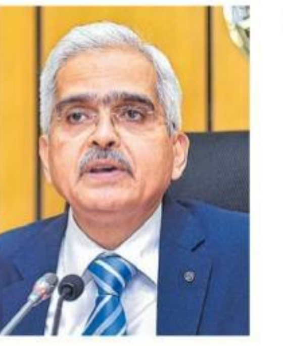
పురోగతిలో యెస్ బ్యాంక్ పరిష్కారం

ముంబై: ఏప్రిల్ మూడో తేదీన జరిగే ప్రత్యేక విధాన కమిటీ (ఎంపీసీ) సమావేశంలో మాత్రమే రేట్ల తగ్గింపుపై నిర్ణయం తీసుకుంటామని ఆర్ బిబి గవర్నర్ శక్తికాంత్ దాస్ ప్రకటించారు.