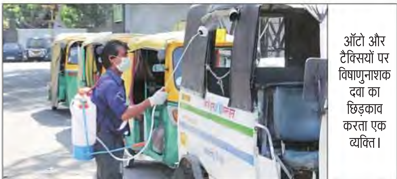
ऑटो और टैक्सियों पर विषाणुनाशक दवा का छिड़काव करता एक व्यक्ति।

कोरोना संक्रमण को रोकने के लिए डीटीसी और बलस्टर बसों के साथ-साथ मेट्रो की भी दैनिक आधार पर साफ-सफाई की जा रही है। सभी आइएसबीटी को भी रोजाना विषाणुरहित किया जा रहा है। इसमें विशेष रूप से प्लेटफार्म और सामान्य सतहों जैसे हाथ की रेलिंग, सीटें आदि शामिल हैं।