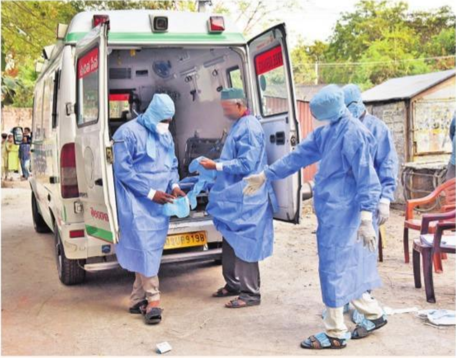
కరోనా వైరస్ అనుమానితులను కరీంనగర్ నుంచి హైదరాబాద్ గాంధీ దవాఖానకు తరలిస్తున్న 108 సిబ్బంది