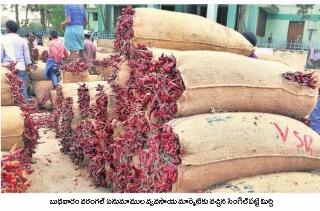
బుధవారం వరంగల్ ఏనుమాముల వ్యవసాయ మార్కెట్ కు వచ్చిన సింగిల్ పట్టి మిర్చి