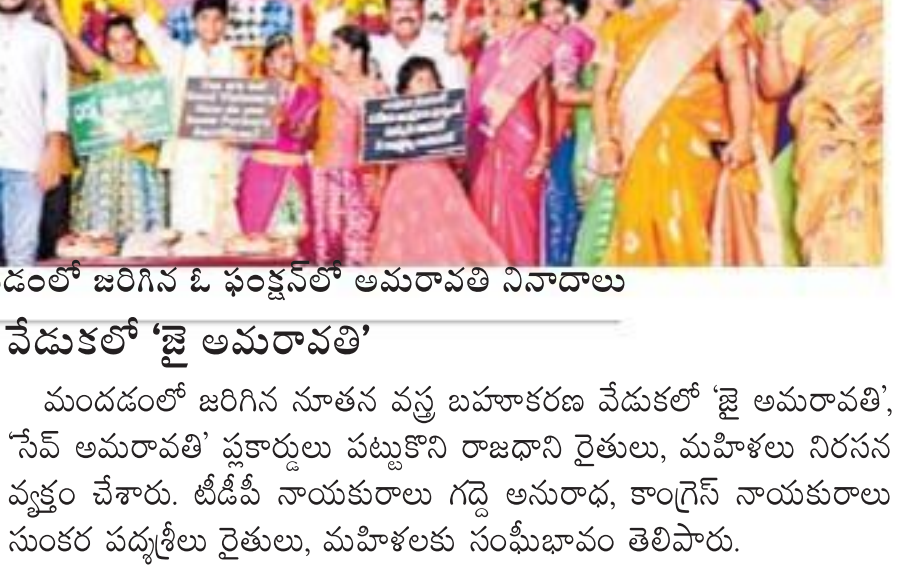
మండలంలో జరిగిన ఓ ఘనంగా 'అమరావతి' నినాదాలు

కూర్చోవాలని నిర్ణయించారు. 29 గ్రామాల్లో రోజూ రాత్రి 7.30కు 5 నిమిషాల పాటు 'అమరావతి వెలుగు' పేరుకు విడుదల చేసిన కరోనా పోరాట పాటను వెలిగించి నిరసన తెలిపారు. అలానే ప్రతి ఇంటిపైనా నల్ల జెండా, జేపీఎన్ జెండా ఎగరేయడం చేశారు. పార్లమెంట్ ఉభయ సభల ఎంపీలకు ఇక్కడ జరగకుండా అన్యాయాలపై మొయిల్స్ పంపించాలని నిశ్చయించారు.