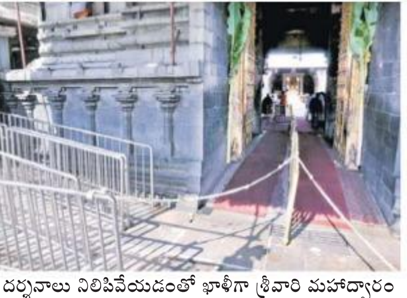
దర్బనాలు నిలిపివేయడంతో ఖాళీగా శ్రీవారి మహాద్వారం

ఆమె ఇచ్చిన పాట్రీకి ఎంపీ దుష్యంత్ సింగ్ పలువురు ఎంపీలను, రాష్ట్రపతిని కలిసిన ఎంపీ తన తల్లి వసుంధర రాజతో కలిసి క్వారంటైన్ లో వారిద్దరి బాటలో పలువురు ఎంపీలు కనికా కపూర్ పై ఎఫ్ఐఆర్ కు ఆదేశం