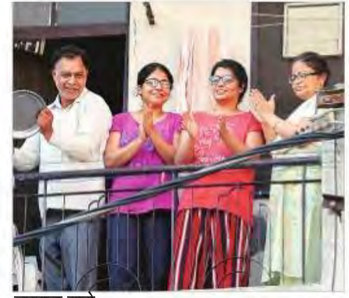
जनसत्ता ब्यूरो नई दिल्ली, 22 मार्च।

प्रधानमंत्री नरेंद्र मोदी की अपील पर रविवार को पूरा देश एकजुट दिखा। 'जनता कर्फ्यू' की अपील का व्यापक असर दिखा, पूरे देश में लोगों ने अभूतपूर्व बंदी की। कोरोना विषाणु का फैलाव रोकने की कवायद के मद्देनजर लोगों ने सामाजिक दूरी बनाए रखने की स्वतः पहल की। लोग अपने घरों तक सीमित रहे। इसके अलावा प्रधानमंत्री मोदी की दूसरी अपील के तहत लोगों ने टीक शाम पांच बजे बर्तन, तालियां, घंटी, शंख बजाकर कोरोना वायरस के खिलाफ लड़ाई लड़ रहे सुरक्षाबलों के जवानों, डॉक्टरों, सफाईकर्मियों के प्रति अपना सम्मान जताया। प्रधानमंत्री ने गुरुवार को राष्ट्र के नाम अपने संबोधन में लोगों से ये अपील की थी। सुबह सात बजे जनता कर्फ्यू प्रभावी होने के बाद लोगों ने सामाजिक दूरी बनाए रखने की पहल के तहत खुद को घरों के भीतर ही सीमित रखा और सार्वजनिक परिवहन के कुछेक वाहन खाली सड़कों पर नजर आए। जनता कर्फ्यू का देश भर में व्यापक असर दिखा। देशभर के बाकी पेज 8 पर