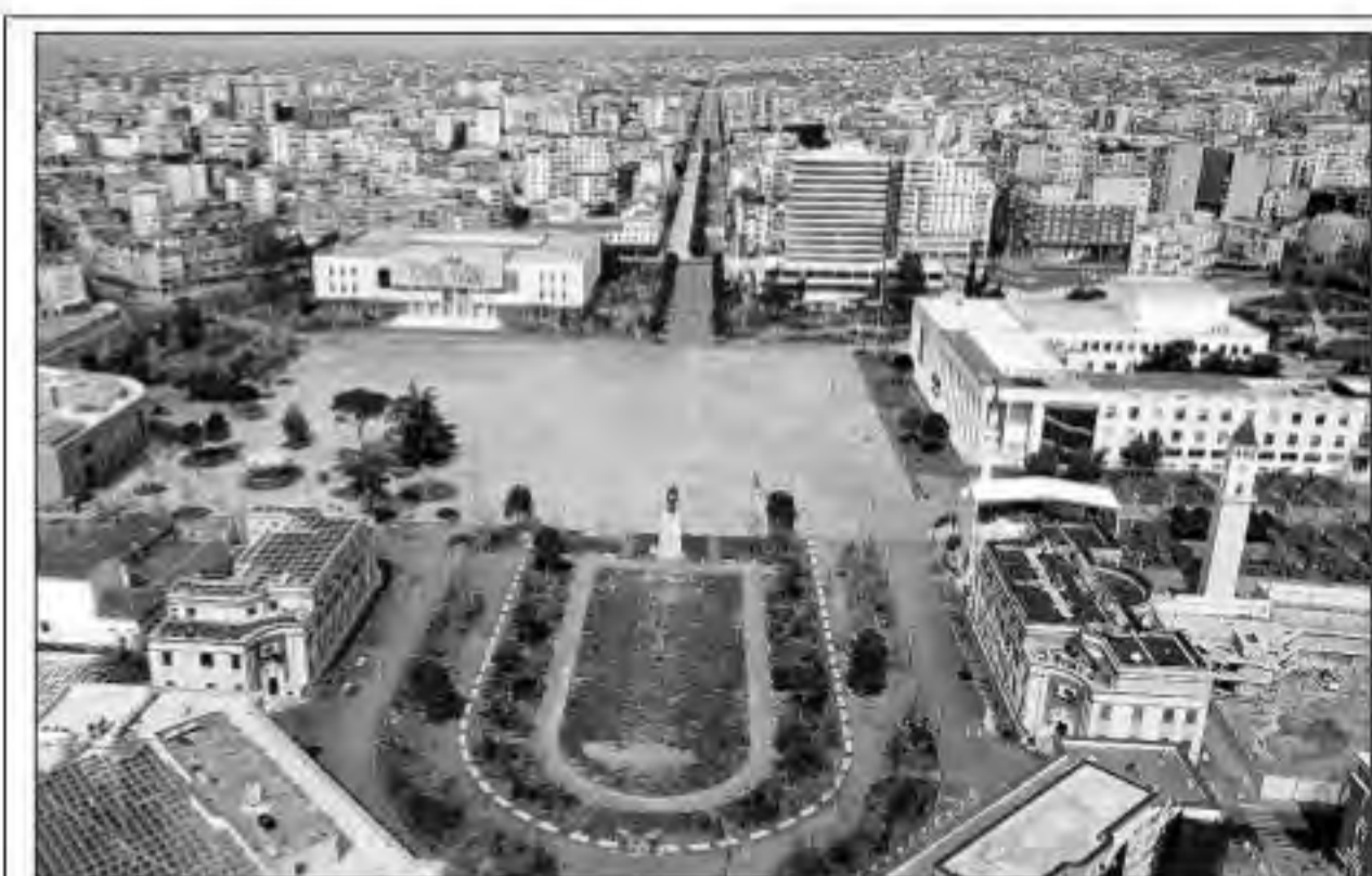
अल्बीनिया में रविवार को पूर्ण बंदी के कारण वीरान पड़ा नामचीन स्कैंडेबर्ग स्वायार।

आंकड़ा चीन और ईरान में हुई मौतों को जोड़ने के बाद भी कहीं ज्यादा है। इटली में कोविड-19 के पुष्ट मामलों में मृत्यु दर 8.6 प्रतिशत है जो कई देशों की तुलना में खासी अधिक है।