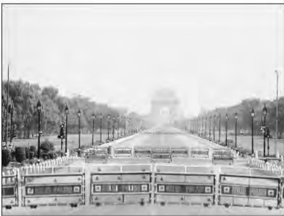
इंडिया गेट दिखा सूना।