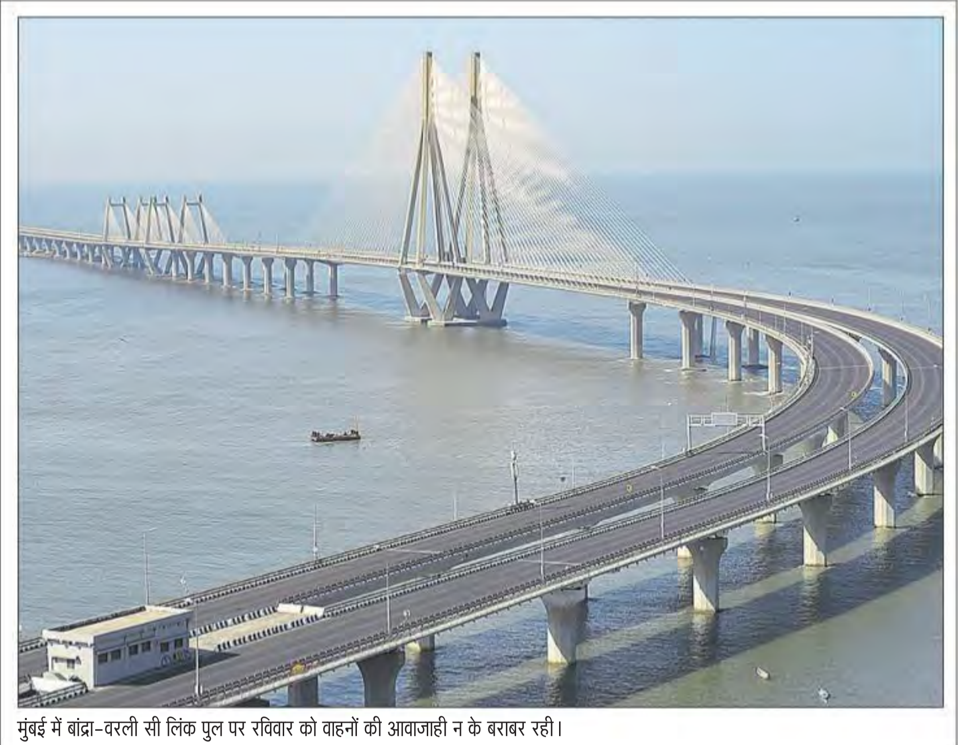
मुंबई में बांद्रा-वरली सी लिंक पुल पर रविवार को वाहनों की आवाजाही न के बराबर रही।

से 31 मार्च तक पूरी तरह लॉक डाउन के निर्देश दिए थे। इस लॉक डाउन के तहत आवश्यक सेवाओं के अतिरिक्त समस्त राजकीय एवं निजी कार्यालय, मॉल्स, दुकानें, कारखाने एवं सार्वजनिक परिवहन आदि बंद रखने को निर्देश दिये थे।