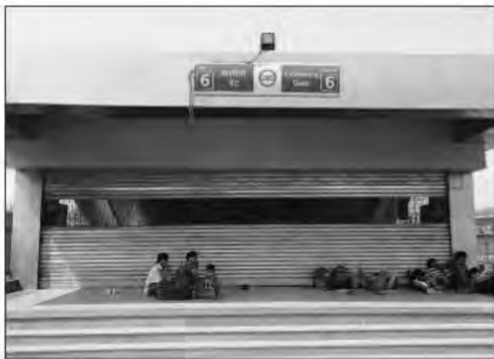
कश्मीरी गेट मेट्रो स्टेशन के बाहर सन्नाटे के बीच यात्री।