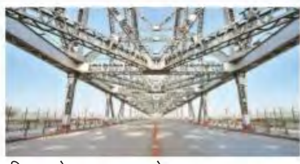
रविवार को सुनसान पड़ा कोलकाता का हावड़ा पुल

विषाणु की जांच के लिए प्रयोगशालाओं की संख्या फौरन बढ़ाने का फैसला किया गया है। संक्रमित लोगों के संपर्क में आए सभी लोगों की जांच की जाएगी, भले ही उनमें लक्षण दिखाई दें या नहीं।