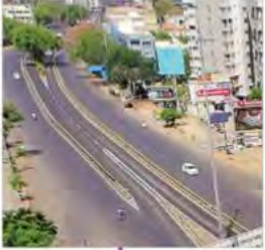
जनसत्ता ब्यूरो नई दिल्ली, 22 मार्च।

रेलवे ने सभी ट्रेन सेवाएं रोक दी हैं। हालांकि, मालगाड़ियां चलेंगी। प्रधानमंत्री नरेंद्र मोदी ने रविवार को देश