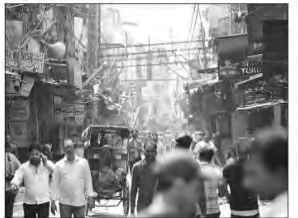
पुरानी दिल्ली कुछ यां दिखी।