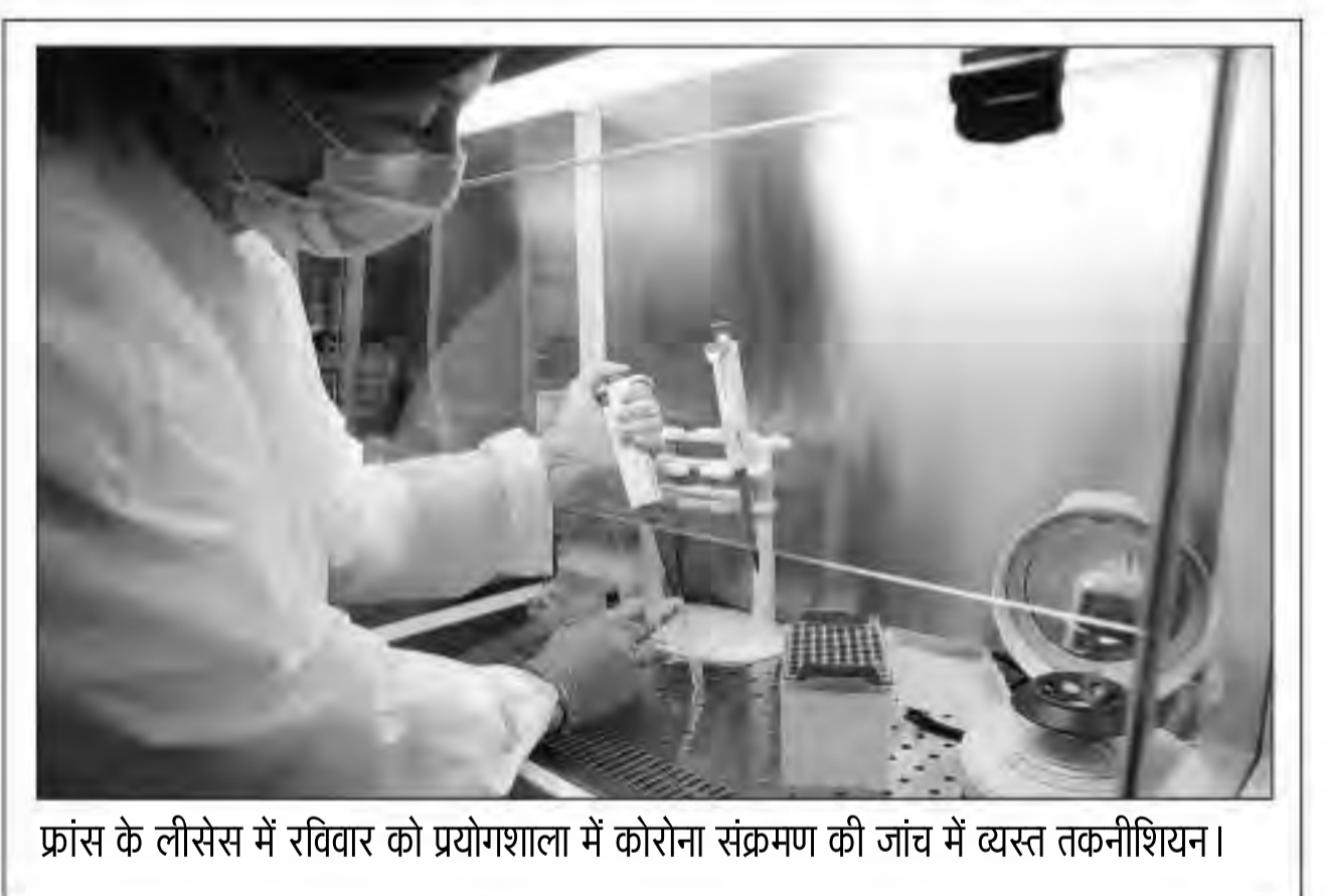
फ्रांस के लीसेस में रविवार को प्रयोगशाला में कोरोना संक्रमण की जांच में व्यस्त तकनीशियन।

कोलंबिया विश्वविद्यालय के सर्जरी विभाग के प्रमुख ने जल्द ही अस्पतालों में मरीजों की तादाद बढ़ने को लेकर आगाह किया है। कुओमो ने कहा कि राज्य के