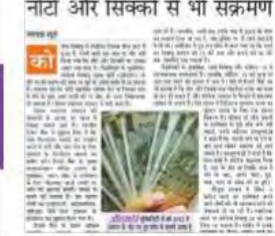
आइबीए ने इसके लिए 'कोरोना से डरो ना, डिजिटल करो ना' नारे के साथ एक अभियान शुरू किया है। बैंक संघ जनता