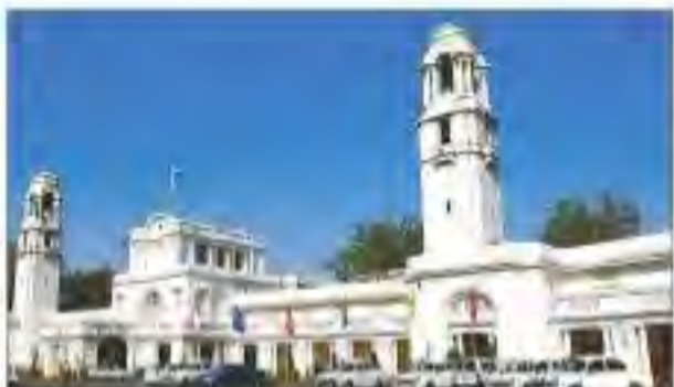
दिल्ली विधानसभा का बजट सत्र कोरोना संकट के बीच शुरू हो रहा है।

सोमवार से शुरू हो रहा दिल्ली विधानसभा का बजट सत्र कई मायनों में अलग होगा। यह सत्र कोरोना के साप में है। सनद रहे कि नई सरकार का पहला सत्र राजधानी में हुए दंगे की बली चढ़ा तो बजट सत्र को कोरोना संकट ले डूबा। यह महत्वपूर्ण सत्र पांच दिन की जगह एक दिन में ही निपटेंगा। बजट सत्र में उपराज्यपाल का अभिभाषण नहीं होगा क्योंकि प्रथम सत्र में ही इसकी औपचारिकता पूरी कर ली गई है। इस बार प्रश्न काल भी नहीं होगा। यह पहला अवसर है जब प्रश्न करने की इजाजत विधायकों को नहीं होगी। इसे लेकर सरकार विपक्ष के निशाने पर है। दिल्ली सरकार की नई पारी की दिशा और दशा उपमुख्यमंत्री और वित्त मंत्री मनीष सिंसोदिया के 23 मार्च को विधानसभा में बजट पेश करने के साथ दिखेगी। सबकी निगाह चुनावी वायदों पर योजनाओं की घोषणाओं पर है। लेकिन सरकार की राह आसान नहीं है। इतना तय है कि जनता को रियायत की कोई नई सौगात नहीं मिलने जा रही है।