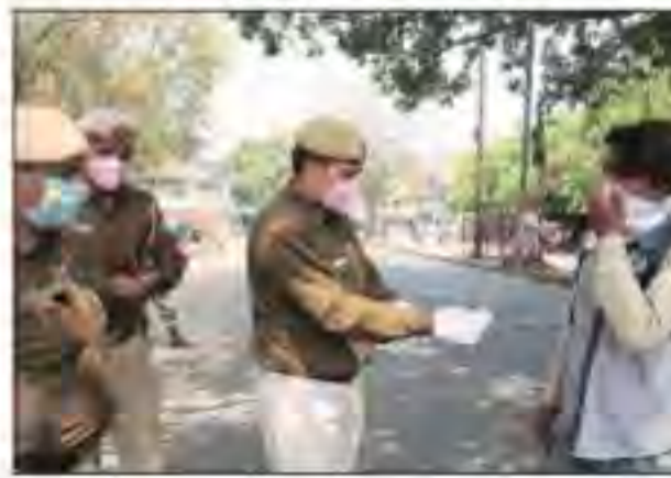
कर्फ्यू के दौरान बाहर निकले लोगों को गुलाब का फूल देकर पुलिस ने समझाया।

दिल्ली पुलिस ने कोरोना वायरस महामारी के मद्देनजर 31 मार्च की मध्यरात्रि तक दिल्ली में धारा 144 लागू करने की रविवार को घोषणा कर दी। यह धारा रविवार रात नौ बजे के बाद से लागू होगी। अब शहर में विरोध प्रदर्शन और अन्य सभाओं पर रोक लग गई है। उधर, जनता कर्फ्यू का असर राजधानी में रविवार को साफ तौर पर दिखाई दिया। कर्नाट प्लेस जैसे भीड़भाड़ वाले बाजार अन्य शॉपिंग माल और सभी व्यावसायिक इलाके सहित गली मुहल्लों में भी लोगों ने प्रधानमंत्री की इस अपील को पूरी तरह अमलीजामा पहनाया। इसके दुबके गाड़ियां सड़क पर दिखाई। दिल्ली पुलिस की पीसीआर की गाड़ियों के साथ जिला और अन्य यूनिटों के जवानों और अधिकारियों ने मुस्ती से जनता कर्फ्यू को सफल बनाने में पूरी तरह मुस्ती ही नहीं दिखे बल्कि सड़क पर चल रहे गाड़ियों को रोककर उन्हें गुलाब का फूल देकर घर में रहने का अनुरोध किया।