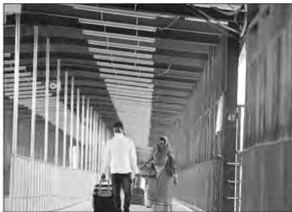
रेलवे स्टेशन का हाल।