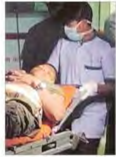
नक्सली हमले में शहीद हुए जवान, 15 जवान घायल जिनमें दो की हालत गंभीर।

पुलिस अधिकारी ने बताया कि इस घटना के बाद 17 जवान लापता हो गए थे। बाद में सुरक्षा बलों ने लापता जवानों की खोज में खोजी अभियान चलाया था। रविवार को लापता जवानों के शव बरामद कर लिए गए।