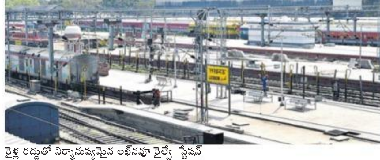
రైల్వే రద్దుతో నిర్మానుష్యమైన లాక్డౌన్ పై డిమాండ్

న్యూఢిల్లీ/శంషాబాద్ రూరల్, మార్చి 22: దేశ చరిత్రలోనే మునుపెన్నడూ లేని విధంగా.. 17 రాష్ట్రాలు, 5 కేంద్రపాలిత ప్రాంతాల్లోని 80 జిల్లాలు 9 రోజులపాటు లాక్డౌన్ కానున్నాయి. సబర్బన్, మెట్రో సర్కిళ్లను సహా రైల్వే, అంతర్జాతీయ బస్సు సర్వీసులు.. అన్ని అధికారం అర్ధరాత్రి నుంచి ఆగిపోయాయి. మార్చి 31 దాకా గూడ్స్ రైల్వే తప్ప మామూలు రైల్వే పట్టణాలకు, కూత పెట్టడం! రోజురోజుకూ పెరిగిపోతున్న కరోనా వ్యాప్తిని అడ్డుకునేందుకు ప్రభుత్వం తీసుకున్న కీలక నిర్ణయాల్ని. కేంద్రం ప్రకటించిన 80 జిల్లాల్లో తెలంగాణలో ఐదు (బ్రహ్మాద్రి కొత్తగూడెం, సంగారెడ్డి, రంగారెడ్డి, హైదరాబాద్, మేడ్చల్), ఏపీలో మూడు (కృష్ణా, ప్రకాశం, విశాఖ) ఉన్నాయి. అవసరమై బట్టి రాష్ట్ర ప్రభుత్వం తమ తమ రాష్ట్రాల్లో ఈ జాబితాను పెంచుకోవచ్చు. మార్చి 31 దాకా ఈ జిల్లాల్లో అత్యవసర సేవలే అందుబాటులో ఉంటాయి. ఈ మేరకు ఆయా రాష్ట్ర ప్రభుత్వాల ఉత్తర్వులు జారీ చేస్తూ అయి రోడ్ల వహించే శాఖ ఉన్నతాధికారి ఒకరు తెలిపారు. అలాగే.. హోం క్వారంటైన్లో ఉండాలి. దాగి అధికారులు సూచించిన క్లియర్ ప్రయాణిస్తున్నా దొంగిలక్కోయకపోతే 12 మంది పాజిటివ్ గా తేలారు. ఈ నేపథ్యంలో అనవసర ప్రయాణాలకు