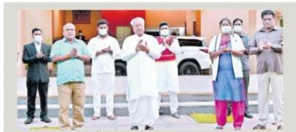
రాజధానిలో చప్పట్లు కొడుతున్న గవర్నర్, సీబిఎం