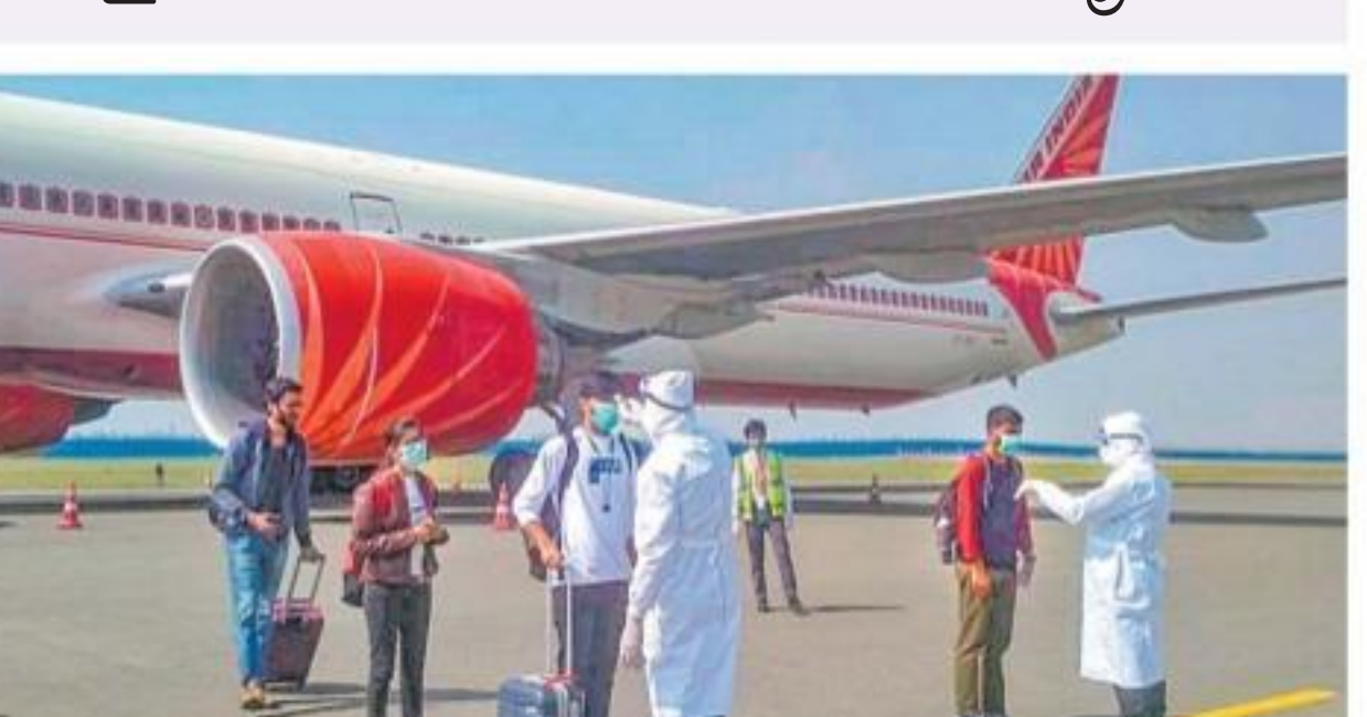
ఇటలీ నుంచి వచ్చిన భారతీయులకు స్క్రీనింగ్

వాషింగ్టన్/రోమ్/పారిస్, మార్చి 22: ప్రపంచవ్యాప్తంగా కరోనా కేసుల సంఖ్య మూడు లక్షలకు మించిపోయింది. మరణించినవారి సంఖ్య 13 వేల దాటింది. 95 దేశాలు సంఖ్యలు వడతం, విద్యుత్తు డిమాండ్ పడిపోవడం, దర్జల్ విద్యుత్తు ప్లాంట్లను అపవేయడం ఇందుకు ప్రధాన కారణాలని ఆ అధ్యయనాలు చెబుతున్నాయి. ఈ కారణంగా చైనాలో వాతావరణ కాలిబంధం 25% దాకా తగ్గి ఉన్నట్లు దేశ రాజధాని ఢిల్లీలో ఓపి-25 స్థాయి ఒకటి వచ్చింది. కాలిబంధం ప్రాంతాల్లో అధికంగా ఉండడం వల్ల వైరస్ ప్రాచుర్యం పెరిగింది. రాబోయే గడ్డు రోజులను ఎదుర్కోవడానికి నిర్దేశించిన స్ట్రాటజీని ప్రధాని పెట్టే సాంచెట్ ప్రజలను కోరారు. రివ్యూ తన వైరస్ నిపుణులను, వైద్య నిపుణులను కలిపి పనిపెట్టింది. బ్రిటిష్లో కరోనా ముప్పు ఎక్కువగా ఉందని గుర్తించిన 15 లక్షల మందిని కనీసం మూడు నెలల పాటు ఇళ్ల వద్దే ఉండాలని ప్రభుత్వం సూచించింది. ఇటలీలో మారిడిగానే బ్రిటిష్లోనూ కరోనా విస్తరిస్తోందన్న ఆందోళన వ్యక్తమవుతోంది. అమెరికాలో సైతం లక్షలాది మంది గడప దాటి బయటకురాలేదు. న్యూజిల్లా కూడా ప్రజలను ఇళ్లలోనే ఉంచాలని కోరంది. న్యూయార్క్, నీట్ జెక్స్లో 38 మందికి కరోనా సోకింది. ఒక్క రోజులో కొత్తగా 7 వేల కేసులు నమోదయ్యాయి. దీంతో మొత్తం కేసుల సంఖ్య 266,574కు పెరిగింది. నాలుగో వైరస్ కారణం ఉండాలని కోరంది. చైనాలో సానిటార్ల సోకిన తొలి కరోనా కేసు నమోదయింది. కొత్తగా అరు మర