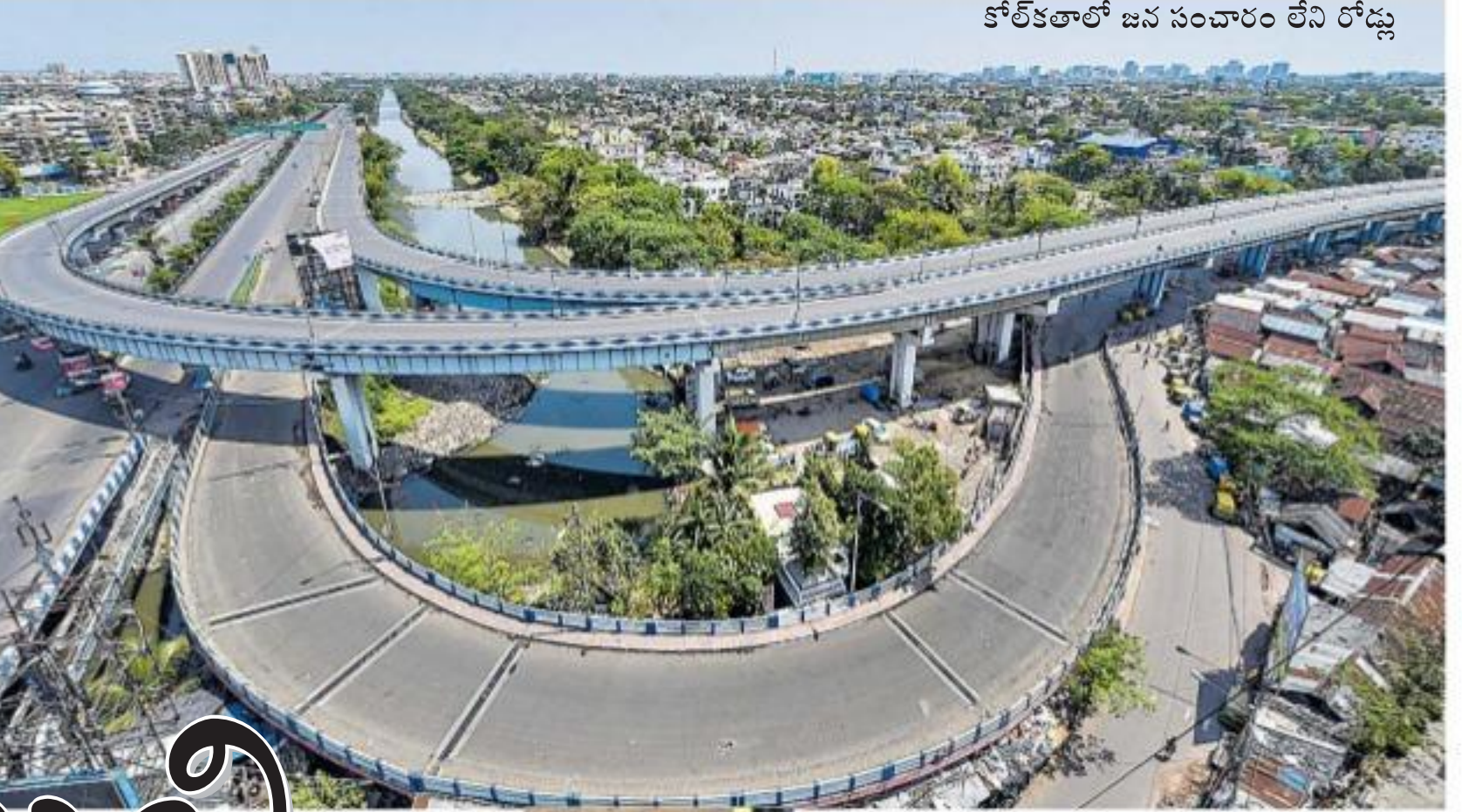
కోల్కతాలో జన సంచారం లేని రోడ్లు

న్యూఢిల్లీ, మార్చి 22: దేశంలో కరోనా పాజిటివ్ కేసుల సంఖ్య 3963 చేరింది. రికార్డు స్థాయిలో ఒకేరోజు 81 మందికి పాజిటివ్ వచ్చింది. మరో ముగ్గురు ప్రాణాలు కోల్పోయారు. దీంతో దేశంలో కరోనా కారణంగా మరణించినవారి సంఖ్య ఏడుగురు చేరింది. వారిలో ఇద్దరు మహారాష్ట్రవాసులే. వైరస్ బారిన పడిన 69 ఏళ్ల వృద్ధుడు ముంబైలో మరణించాడు. ఇంతవరకు దేశంలో అత్యధికంగా 74 కరోనా పాజిటివ్ కేసులు మహారాష్ట్రలో నమోదయ్యాయి. ఒక్క అదివారం నాడే 10 మందికి వైరస్ పాజిటివ్ వచ్చింది. అందులో ఆరుగురు ముంబైవాసులు కాగా.. నలుగురు పుణె వాసులు. పుణెలో వైరస్ బారిన పడిన మహిళ (41) కుటుంబంలో నలుగురికి ఆమె నుంచి వైరస్ సోకింది. విదేశాలకు వెళ్లినవారి డ్యాకా ఆమెకు వైరస్ సోకడం గమనార్హం. గుజరాత్లో తొలి కరోనా మరణం నమోదైంది. సూరత్కు చెందిన 67 ఏళ్ల వృద్ధుడు వైరస్ బారినపడి మృతి చెందినట్లు అధికారులు తెలిపారు. ఆ రాష్ట్రంలో కరోనా పాజిటివ్ కేసుల సంఖ్య 183 చేరింది. ఇప్పటిదాకా రెండు పాజిటివ్ కేసులు మాత్రమే నమోదైన బీహార్లో ఒకరు (38) మరణించారు. ఇతర నుంచి వచ్చిన ఆ వ్యక్తి నమూనాలను శుభ్రపరచడానికి వైద్యపరీక్షకు పంపారు. శనివారం రాత్రి అతడు చనిపోగా.. వైద్యపరీక్ష ఫలితాలు అదివారం వచ్చాయి. అతడికి వైరస్ సోకినట్లు అందులో తేలింది. తమిళనాడులో కరోనా పాజిటివ్ కేసుల సంఖ్య పెరిగింది. బోపాలోనే కూడా.. ఇటీవలే లండన్ నుంచి వచ్చిన ఒక విద్యార్థిని వైరస్ బారిన పడింది. యూపీలో కరోనా బారిన పడిన