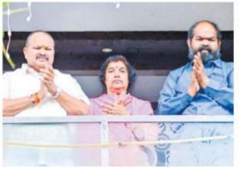
కరోనా నివారణకు కృషిచేస్తున్న వారికి కన్నా ఇలా మద్దతు!