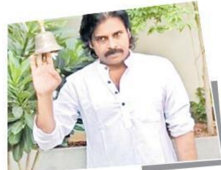
వైద్య సిబ్బందికి మద్దతుగా గంట కొడుతున్న సవన్