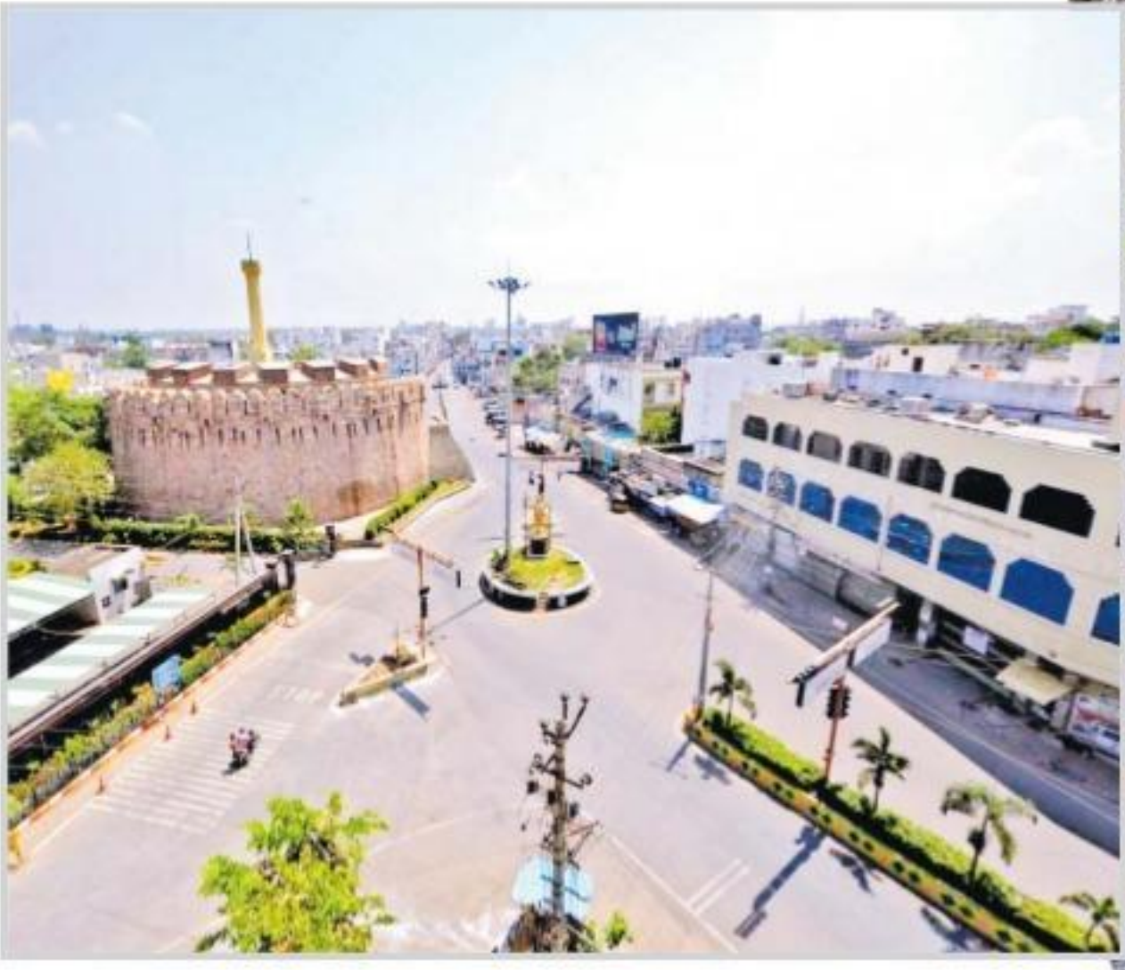
కర్నూలు కొండారెడ్డి బురుజు సెంటర్లో అదివారం నాటి పరిస్థితి ఇదీ..!