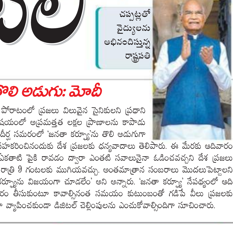
చుట్టూలే వైద్యులను అభినందిస్తున్న రాష్ట్రపతి