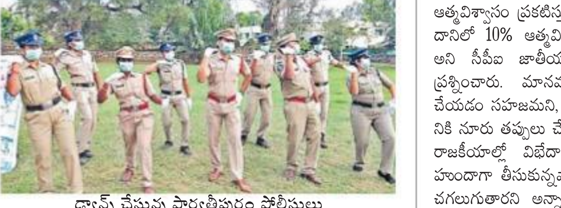
ద్యాన్స్ చేస్తున్న పార్వతీపురం పోలీసులు

ఆకట్టుకుంటున్న పార్వతీపురం పోలీసుల వీడియో