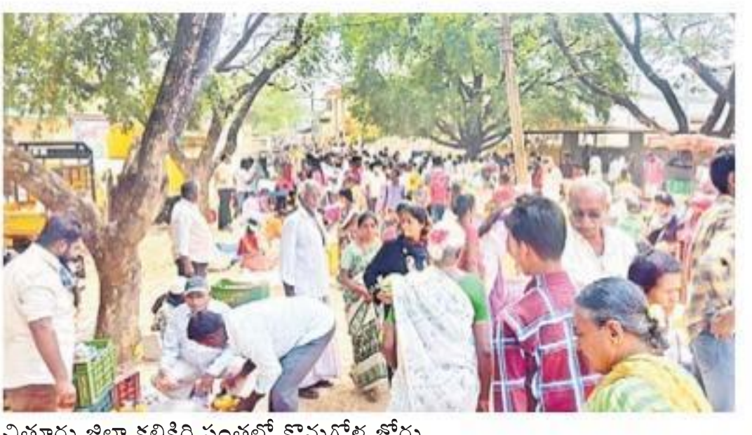
విత్తూరు జిల్లా కలికిరి సంతలో కానుకగళ్ల జోరు

న్నాయి. జిల్లా యంత్రాంగం, స్థానిక పోలీసు, మున్సిపల్ యంత్రాంగాలు అలసటగా స్వయంధిచి, పరిస్థితిని అదుపులోకి తెచ్చాయి. జనం గుంపుగా లేకుండా చూశారు. అటోలను అడ్డుకున్నారు. మరోసారి కనిపిస్తే వాహనాలు సీట్ చేసి కేసులు పెడతామని హెచ్చరించారు. దుకాణాలు కూడా బలవంతంగా మూయించారు. మంగళవారం నుంచి ప్రజారవాణా బరిగినా, నిత్యవసర దుకాణాలు మినహా మిగిలిన షాపులు తెరిచినా కేసులు పెడతామని హెచ్చరించారు.