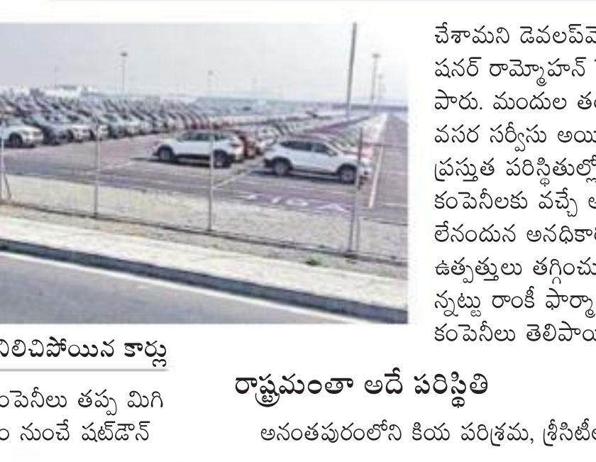
లాక్డౌన్తో కీయ పరిశ్రమలో నిలిచిపోయిన కార్లు తయారు చేసే నాలుగు పార్కు కంపెనీల తప్ప మిగిలిన 59 పరిశ్రమలను సోమవారం నుంచే షట్డౌన్

కీయ కార్ల పరిశ్రమ లాక్డౌన్.. శ్రీసీటీలో కంపెనీల మూసివేత 31 వరకూ షార్ట్ సెలవులు.. చైనా బొమ్మల తయారీ నిలిపివేత