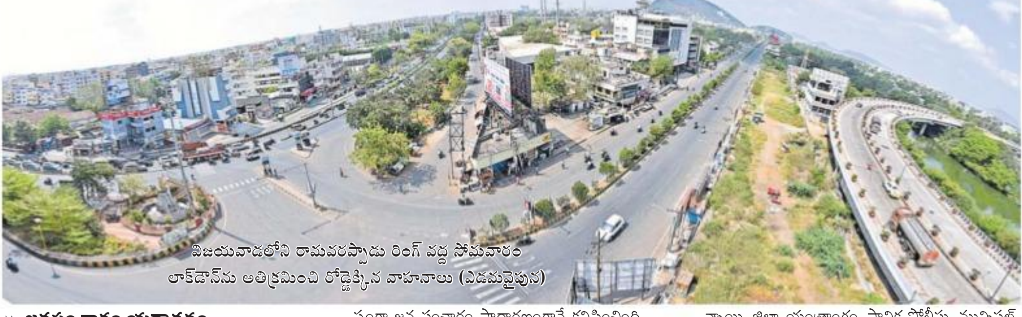
విజయవాడలోని రామవరప్పాడు రింగ్ వద్ద సోమవారం లాక్డౌన్ ను అతివ్రేమించి రోడ్డుకి వాహనాలు (విడిచివేయడం)

జనసంచారం యధాతథం నేటి నుంచి రాష్ట్రంలో కఠిన చర్యలు (ఆంధ్రజ్యోతి-స్వస్థ్ నెట్వర్క్)