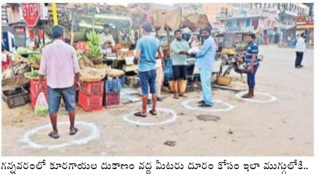
గచ్చవరంలో కార్యకార్యం దుకాణం వద్ద మీటరు దూరం కోసం ఇలా ముగ్గులోకి..