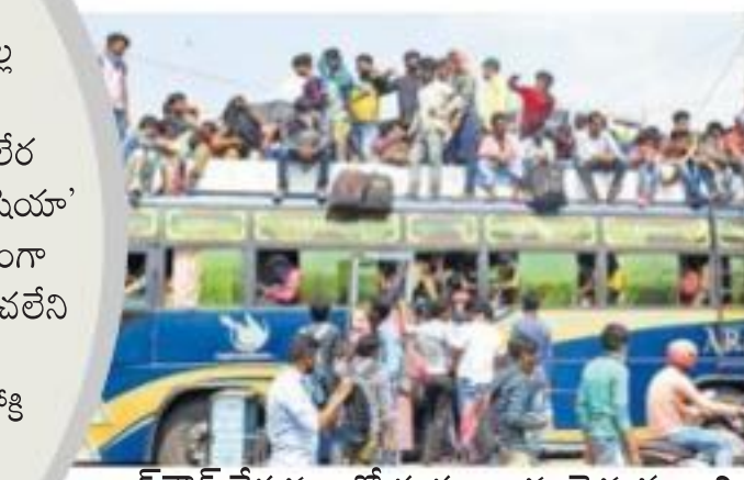
లాక్డౌన్ నేపథ్యంలో స్వచ్ఛలాలకు వెళ్తున్న కార్మికులు

బెంగాల్లో ఉత్తర 24 పరగణాల జిల్లాకు చెందిన తెరుచుకోలేదు.. అవీను తలుపులు మూసి ఉన్నాయి. తోపుడు బట్ట కానరాలేదు. చాలా అరకొరగా జనసంచారం. హోటళ్ల, తినుబండారపు స్టాళ్లన్నీ 80% బండ్! జనం ఇళ్లకే పరిమితమయ్యారు. కరోనా దాడికి భారతావని మొత్తం సుందీరింది. ఎక్కడ చూసినా దాదాపుగా కర్ఫ్యూ వాతావరణమే. పరిస్థితి విషమించిన వేళ.. ప్రభుత్వం లాక్డౌన్ ప్రకటించడంతో సర్వం మూతపడ్డాయి. అధికారిక సమాచారం ప్రకారం 20 రాష్ట్రాల్లో లాక్డౌన్ సంపూర్ణంగా అమలయింది. మరో 6 రాష్ట్రాల్లో పాక్షికంగా వర్తించే అవుతుంది. కరోనా మృతుల సంఖ్య 9 కి పెరిగింది. తాజాగా వచ్చి