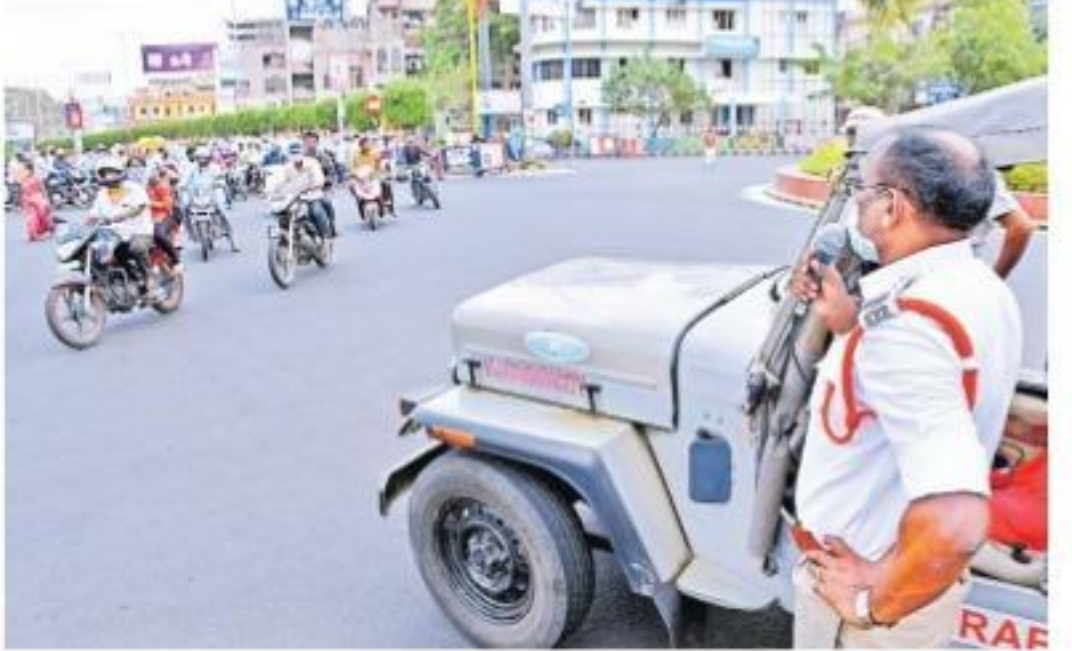
విజయవాడ పోలీసు కంట్రోల్ రూమ్ వద్ద వాహనదారులకు మైక్తో హెచ్చరికలు