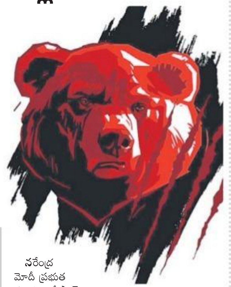
వరల్డ్ మోడి ప్రభుత్వ హయాంలో స్టాక్ మార్కెట్లు అల్లించిన లాభాలు కరోనా దాటికి పూర్తిగా తుడిచిపెట్టుకుపోయేలా ఉన్నాయి. 2014 మే 26న మోడి బారక ప్రధానిగా తొలిసారి ప్రమాణ స్వీకారం చేశారు.

ముంబై: కరోనా రకస్యని కట్టడి చేసేందుకు పలు రాష్ట్రాలు లాక్ డౌన్ ప్రకటించడంతో డలల్ స్టీట్ బెంబేలెత్తిపోయింది. బేర ప్రోక్షకుల మార్కెట్ మళ్లీ కుప్పకూలింది. సెన్సెక్స్ నిఫ్టీ మార్కెట్ చరిత్రలో అతి పెద్ద పతనాన్ని నమోదు చేసుకున్నాయి. ఒకే ట్రేడింగ్ సెషన్లో సెన్సెక్స్ డాడూ 4,000 పాయింట్లు, నిఫ్టీ 1,100 పాయింట్లకు పైగా పడిపోవడం ఇదే తొలిసారి. ట్రేడింగ్ ప్రారంభమైన తొలి గంటలోనే సూచీలు 10 శాతం పైగా పతనమై లోయర్ సర్క్యూల్స్ ను తాకటంతో ఎక్స్చేంజీలు ట్రేడింగ్ ను 45 నిమిషాల పాటు నిలిపివేశాయి. ట్రేడింగ్ పునఃప్రారంభమయ్యాక కూడా సవ్షాల పరంపర కొనసాగింది. నష్టాలు మరింతగా పెరిగాయి కూడా. దీంతో స్టాక్ మార్కెట్ వరల్డ్ సంపద ఒక్క రోజులోనే రూ.14 లక్షల కోట్లకు పైగా హరించుకుపోయింది. ట్రేడర్లు అమ్మకాలు పోట్లెత్తించడంతో సెన్సెక్స్ లోని 30 లిస్టెడ్ కంపెనీల షేర్లు నష్టపోయాయి. చిన్న, పెద్దా అనే తేడా లేకుండా అన్ని కంపెనీల షేర్లు చితికిపోయాయి. అన్ని రంగాల సూచీలూ నేలచూజులు చూశాయి. మహా ఆర్థిక మాంద్యం భయాలుతో ప్రపంచ మార్కెట్లు నష్టాల బాటలోనే పయనించాయి. ఈ పతనం ఎందుకా? మార్కెట్ షేకవేడలా కూలుతున్నప్పుడు విద్యుద సంఘం ముగిసాక మొత్తం నష్టాన్ని బేరీజు వేసుకోవాలి తప్ప ముందుగానే అంచనా వేయలేమని మార్కెట్ వర్గాల న్నాయి. ప్రస్తుతం సూచీల పతనానికి ఏ స్పాల్లో అద్భుతమైన పడుతుందిని చెప్పడం కష్టమేనని అభిప్రాయ పడుతున్నారు. 6,200 స్టాయికి నిఫ్టీ? మార్కెట్ టెక్నికల్ వార్షులు ఇంకా బేరిష్డ్ ట్రెండ్ నే కనబరుస్తున్నాయని మార్కెట్ విశ్లేషకులు అంటున్నారు. నిఫ్టీ మరో 1,500-1,600 పాయింట్ల వరకు పతనమై 6,200 స్టాయికి చేరవచ్చులున్నారు.