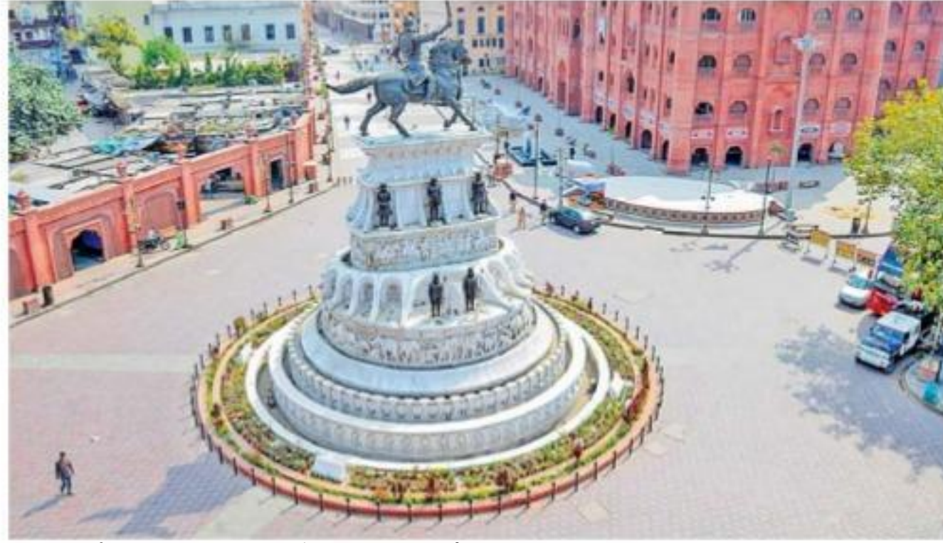
పంజాబ్లో కర్ఫ్యూ విధించడంతో జనసంచారం లేని అమ్మవోసర్ ప్రధాన కూడలి

9 మంది మృతి.. 478 కేసులు.. 20 రాష్ట్రాలు లాక్డౌన్