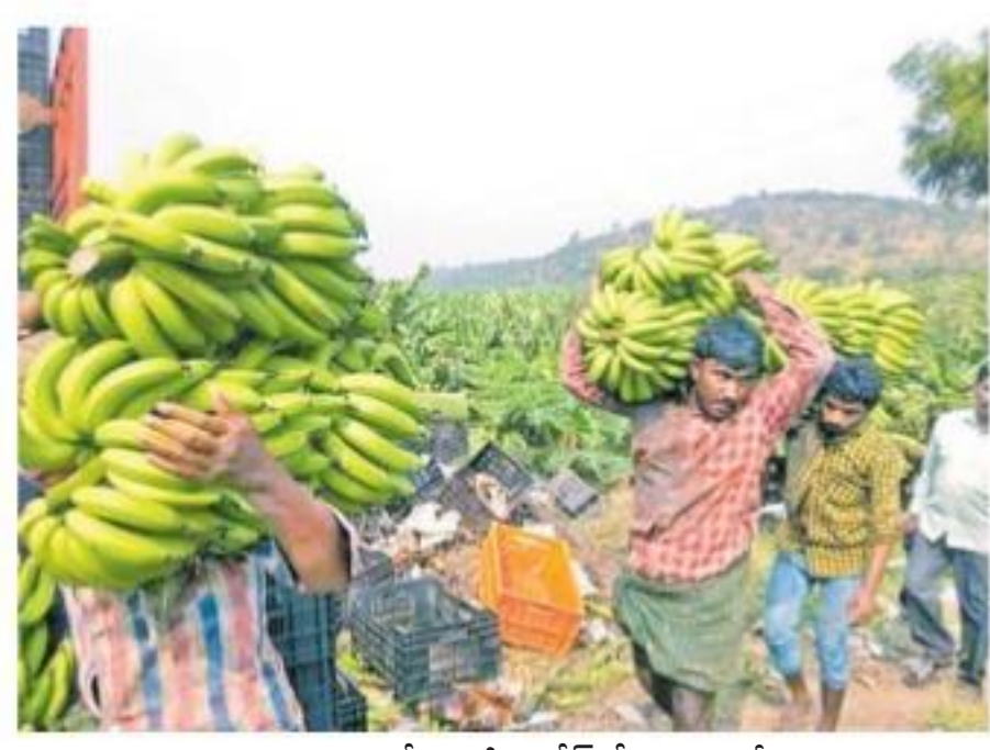
కడప లింగాలలో అరటిని లోడ్ చేస్తున్న కూలీలు