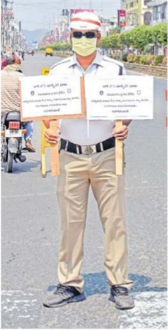
ఈనెల 31 వరకు లాక్డౌన్ విధించిన విషయాన్ని విజయవాడలో ప్రకారాలతో తెలియజేస్తున్న కానిస్టేబుల్