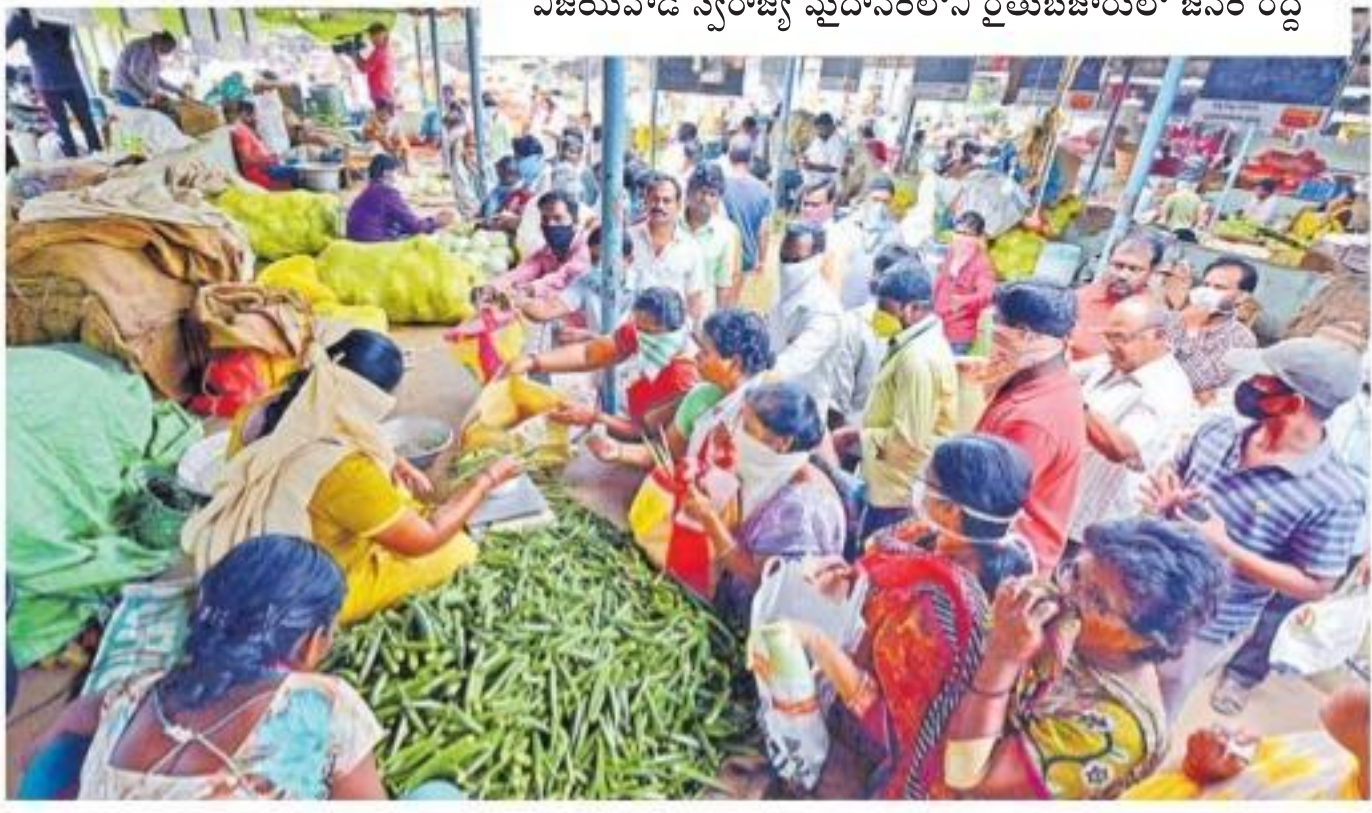
విజయవాడ స్వరాజ్య మైదానంలోని రైతుబజారులో జనం రద్దీ