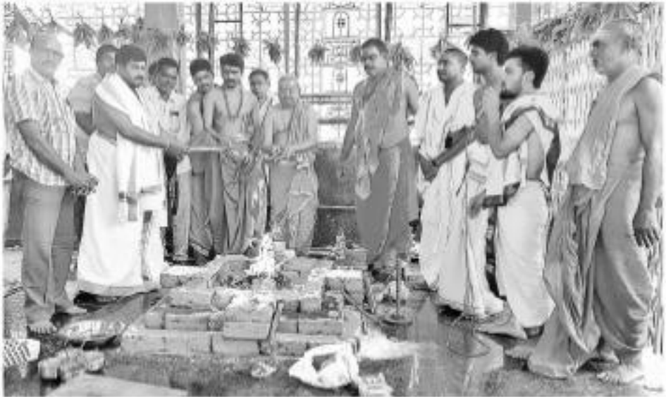
కరోనా వైరస్ వ్యాప్తిని నివారణార్థం సమస్త జనాభాకి ప్రాణాహిని రాకుండా సోమవారం మహబూబాబాద్ జిల్లా కురవి మండల కేంద్రంలోని భద్రకాళి సమేత శ్రీ వీరభద్రస్వామి ఆలయంలో అర్చకులు మృత్యుంజయ హోమం నిర్వహించారు. - కురవి