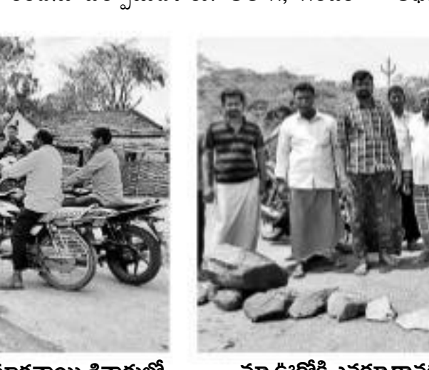
మా ఊర్లోకి ఎవరూ రావద్దంటూ రోడ్లకు అడ్డుగా రాళ్ళు పెట్టిన సూర్యాపేట జిల్లా కోదాడ మండలం కూబిపూడి గ్రామస్థులు