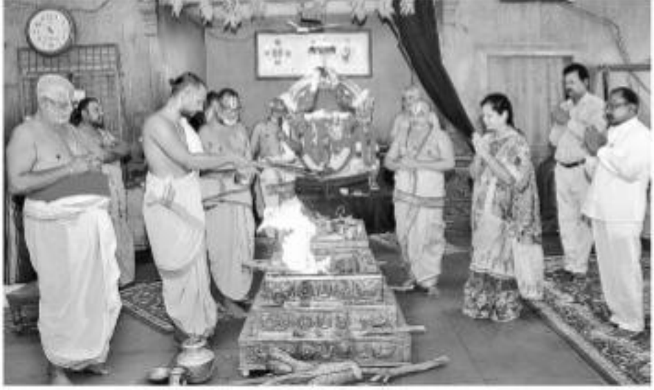
కరోనా బారినంది విశ్వమానవాళిన రక్షించాలని వేడుకుంటూ సోమవారం యాదాద్రి శ్రీ లక్ష్మీనరసింహ స్వామి ఆలయంలో సుదర్శన నారసింహ, ధన్యంతరిత హోమాలు నిర్వహించారు. - యాదాద్రి భువనగిరి జిల్లా ప్రతినిధి, నమస్తే తెలంగాణ