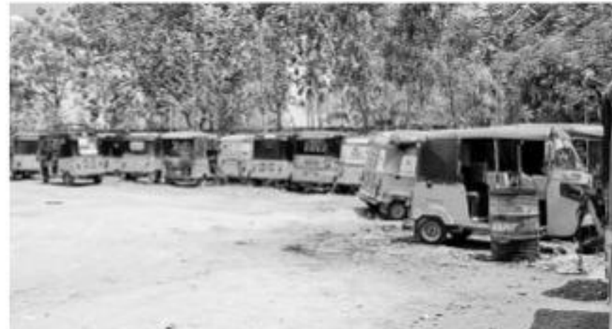
వనపర్తి జిల్లా కేంద్రంలో పోలీసులు సీజ్ చేసిన అటోలు