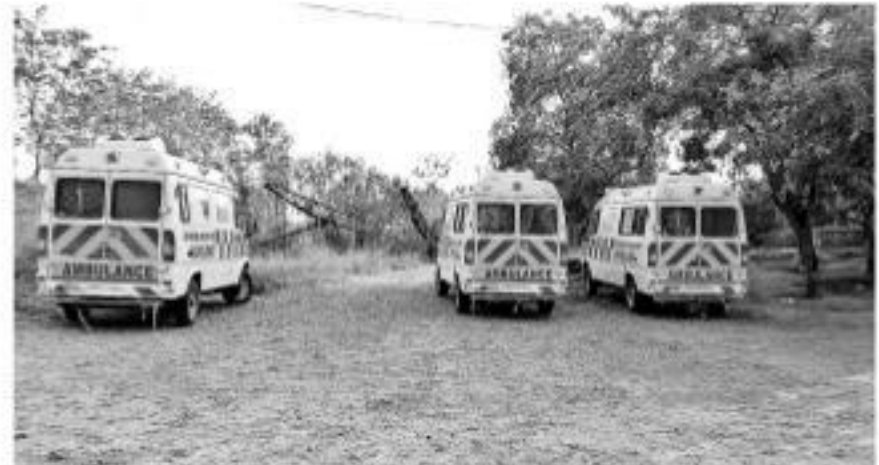
సూర్యాపేట జిల్లా కోదాడలో ప్రయాణికులను తరలిస్తూ పట్టుబట్టడం అమలెస్తులు