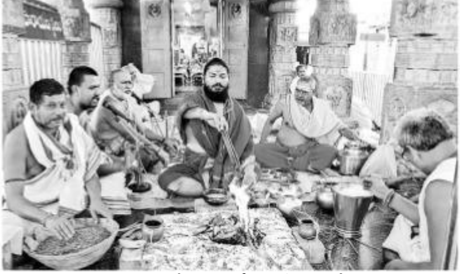
కరోనా వైరస్ నివారణార్థం వేములవాడ శ్రీ పార్వతి రాజరాజేశ్వర స్వామివారి దేవస్థానంలో సోమవారం హోమాలు నిర్వహించారు. రాజస్థాన, ఆంధ్రప్రదేశ్ మండలంలో మహమ్మత్తుజ్వరం, సునర్షణ, ధన్యంతరిత హోమాలు ఆలయ అర్చకులు ఘనంగా జరిపారు. - వేములవాడ కల్యాణం