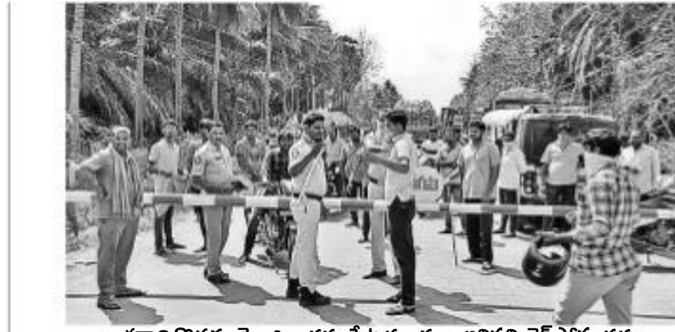
భద్రాద్రి కొత్తగూడెం జిల్లా దమ్మపేట మండలం అల్లిపల్లి చెక్ పోస్టు వద్ద ఆంధ్రా నుంచి వస్తున్న వాహనాలను నిలిపేసిన పోలీసులు