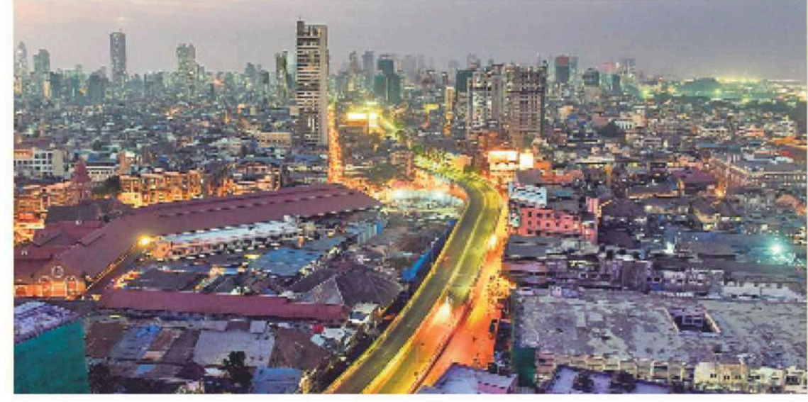
లాక్డౌన్ నేపథ్యంలో శుక్రవారం సాయంత్రం నిర్మాణస్థాయిగా మారిన ముంబైలోని రోడ్డు

కరోనా వైరస్ పై ముందే హెచ్చరిక! నిజమవుతున్న నోబెల్ గ్రహీత లెవిట్ అంచనాలు