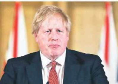
బ్రిటన్ ప్రధాని బోరిస్ జాన్సన్