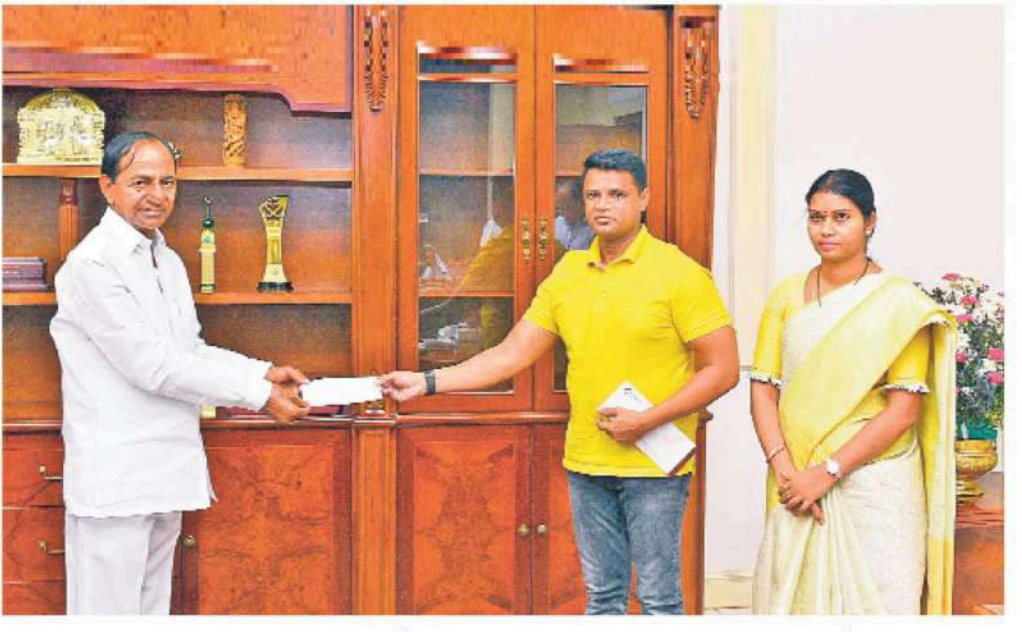
ముఖ్యమంత్రి సహాయనిధికి కోటి రూపాయల విరాళం చెక్కును శుక్రవారం ప్రగతిభవన్ లో సీఎం కే చంద్రశేఖరరావుకు అందజేస్తున్న కోహినూర్ గ్రూప్ చైర్మన్ మహ్మద్ అహ్మద్ ఖాన్

ప్రజలకు ధన్యవాదాలు. చాలా మంది సహకారం అందిస్తున్నారు. ఇలా అందరి సహకారం లేకపోతే పరిస్థితి చాలా భయంకరంగా ఉండేది. మనందరి బతుకులు ప్రమాదంలో పడేవి. పూర్తిస్థాయిలో లాక్డౌన్ చేసి రాత్రి వేళల్లో కర్ఫ్యూ అమలుచేస్తున్నా ఒక్క శుక్రవారం పది పాజిటివ్ నమోదయ్యాయంటే పరిస్థితి తీవ్రతను అర్థం చేసుకోవాలి. అమెరికా, చైనా, స్పెయిన్, ఇటలీ స్థాయిలో భారత్ లో కూడా కరోనా వ్యాప్తి 20 కోట్ల మంది జబ్బులారని పడే అవకాశం ఉందని నిపుణులు చెబుతున్నారు. - ముఖ్యమంత్రి కే చంద్రశేఖరరావు