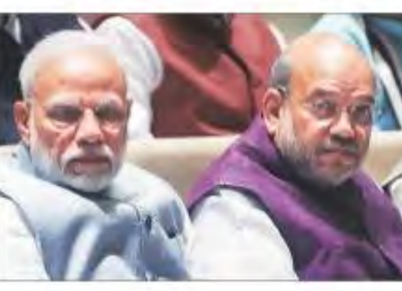
भाजपा संसदीय दल की बैठक में पीएम ने कहा, इसके लिए पहली जरूरत एकता और सौहार्द

सोशल मीडिया अकाउंट छोड़ने पर विचार करने के ट्वीट को लेकर जारी अटकलों पर विराम लगाते हुए प्रधानमंत्री नरेंद्र मोदी ने मंगलवार को कहा कि वह आठ मार्च को अपना सोशल मीडिया अकाउंट उन महिलाओं को सौंपेंगे, जिनका जीवन व कार्य प्रेरणा देने वाले हों। उन्होंने लोगों से ऐसी महिलाओं की गाथा उनके साथ साझा करने का अनुरोध किया है।