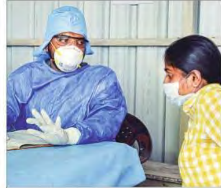
हैदराबाद के एक अस्पताल में अमेरिका से लौटी एक युवती की मंगलवार को जांच करते चिकित्सा अधिकारी

स्वास्थ्य विभाग के अधिकारियों के मुताबिक शहर के एक स्कूल के तीन बच्चों समेत छह लोगों में कोरोना वायरस के लक्षण मिलने की जानकारी मिली है। इसके बाद स्वास्थ्य विभाग की टीम ने सेक्टर-135 स्थित श्री राम मिलेनियम स्कूल का दौरा किया। यह जानकारी मिलने के बाद केंद्र सरकार की एक टीम भी श्री राम मिलेनियम स्कूल पहुंची। नमूनों की जांच रिपोर्ट अभी नहीं आई है लेकिन स्कूलों को पूरी तरह से क्वॉंटानु मुक्त (सेनेटाइज) करने के लिए तीन दिन तक बंद रखा जा रहा है। स्कूल के पांच बच्चों को उनके घर में ही अलग (आइसोलेट) रखा जा रहा है। वहीं, सीएमओ अनुराग भागवत ने बताया कि एक अन्य शिव नाडर स्कूल ने एतिहातन स्वतः ही 9 मार्च तक स्कूल बंद रखने की सूचना दी है। कोरोना वायरस को लेकर जिला प्रशासन ने हेल्प नंबर जारी किए हैं। बुखार, जुकाम और सांस लेने में दिक्कत होने पर इन नंबर पर फोन कर सकते हैं। स्वास्थ्य विभाग की टीम घर पर जाकर ऐसे संदिग्ध मरीजों के नमूने लेगी। बाकी पेज 8 पर