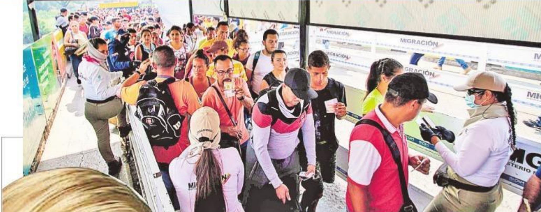
కరోనా వైరస్ భయాందోళనల నేపథ్యంలో కొలంబియాలోని సైమన్ బోలివార్ ఇంటర్నేషనల్ వంతెన వద్ద మాస్కులు ధరించిన ప్రయాణికుల వర్తాలను పరిశీలిస్తున్న వలస విభాగ అధికారులు