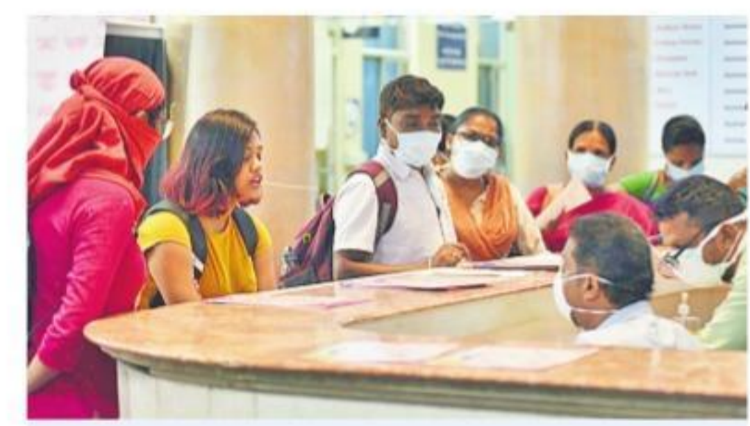
గాంధీ దవాఖానలో ఏర్పాటుచేసిన కరోనా హెల్త్ డెస్క్

తయారీలో మనమే టాప్ అయినా.. నిజానికి జనరల్ ఔషధాల తయారీలో భారత్ అగ్రస్థానం. ప్రపంచవ్యాప్తంగా జరుగుతున్న జనరల్ ఔషధాల సరఫరాలో భారత్ వాటా 20 శాతంగా ఉన్నది. అయితే వీటి తయారీకి కావాల్సిన ముడి పదార్థాలలో మూడింటా రెండు వంతులు చైనా నుంచే వస్తున్నాయి. కానీ కరోనా వైరస్ గుట్టల్లో ఉత్పత్తి అవుతున్న పార్మాసెయూటికల్స్ అంక్షలు వర్తిస్తాయి. ఇప్పుడు వీటిని అంతర్జాతీయ మార్కెట్లో ఉన్నట్లు తెలుసుకున్నాం. అంక్షలు పెట్టబడ్డాయి. అంక్షలు పెట్టబడ్డాయి.