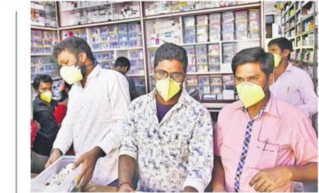
గాంధీలో కరోనా మాస్కులు ధరించిన విద్యుల నిర్వహిస్తున్న మేడికల్ దుకాణం నిబంధన

కొవిడ్-19 గాలి ద్వారా వ్యాపించదని మంత్రి ఈటల స్పష్టంచేశారు. కరోనా వైరస్ ఉన్నవారు మాట్లాడుతున్నప్పుడు తుంపర్లు ఇతరులపై పడితే వైరస్ వ్యాప్తిచెందే అవకాశం ఉంటుందని.. బిస్కెట్లు, క్రెజ్ల ప్రయోజనీ ఇతరులకు నష్టం చేయవలసి తెలిపారు. కొవిడ్-19 హాల్స్ లైన్ నందు 104 ఏర్పాటుచేసినట్లు చెప్పారు. కొంతకాలం షేక్ డౌన్ చేస్తున్నట్లు.. సన్నిహితులు,