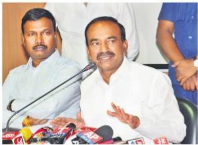
మంగళవారం మీడియాతో మాట్లాడుతున్న వైద్యఆరోగ్యశాఖ మంత్రి ఈటల రాజేందర్

కరోనా వైరస్ ఉష్ణోగ్రత తక్కువ ఉన్నచోట మాత్రమే జీవించే ఆస్కారం ఉంటుంది. మనవద్ద ఉష్ణోగ్రతలు అధికంకావడంతో అది వ్యాప్తిచెందే అవకాశం చాలా తక్కువ. ఈ వైరస్ సోకినవారిలో ఇప్పటివరకు 3 శాతం మరణాలు కూడా లేవు. వైరస్ పాజిటివ్ గా తేలిక యువకుడిని గాంధీలో ప్రత్యేకవార్డులో ఉంచి వైద్యులు చికిత్స అందిస్తున్నారు. అతడి పరిస్థితి నిలకడగా ఉన్నది.