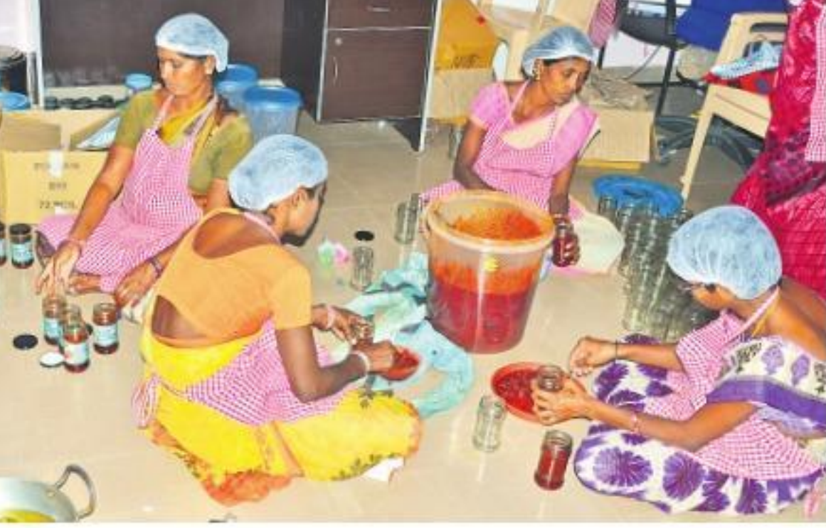
సిద్దిపేట జిల్లా ఇర్కోడులో పచ్చళ్లు ప్యాకేజీస్తున్న మహిళా సంఘం సభ్యులు (ఫైల్)

కల్తీలేని ఆహార పదార్థాల తయారీ కేంద్రాల ఏర్పాటు అంతర్జాతీయ ప్రమాణాలతో సరుకుల తయారీ • దేశ, విదేశాలకు ఎగుమతి • రేషన్ డీల్లర్ ద్వారా రాష్ట్రంలో సరఫరా పంటలవారిగా జిల్లాల్లో పరిశ్రమల స్థాపన • మహిళా సంఘాల ఆధ్వర్యంలో క్రయవిక్రయాలు రైతులకు గిట్టుబాటు ధర • యువతకు ఉపాధి అవకాశాలు • ప్రాథమిక నివేదికలు, ప్రణాళికలు సిద్ధం