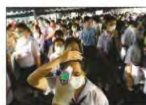
बैंकाक में गुरुवार को परीक्षा देने पहुंचे स्कूली छात्रों का स्वास्थ्य परीक्षण करते स्वास्थ्य कर्मचारी।

मुसीबत के समय अस्थायी तौर पर स्कूलों को बंद करना नई बात नहीं है। वर्तमान के वैश्विक संकट से शिक्षा में काफी व्यवधान आया है। यदि यह बरकरार रहता है तो यह शिक्षा के अधिकार के लिए खतरा हो सकता है। -ऑडरे अजुले, यूनेस्को प्रमुख