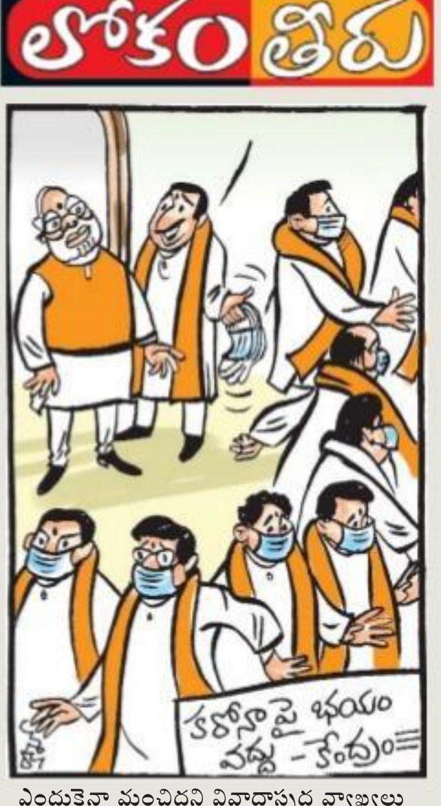
ఎందుకైనా మంచిది వివాదాస్పద వ్యాఖ్యలు చేయకుండా ఇలా ఏర్పాటు చేశామ సారీ...!