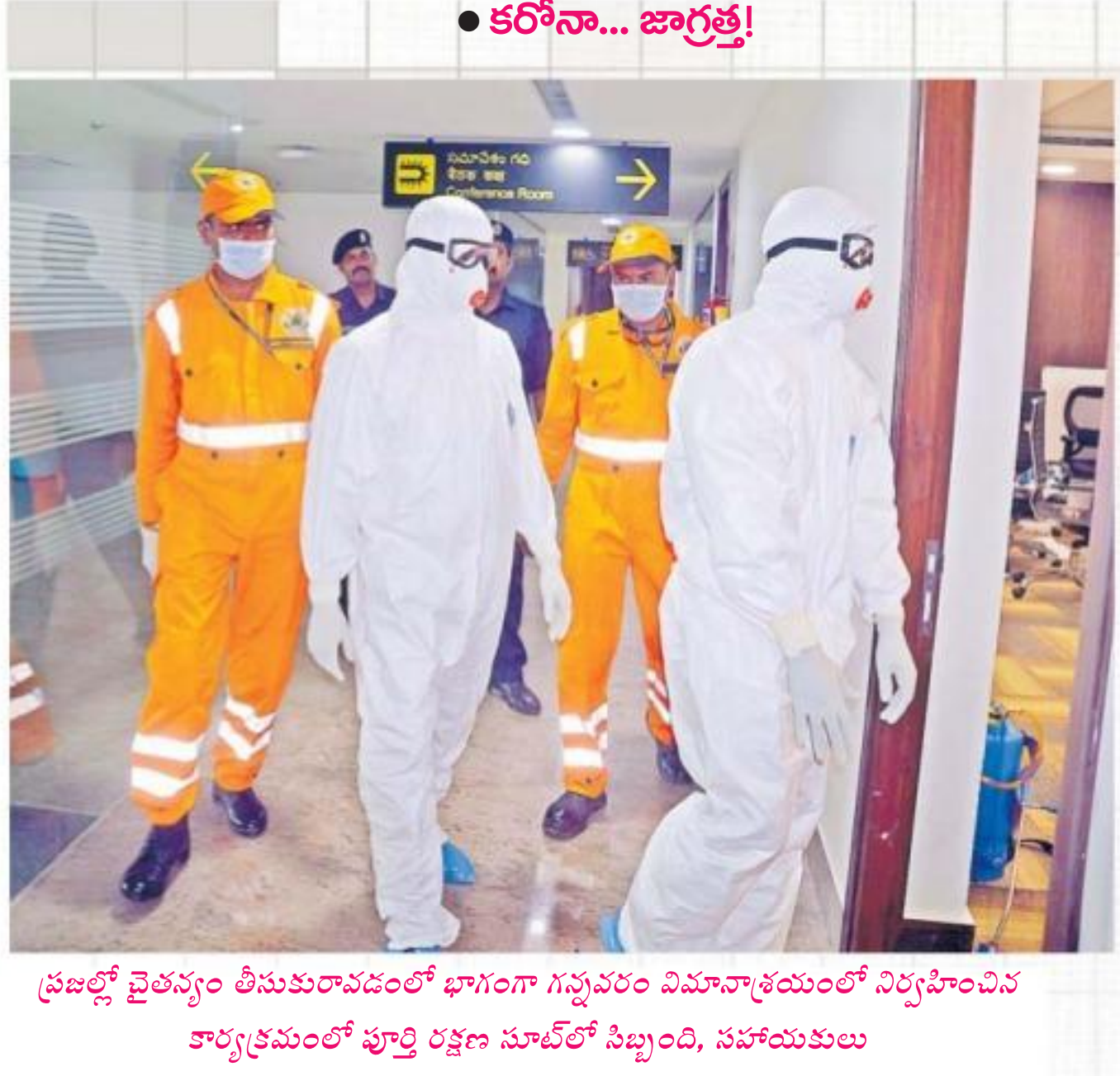
ప్రజల్లో చైతన్యం తీసుకురావడంలో భాగంగా గిన్నెవరం విమానాశ్రయంలో నిర్వహించిన కార్యక్రమంలో పూర్తి రక్షణ సూట్లో సిబ్బంది, సహాయకులు

శుక్రవారం 6-3-2020 పేజీలు: 12 + 16 వెల (Price) : Rs. 6.50 సంపుటి (Volume) : 60 సంచిక (Issue) : 321 శ్రీవివేకానంద స్వామి, ఉత్తరాయణం, 99వ రోడ్డు, పాల్వంచ, పువ్వపేట, రి.డి. ఏ.ఎం.సి. కి. 11.48 తదుపరి ద్వారా; నక్షత్రం: పునర్వసు కి. 10.39 తదుపరి పువ్వు; వర్షం: సా. 6.08-7.97, దుర్భహారం: కి. 8.55-9.42, మ. 12.50-1.38, అమృతపానీయం: కి. 8.19-9.52, కి. 3.06-4.36, రావణకాలం: కి. 10.30-12.00, సూర్యోదయం: 6.34, సూర్యాస్తమయం: 6.20 విజయవాడ సీట్ Vijayawada | Hyderabad | Mahabubnagar | Tirupathi | Visakhapatnam | Anantapur | Karimnagar | Tadepalligudem | Warangal | Guntur | Kurnool | Nellore | Srikakulam | Rajamahendravaram | Khammam | Kadapa | Ongole | Nallagonda | Nizamabad and Bangalore