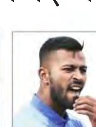
हार्दिक पंड्या ने अपना आखिरी एक दिवसीय विश्व कप के सेमी फाइनल में न्यूजीलैंड के खिलाफ खेला था।

से वापसी करेंगे। टीम में धवन की वापसी से मयंक अग्रवाल को बाहर का रास्ता देखा पड़ा जो न्यूजीलैंड दौरे पर मिले मौकों को फायदा उठाने में नाकाम रहे। पृथ्वी साव को