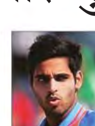
भुवनेश्वर का हर्निया का ऑपरेशन हुआ था। उन्होंने राष्ट्रीय क्रिकेट अकादमी में अपना रिहैबिलिटेशन पूरा किया।