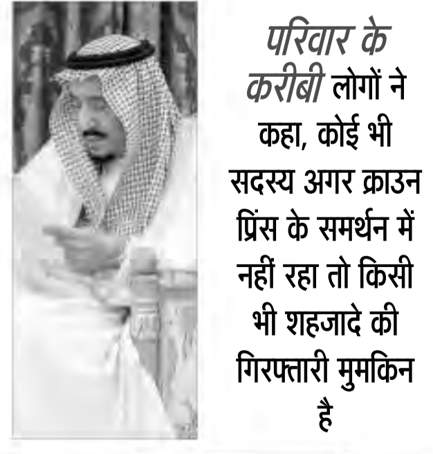
सऊदी अरब के युवराज (क्राउन प्रिंस) मोहम्मद बिन सलमान

कर चुके हैं और साम्राज्य के भीतर सुरक्षा एवं निगरानी का काम देखते थे। शाही सरकार के करीबी एक व्यक्ति ने बताया कि यह कदम यह जानते हुए भी चैकाने वाला था कि शहजादे मोहम्मद बिन नयेफ (60) पर करीब से नजर रखी जाने की चर्चा आम थी। शाह के बेटे द्वारा 2017 मध्य में उत्तराधिकारी के उम्मीदवार की