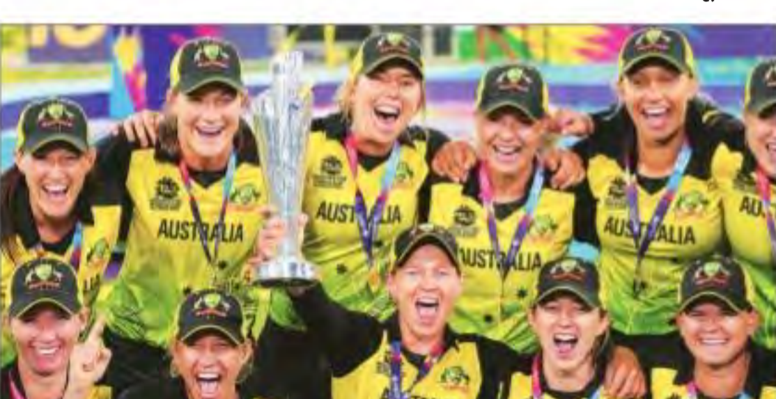
महिला टी20 विश्व कप ट्रोफी के साथ आस्ट्रेलियाई टीम।

रन टूर्नामेंट में बनाए आस्ट्रेलिया की मूनी ने