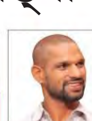
शिवर धवन का कंधा जनवरी में आस्ट्रेलिया के खिलाफ घरेलू एक दिवसीय मैच के दौरान चोटिल हो गया था।

चयन समिति के नए अध्यक्ष सुनील जोशी की अगुआई में पहली बार टीम चुनी गई। टीम में अनुभवी केदार जाधव की जगह शुभमन गिल को शामिल किया गया है जिससे यह समझा जा रहा है कि जाधव के लिए अब वापसी करना मुश्किल होगा। उपकप्तान रोहित शर्मा हालांकि मांसपेशियों की खिंचाव से नहीं उबर पाए हैं और उम्मीद है कि वह 29 मार्च से शुरू हो रही इंडियन प्रीमियर लीग