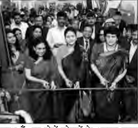
उपलब्ध हैं। इन दोनों स्टेशनों के अलावा एक्वा लाइन के सभी 21 स्टेशनों पर सेनेटरी नैपकिन वॉडिंग मशीनें भी लगाई गई हैं। ये मशीनें सेनेटरी नैपकिन को मुफ्त में वितरित करेंगी। इस मशीन को संचालित करने के लिए टोकन सभी स्टेशनों के कस्टमर केयर काउंटर पर उपलब्ध होंगे।