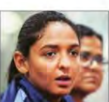
आस्ट्रेलिया ने पहले बल्लेबाजी करते हुए चार विकेट पर 184 रन बनाने के बाद भारत की पारी को 99 रन पर समेट दिया। हरमनप्रीत ने मैच के बाद कहा कि हमने लीग मैचों में जिस तरह का खेल दिखाया, वह शानदार था, मुझे अभी भी टीम पर पूरा भरोसा है।

आइसीसी महिला टी-20 विश्व कप के फाइनल में आस्ट्रेलिया के हाथों करारी शिकस्त झेलने के बाद भारतीय कप्तान हरमनप्रीत कोर ने कहा कि उन्हें अपनी टीम पर भविष्य में अच्छे प्रदर्शन को लेकर पूरा भरोसा है। फाइनल से पहले भारतीय टीम ने टूर्नामेंट का हर मुकाबला जीता था लेकिन फाइनल में आस्ट्रेलिया ने उसे खेल के हर विभाग में पछाड़कर अपना पांचवां खिताब जीता।