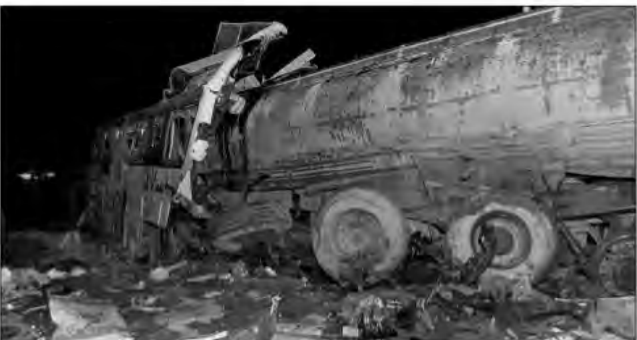
कोविड-19 के संक्रमित लोगों के लिए अस्पताल की छत पर बने शिफ्ट

अमेरिकी सरकार की तरफ से कोविड-19 की रोकथाम की कमान संभाल रहे उप राष्ट्रपति माइक पेंस ने पूर्व में कहा था कि पोत के सभी 3,533 यात्रियों और चालक दल के सदस्यों की कोरोना विषाणु को लेकर जांच की जाएगी और अगर जरूरी हुआ तो उन्हें पृथक रखा जाएगा। देश भर में अब तक करीब 400 लोग विषाणु के संक्रमण की चपेट में हैं और रोजाना दर्जनों मामले सामने आ रहे हैं।