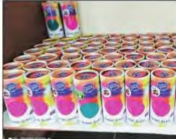
तैयार किया करीब डेढ़ हजार किलो गुलाल 50 हजार रुपए में बिका एक हजार किलो

करना चाहिए। इस बार तिहाड़ में डेढ़ हजार किलो गुलाल बनाया गया है जिसमें एक हजार किलो गुलाल बेचा जा चुका है। जो कि करीब 50 हजार रुपए में बिका। हर्बल गुलाल का सबसे बड़ा फायदा है कि यह त्वचा के लिए बिलकुल सुरक्षित है।