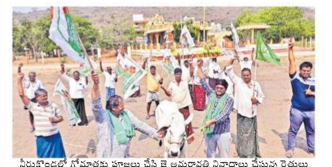
నిరుకాండలో గోమాతకు పూజలు చేసే కై అమరావతి నివాసాలు చేస్తున్న రైతులు

చంద్ర బాబు మంగళవారం తొలిసారి వీడియో కాన్ఫరెన్స్ ద్వారా విలేకరుల సమావేశం నిర్వహించారు. హైదరాబాద్ లోని తన నివాసంలో ఉన్న ఆయన.. జామ్