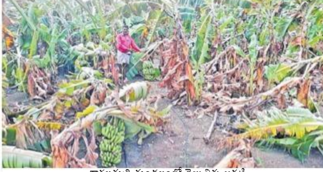
చాగలమర్రి మండలంలో దెబ్బతిన్న ఆరటి