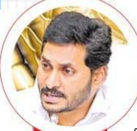
కరోనాతో దాగదు మూతలు

ప్రధాని ముందూ తప్పుడు వివరాలు వీడియో కాన్ఫరెన్స్లో వింత లెక్కలు 20 కేసులు దాటిన జిల్లాలు ఏడు కానీ... మ్యాప్లో కేవలం రెండు జిల్లాలే తీవ్రత తగ్గించి చూపేందుకు తాపత్రయం అన్ని రాష్ట్రాల్లో జిల్లా యూనిట్గా లెక్కింపు ఏపీలో మాత్రం కొత్తగా మండలాల లెక్క సీఎం తీరుపై అధికారుల్లోనే ఆందోళన