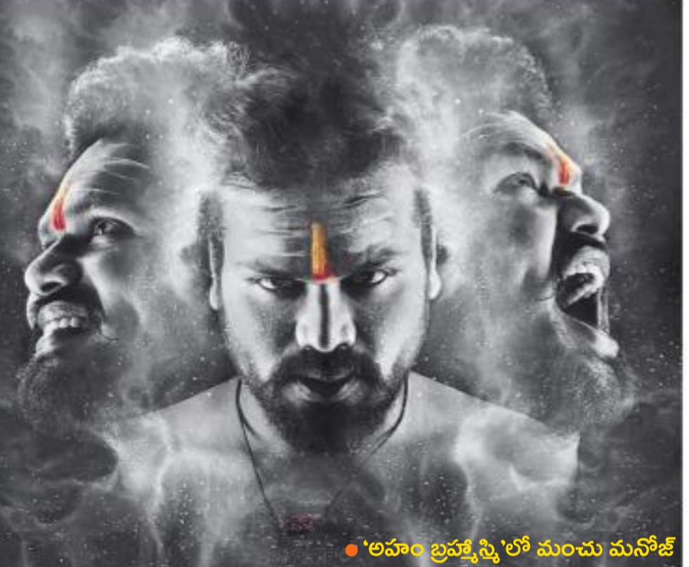
అమెరికన్ బ్రెడ్డింగ్ లో మంచు మనోజ్