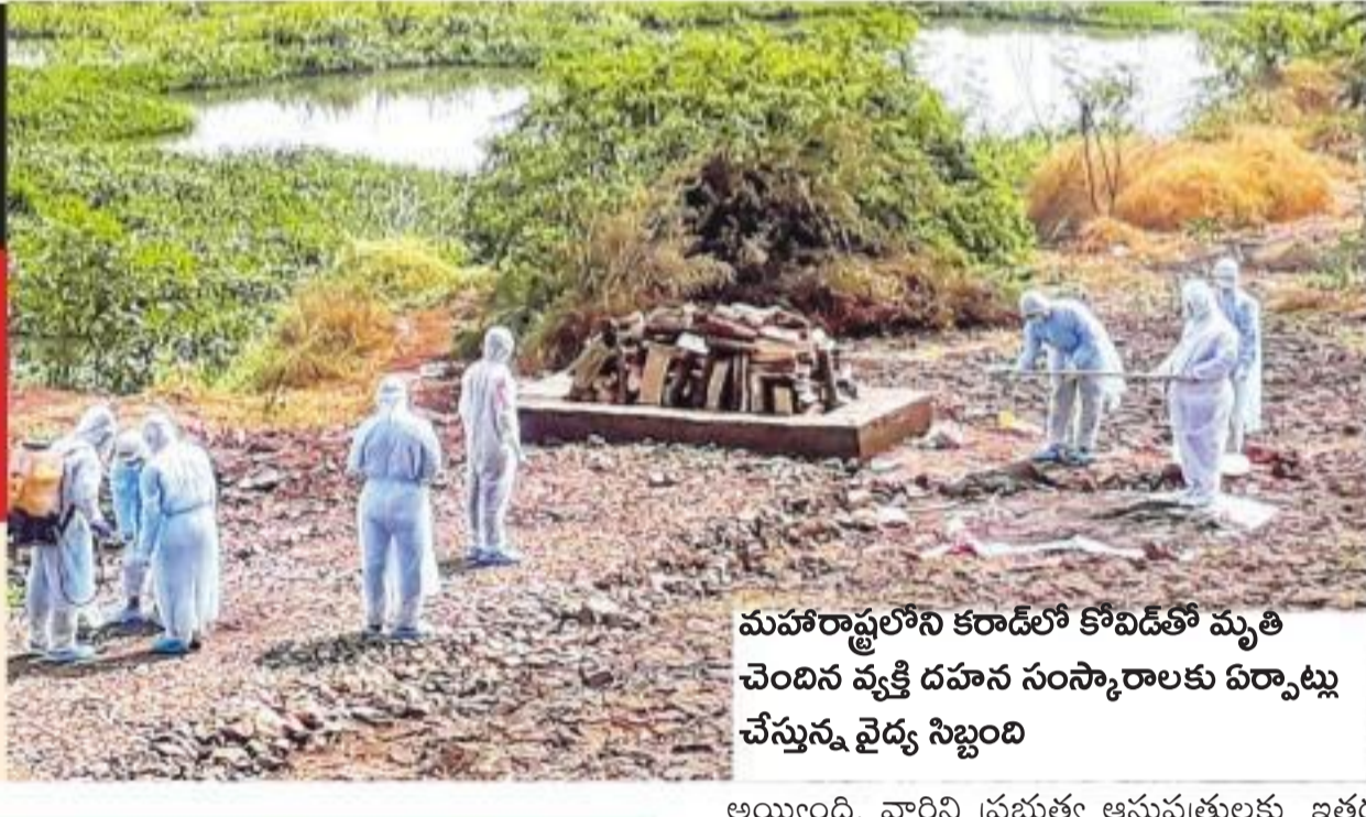
మహారాష్ట్రలో కరాడలో కొవిడ్ కేసుల మృతి చెందిన రహస్య సంస్కారాలకు ఏర్పాటు చేస్తున్న వైద్య సిబ్బంది

అయ్యింది. వారి ప్రభుత్వ ఆసుపత్రులకు, ఇతర రోగిగల సమీపంలోని ప్రైవేట్ ఆసుపత్రుల్లో చేర్చారు. మొత్తం ఆసుపత్రిని కొనివేళ్ళి చేశారు. దేశంలో 80 శాతం కరోనా పాజిటివ్ కేసులు 17 రాష్ట్రాల్లోని 71 జిల్లాల్లోనే సమాధయ్యాయిని ఆరోగ్య శాఖ మంత్రి హర్షవర్ధన్ తెలిపారు. కరోనా వైరస్ కట్టడిలో కువైట్ భారత్ అన్ని విధాలా సహకారం అందిస్తోందని విదేశాంగ మంత్రి ఎస్.జైశంకర్ చెప్పారు. లాక్డౌన్ కారణంగా ఇక్కడ పరిమితమైన కేంద్రమంత్రులు సోమవారం సరే విడుదల చేరనున్నారు. కేంద్ర ప్రభుత్వ సూచన మేరకు వారు విడుదల పున:ప్రాంధించినట్లుగా వైద్య సిబ్బందిని పంపిణీ చేశారు. కరోనా వైరస్ లక్షణాలున్న వ్యక్తిని ఆసుపత్రికి తరలింపేందుకు ప్రయత్నిస్తుండగా కొందరు దుండగులు వైద్య సిబ్బందిపై రాళ్లతో దాడి చేశారు. ఈ ఘటన ఉత్తరప్రదేశ్ రాష్ట్రం మీరట్ లో జరిగింది. ఈ వ్యవహారంలో సంబంధమున్న ఓ ఇమామ్ సహకారం అందిస్తూ నిలిపివేశారు. ఈ ఆసుపత్రిలో ఒక డాక్టర్, 9 మంది పారామెడికల్ సిబ్బందితోపాటు 11 మందికి కరోనా వైరస్ సోకినట్లు నిర్ధారణ