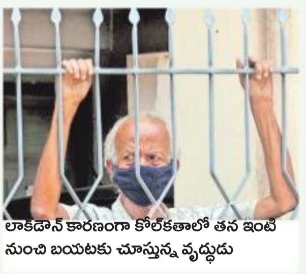
లాక్డౌన్ కారణంగా కొలీకాలలో తన ఇంటి నుంచి బయటకు చూస్తున్న వ్యక్తులు

ఈ వీడియో కాన్ఫరెన్స్ లో రక్షణ మంత్రి రాజ్ నాథ్ సింగ్, హోంమంత్రి అమిత్ షా, ఆరోగ్య శాఖ మంత్రి హర్షవర్ధన్, ఇతర ఉన్నతాధికారులు పాల్గొన్నారు. లాక్డౌన్ కారణంగా కుడేలయిన రాష్ట్రాల ఆర్థిక వ్యవస్థలను అదుపు చేసేందుకు, కోవిడ్-19 పోరు కొనసాగించేందుకు కేంద్రం సాయం అందించాలని పలువురు సీఎంలు ప్రధానిని అభ్యర్థించారు. కరోనా వైరస్ వ్యాప్తిని నిర్మూలన చేసేందుకు అనుమతిని పంజాబ్, ఢిల్లీ ముఖ్యమంత్రిలు అమరీందర్ సింగ్, అరవింద్ కేజ్రీవార్ ప్రధానిని సూచించారు. ఏప్రిల్ ఆఖరు దాకా లాక్డౌన్ కొనసాగించాలని పలు ప్రధాని సూచించారు. పంజాబ్, ఒడిశా రాష్ట్రాల ఇప్పటికే లాక్డౌన్ కొనసాగిస్తూ నిర్ణయం తీసుకున్న విషయం తెలిసింది. ప్రధాని మోదీ తెల్లని వస్త్రంలో చేసిన మాన్యుషు ధరించగా, ఆరోగ్యశాఖ ఉన్నతాధికారులు కూడా మాన్యుషులో ఈ షోలో