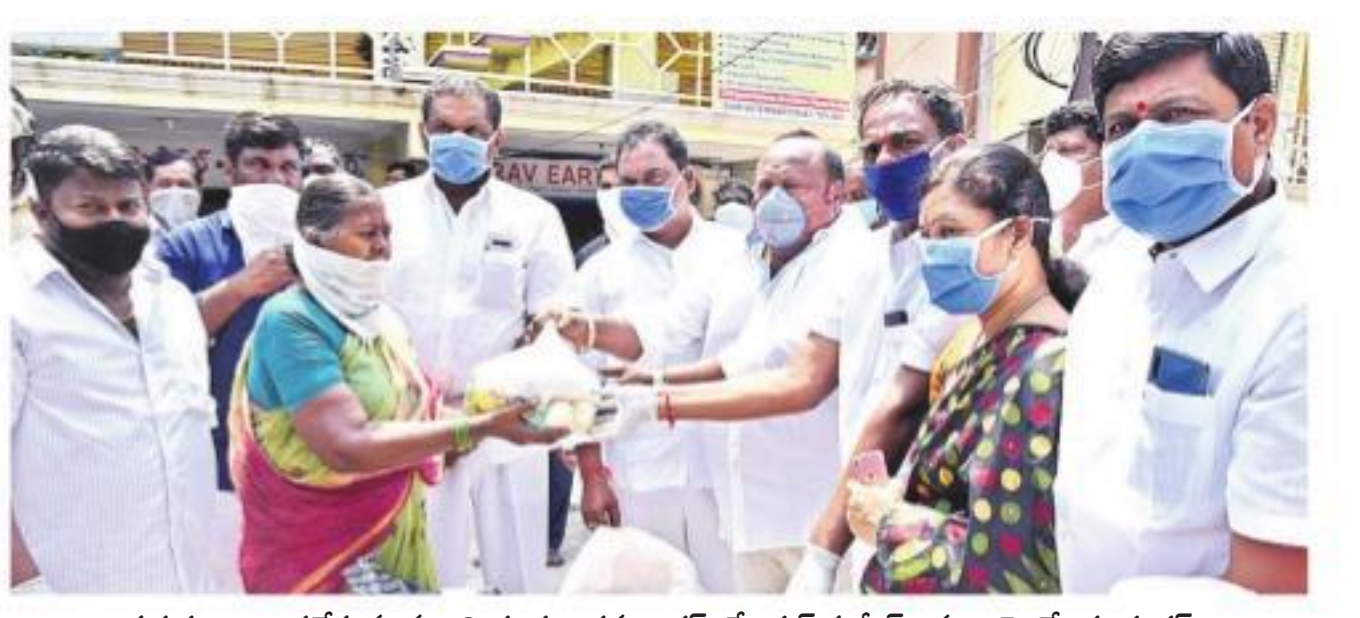
సరుకులు అందజేస్తున్న మంత్రి గంగుల కమలాకర్, మేయర్ సునీల్ రావు, ఎమ్మెల్యే రవిశంకర్

కార్యారోహణ, నమస్తే తెలంగాణ: ధాన్యం కొనుగోళ్లు పకడ్బందీగా చేపడతామని, ఇందుకు కొనుగోలు కేంద్రాల్లో ఏర్పాట్లు చేస్తామని రాష్ట్ర బీసీ సర్కేటుశాఖ మంత్రి గంగుల కమలాకర్ తెలిపారు. కరీంనగర్ కలెక్టరేట్ సమావేశ మందిరంలో బుధవారం ఆయన అధికారులతో సమీక్షా సమావేశం నిర్వహించారు. ఆనంతరం విలేజ్ కలెక్టర్ల మాట్లాడుతూ, కరోనా నేపథ్యంలో ప్రతి గ్రామంలో కొనుగోలు కేంద్రం ఏర్పాటు చేస్తున్నామని, కేంద్రాల వద్ద శానిటైజ్ చేసే చర్యలు చేపడతామని వెల్లడించారు. రైతులంతా బోకెన్ పెడల్లలో ప్రకారమే ధాన్యం తీసుకురావాలని కోరారు.