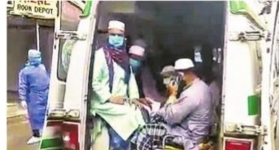
కరోనా అనుమానితులను దవాఖానకు తరలిస్తున్న దృశ్యం