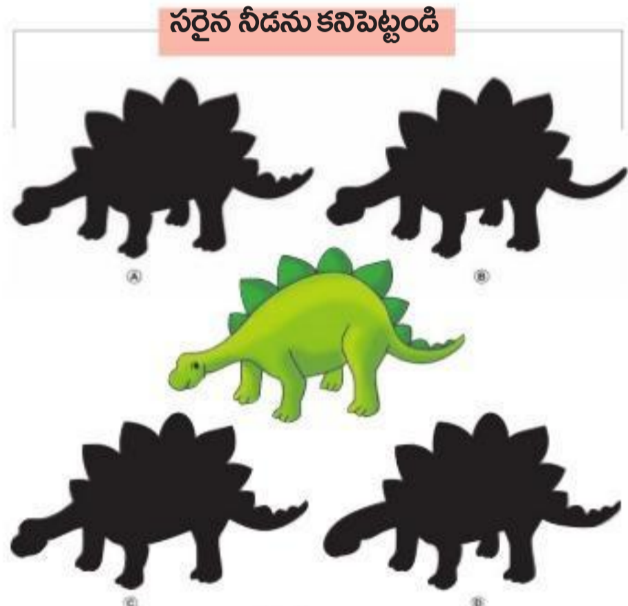
నరైన నీడను కనిపెట్టండి

తండ్రి : ఏంటా.. నా పేరును అక్షరంగా కాకుండా నిలుపుగా రాస్తున్నావు? కొడుకు : మా టీచర్ తండ్రి పేరు నిలబెట్టాలి అని చెప్పారు నాన్నా!! *** టీచర్ : ఏంటీ.. ఇంకా పేరు రావడం ఆలస్యం అయిందేంటి? సుఖీ : మీరే కదా ట్రాఫిక్ రూల్స్ పాటించాలి అని చెప్పారు! టీచర్ : అయితే..? సుఖీ : మరీ.. అక్కడ టోర్ట్ మీద నిద్రాసమే ప్రధానం అని రాసుంది. అందుకే అక్కడి నుంచి ఇక్కడి వరకు మెట్లగా నడిచేసరికి లేటయిపోయింది.