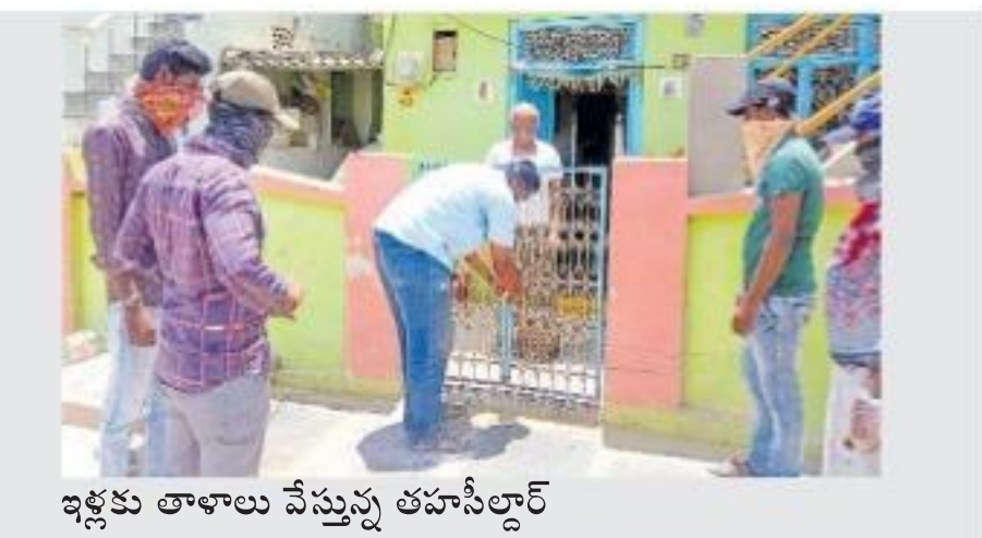
ఇక్కడు తాళాలు వేస్తున్న తహసీల్దార్

అదనంగా మరో ఐదు విభాగాలు... కరోనా నేపథ్యంలో ఉత్తర్వులు జారీ