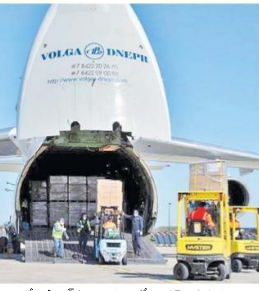
వైద్య పరికరాలతో వాషింగ్టన్ విమానాశ్రయంలో దిగిన చైనా విమానం

'చావు బతుకుల' సమస్య! న్యూయార్క్లో 9/11 తర్వాత అత్యధిక మరణాలు అంత్యక్రియలకు 2 వారాలు వెయిటింగ్ పుస్తకంలో హోమ్స్టేజీ తీవ్రమైన ఒత్తిడి అస్సత్తులతో వెంటిలేటర్లకు కరువు 90 శాతం అమెరికన్లు లాక్డౌన్లోనే! రెండు వారాల్లో కోటి ఉద్యోగాలు మాయం కరోనాపై సమరం కీలక దశకు నెలపాటు ఇళ్లలో ఉంటేనే విజయం: ట్రంప్ న్యూయార్క్, ఏప్రిల్ 3: ఫోన్ రింగ్ అయ్యింది! చేసే వారెవరో తెలియకపోవచ్చు! కానీ... ఎందుకు చేస్తున్నారో మాత్రం తెలుసు! "మా ఇంట్లో ఒక మరణం! మృతదేహాన్ని తీసుకొస్తున్నాం! అంత్యక్రియలకు సిద్ధం చేయగలరా!" ఇదే ఆ ఫోన్కాల్ సారాంశం! అమెరికాలోని న్యూయార్క్ నగరంలో ఉన్న దాదాపు అన్ని 'అంత్యక్రియల సేవల' (ఫ్యూనరల్ హోమ్) కార్యాలయాల్లో మిగతా 8వ పేజీలో... బతుకు ఒక సమస్య. చావు మరొక సమస్య! చావు బతుకుల మధ్య పోరాడుతున్న వారికి పెను సమస్య అగ్ర రాజ్యం అని అంతా చెప్పుకునే అమెరికా... 'మా ఒక్క పౌరుడి ప్రాణం తప్పింది ప్రపంచ దేశాలకు చెందిన పది మంది ప్రాణాలతో సమానం' అని భావించే అమెరికా... ఇప్పుడు తీవ్ర మానసిక సంక్షోభంలో చిక్కకుంటోంది. కొలువులు పోతున్నాయి. మరణాలు పెరుగుతున్నాయి. చనిపోయిన తర్వాత... చనిపోయిన మర్యాదలతో అంతిమ పిడ్డలకు పరిశ్రేయం ఉంది చూపులే!