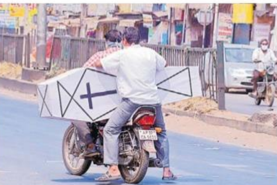
కరోనా బెయ్యలు ప్రతి పనికి కష్టమే.. కృష్ణాజిల్లా హనుమాన్ జంక్షన్ లో అయిన వారిని కోల్పోయిన ఓ కుటుంబం శవపేటికను ద్విచక్ర వాహనంపై తీసుకువెళుతున్న దృశ్యం

5 నెలలపాటు తేలాయి. అంటే... ఒకే ఇంట్లో ఒకరు కరోనాతో మరణించగా, మరో ఆరుగురికి వైరస్ సోకినట్లు నిర్ధారణ అయ్యింది. మృతుడి భార్య కూడా కరోనా కారణంగానే మరణించారనే ఆసన మనశ్శాస్త్ర వ్యవస్థాపకుడు వచ్చింది... దీనిని నిర్ధారించలేని పరిస్థితి. కరోనాతో మృతి చెందిన బాధితుడి విషయంలో వచ్చిన అనుమానాలను అధికారులు తోసివేసి చారు. బీబీ, మగధుల్పాటు శ్యాంకోశ సంబంధ వ్యాధులు ఉన్నాయని పేర్కొన్నారు. ఇప్పుడు.. మృతుడి అంత్యక్రియల సందర్భంగా దేహాన్ని తాకిన బంధువుల్లోనూ 'కరోనా' భయం మొదలైంది.