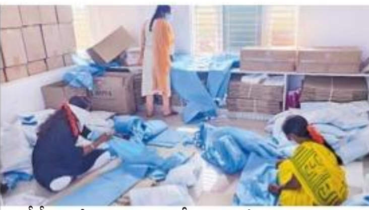
పీపీఈ కిట్లు తయారు చేస్తున్న మహిళలు