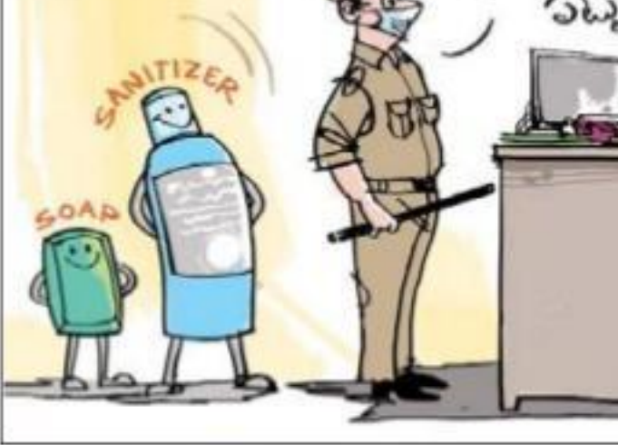
కార్టూన్, చారి పి.ఎస్