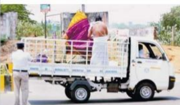
ముతపేటపై తీసుకువచ్చిన ఒకే ఒక్క కుటుంబ సభ్యుడు

విజయనగరం, ఏప్రిల్ 3 (ఆంధ్రజ్యోతి): మనీషి బతికి ఉన్నప్పుడు.. ఎన్ని రాజబోగాలైనా అనుభవించొచ్చు. కానీ పోయేటప్పుడు ఆ నలుగురూ ఉండాలి అంటారు... కానీ.. ఈ చిత్రం చూశాం... ఎంత దయనీయం! విజయనగరంలో శుక్రవారంలో కనిపించిన దృశ్యం ఇది. వి.జి.ఆఫ్సర్లకు నుంచి విజయనగరం పట్టణంలోనే వేసేందుకు ముందుగా ఓ మృతదేహాన్ని కుటుంబ సభ్యులతో శుశానికి తీసుకువెళ్లడం ద్వారా చూసిన స్థానికులు కొరవడు తీవ్ర విచారం వ్యక్తం చేశారు.