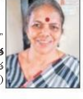
నిజా మెంబర్, అఖిల భారత ప్రజాతంత్ర మహిళా సంఘం(ఐఎన్ఎ)

ఒక ఉద్యమకారిణిగా కరోనా మహమ్మారి విస్తరిస్తున్న ఈ వేళలో ప్రజలకు అందగా నిలవాలని, వారిలోని భయం పోగొట్టాలని తపన పడుతున్నా. వారికి వైరస్ అడ్డుకోనే వచ్చు. చేధామనిపిస్తోంది. కానీ కరోనా వైరస్ నియంత్రణకు ఇనోవేషన్ ఒక్కటే మార్గం కాబట్టి దాన్ని పాటిస్తున్నా. అంటే ఉద్యమం కొత్త రూపంలో అన్యుమారు. తొందరలోనే ఈ వైరస్ అంతరించే అందరం చేయి చేయి కలపబడాలి” రోజు కోసం ఆశగా ఎదురుచూస్తున్నా.