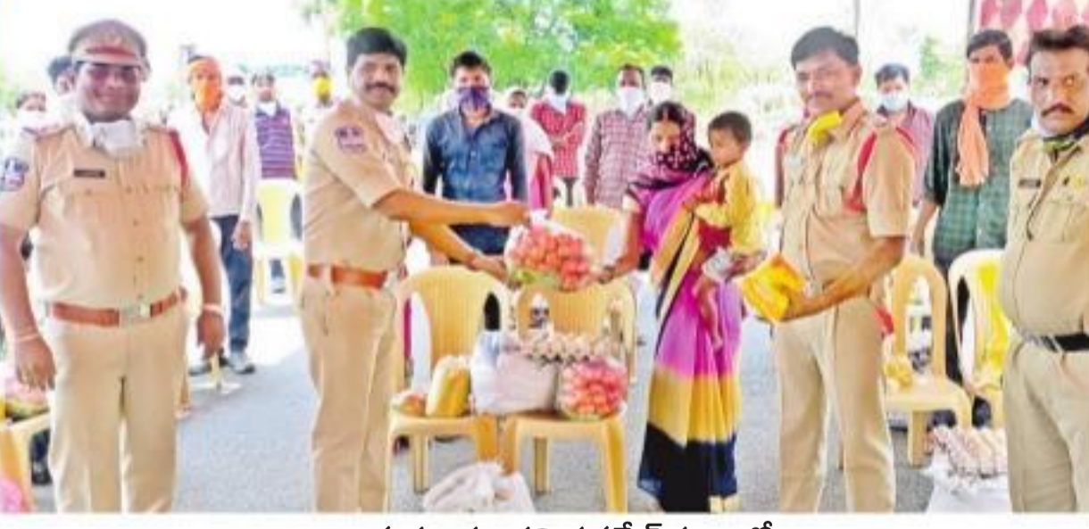
రామగుండం కమిషనరేట్ పరిధిలో వలస కూలీలకు నిత్యావసరాలు అందజేస్తున్న పోలీసులు

సార్..! నేనో బహుళజాతి కంపెనీకి సీకాటలను.. నిరాశ్రయులు, యాచకులకూ కడుపు నింపేందుకు రెండు క్రింటాక్ష బియ్యం పంపాలనుకుంటున్నా..