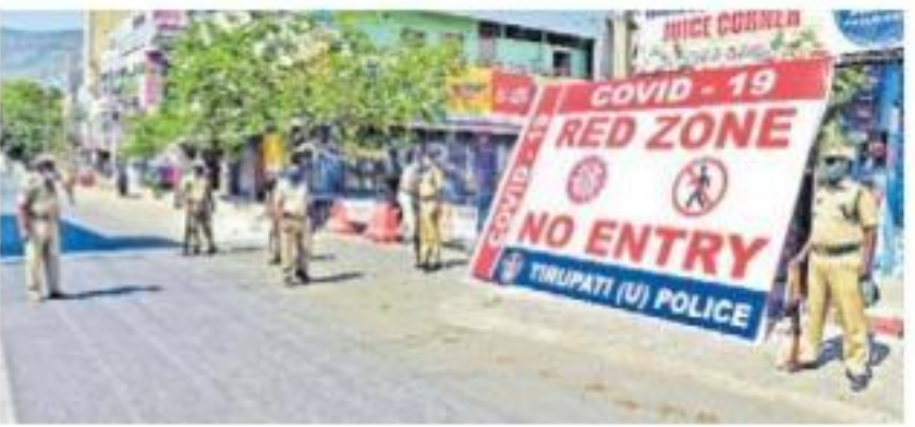
తిరుపతిలో రెడ్ జోన్ ప్రకటించిన ప్రాంతంలో పోలీసుల పహారా

తాజా పాజిటివ్ కేసుల్లో 11 ఏళ్ల బాలుడు, 14, 17 ఏళ్ల బాలికలు 32లో ముగ్గురు తప్ప అందరికీ ఢిల్లీ లింక్ గుంటూరులో 10మందికి పాజిటివ్ ఒకే కుటుంబానికి చెందిన ఐదుగురికి కృష్ణాలో 9, కడప, ప్రకాశంలో 4 చొప్పున కర్నూలులో ముగ్గురు, అనంతలో ఒకరికి తెలంగాణ నుంచి వచ్చిన ఓ మహిళకూ