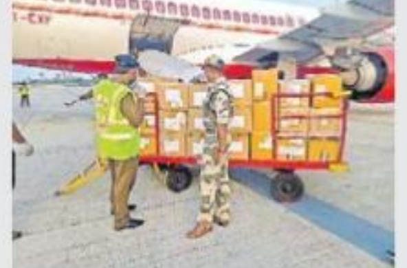
రాష్ట్రానికి చేసిన కరోనా హెల్త్ కార్గో

విజయవాడ, ఏప్రిల్ 4 (ఆంధ్రజ్యోతి): కరోనా లాక్ డౌన్ నేపథ్యంలో, కొద్ది రోజులుగా వెలవెలవేయిన విజయవాడ విమానాశ్రయం ప్రస్తుతం కార్గో విమానాలతో కేంద్ర సంరక్షణ కేంద్రం అవుతున్నట్లు తెలిస్తే, శనివారం ఎయిర్ ఇండియా తన కార్గో సేవలను ప్రారంభించింది. కరోనా నివారణకు రాష్ట్ర వైద్యారోగ్య శాఖ కోసం ముంబై నుంచి ఎయిర్ ఇండియా 68 కార్గో వైద్య ఎక్స్ప్రెస్ను తీసుకువచ్చింది. రాష్ట్రంలోని ఇన్ఫర్మేషన్ టెక్నాలజీ విభాగం వైద్య సిబ్బందికి అందించే అత్యున్నతమైన ఎన్ 95 మాస్కులు, స్టేషనరీ ఇంజనీర్లకు ఉన్నట్లు తెలుస్తోంది.