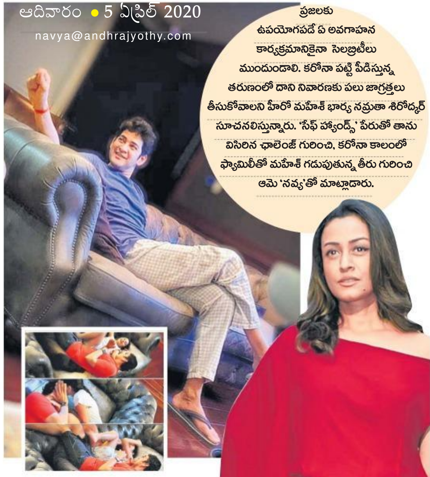
అందుకే 'సీఫ్ హ్యాండ్స్' చాలెంజ్!

కరోనా రోజులాటి ఎలా విజయిస్తుందో చూస్తూనే ఉన్నాం. ఇలాంటి ఓ విపత్తు వస్తుందని కలలో కూడా ఎవరూ ఊహించి ఉండరు. దీనిని నియంత్రించడానికి వ్యాక్సిన్, మెడిసిన్ లాంటివి ఏదీ లేదు. మనమే జాగ్రత్త వహించి, కొన్ని నియమాలు పాటించాలి. ఇంటికే పరిమితం కావాలి. స్వీయ నిర్బంధంలో ఉండడం వల్ల వ్యాప్తి తగ్గుతుంది. అదే దీని నియంత్రణకు సరైన మందు. ఇలాంటి సమయంలో సొసైటీకి గైడ్ లైన్లు చాలా అవసరం. అందుకే ఓ వీడియో చేసి సోషల్ మీడియా వేదికగా 'సీఫ్ హ్యాండ్స్' చాలెంజ్ వినిలారు. ఇది నా వంట బాధ్యత అనుకున్నా. దగ్గు, తుమ్మల వల్ల కరోనా ఒకరి నుంచి ఒకరికి వ్యాపించే వైరస్ కాబట్టి శుభ్రత, సామాజిక దూరం పాటించడం చాలా ముఖ్యం. ముక్కు, నోటికి మాస్క్, తప్పనిసరిగా ఉపయోగించాలి. చేతుల్ని