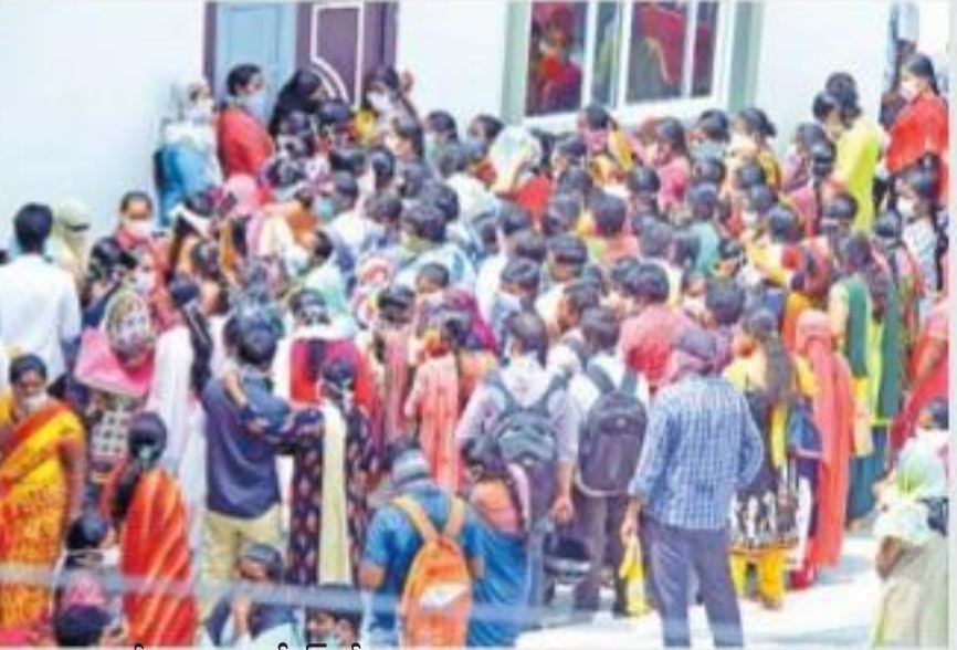
ఓంగోలు కలెక్టరేట్లో ఇంటర్వ్యూలకు హాజరైన అభ్యర్థులు

ప్రకాశం జిల్లా ఓంగోలు కలెక్టరేట్లో శనివారం కనిపించింది ధృశ్యం. కరోనా నేపథ్యంలో ప్రజలు భౌతిక దూరం పాటించాలని ప్రభుత్వాల మొత్తంకూ... తాత్కాలిక ఏఎన్ఎం పోస్టు డిస్ట్రిక్ అధికారులు ఇంటర్వ్యూ ఏర్పాటు చేసి. కనీస జాగ్రత్తలు కూడా తీసుకోలేదు. ఆ ప్రాంగణంలో నిరుద్యోగులు గుంపులుగుంపులుగా కనిపించడంపై విమర్శలు వినిపించాయి. అలాగే, ప్రభుత్వం పేదలకు ఇస్తున్న రూ.1000 పంపిణీ తదితర కార్యక్రమాల్లో పలుకోట్ల కీలక ప్రజాప్రతినిధులు, అధికార పార్టీ నేతలు కార్యక్రమంలో గుంపులు గుంపులుగా పాల్గొనడం కనిపించింది. వై.పా. రెంట్ మంత్రి సురేశ్, ముండ్లమూరులో మండలం వేములలో దర్శి ఎమ్మెల్యే వెంకటేశ్వర్లు, అధ్యక్షి అర్బుజ్ లో నియోజకవర్గ వైసీపీ ఇన్చార్జి కృష్ణవేణకన్న, అలాగే పలుకోట్ల అధికారపార్టీ నేతలు, కార్యకర్తల గుంపులుగా వర్తించడంపై విమర్శలొచ్చాయి. - ఒంగోలు